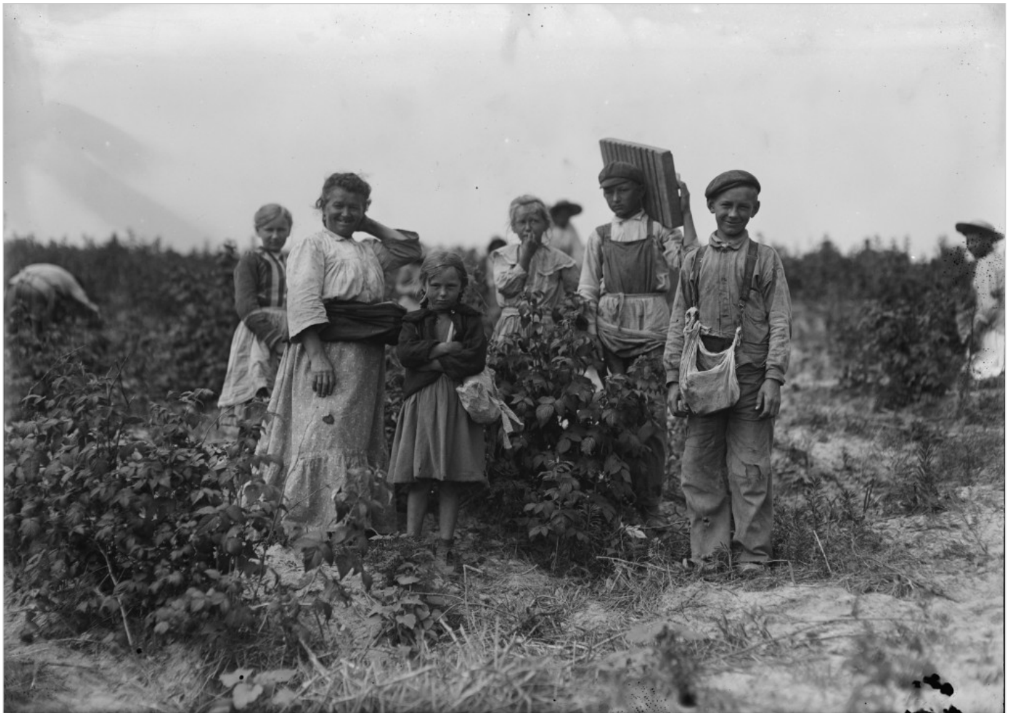
Polscy emigranci w USA na początku XX w., fot. Wikipedia.

Joanna Sokołowska-Gwizdka: „Poza gniazdem. Wizerunki emigrantki polskiej w Kanadzie w XX wieku” , to źródłowe studium na temat kobiet emigrujących do Kanady. Dlaczego zainteresowała się Pani kobietami na emigracji, a nie np. emigracją z Polski w sensie ogólnym?