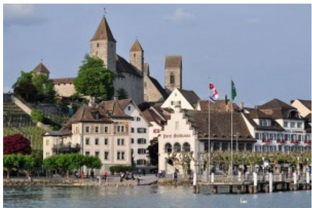
Zamek w Rapperswilu