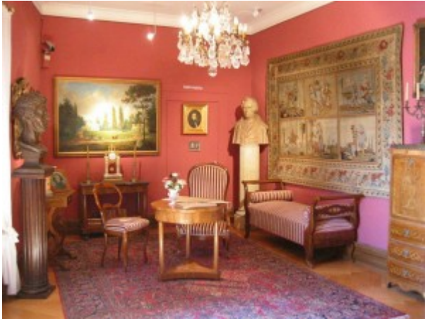
Muzeum Polskie w Rapperswilu w Szwajcarii

Los Muzeum Polskiego, którego siedziba znajduje się w średniowiecznym zamku w pobliżu malowniczego Jeziora Zuryskiego, stoi pod znakiem zapytania. Starania polskiej dyplomacji, aby po 140 latach nadal utrzymać tę polską placówkę w Szwajcarii, jakże ważną dla historii polskiej kultury na emigracji, nie przyniosły rezultatów. W miejscu polskiego muzeum ma powstać restauracja i muzeum gminne. (red.)