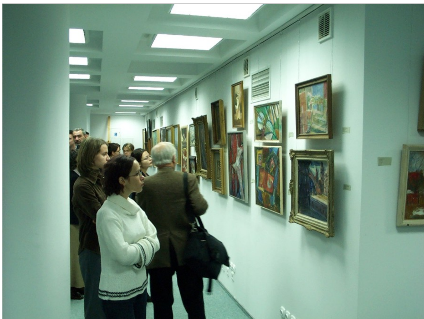
Archiwum Emigracji, Galeria, Toruń

księgozbiory, fotografie lub zbiory pamiątek i sztuki związane z działalnością emigracji polskiej w XX wieku. Powierzone nam materiały zostaną opracowane i będą służyć do badań naukowych.