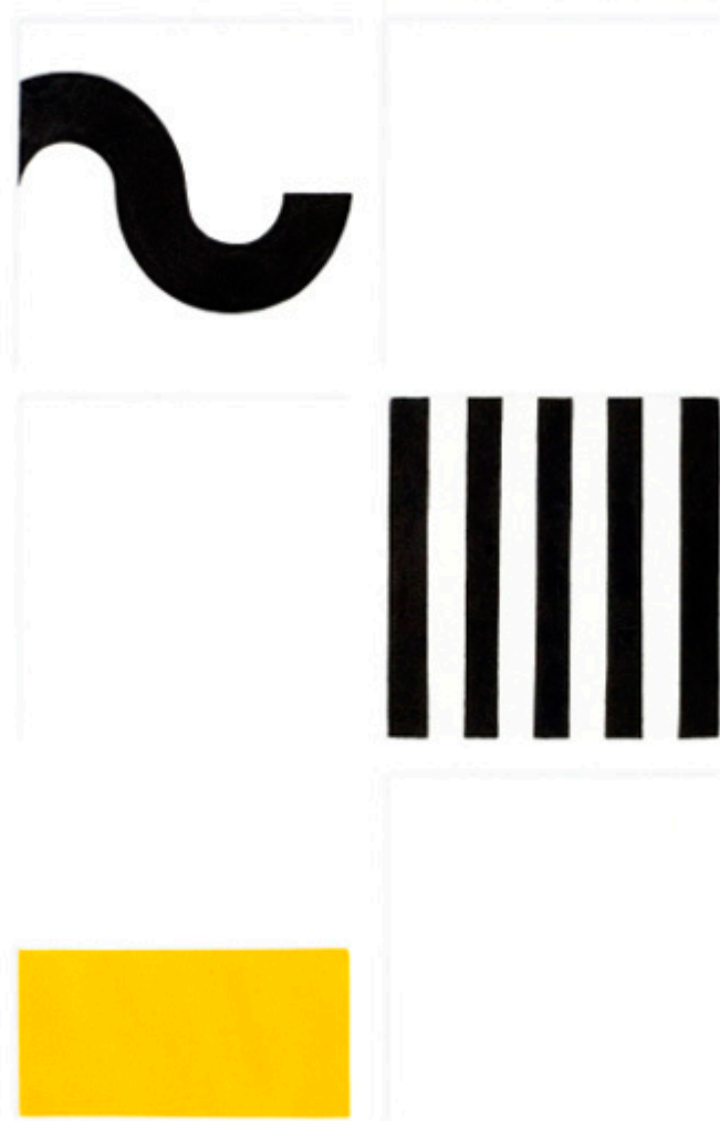
Leszek Wyczółkowski, INTRODUCTION, akwatinta 2008.