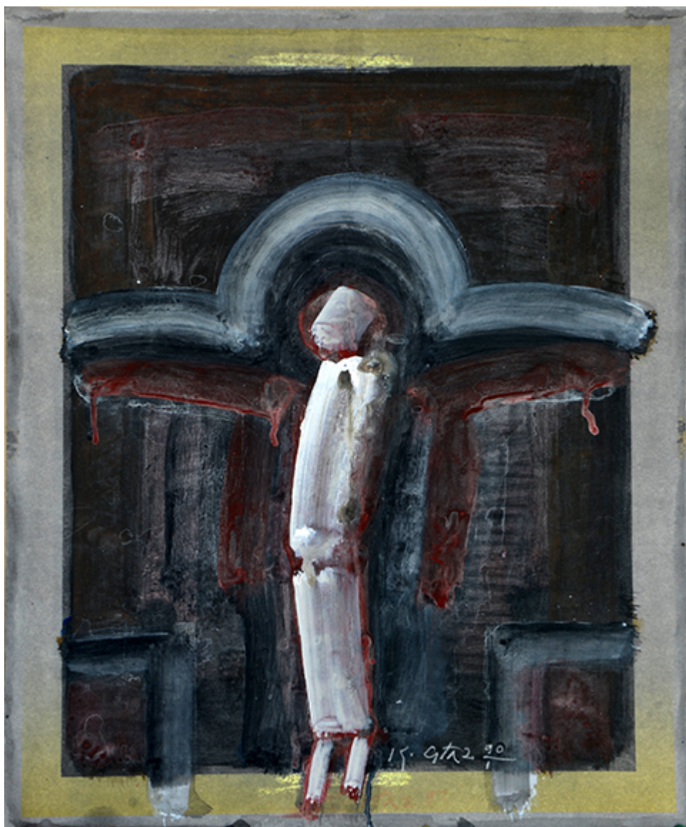
Kazimierz Głaz, Gwasze