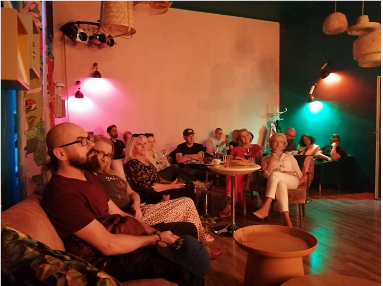
Publiczność podczas promocji płyty w Krakowie

[Redacted text block consisting of multiple horizontal black bars]