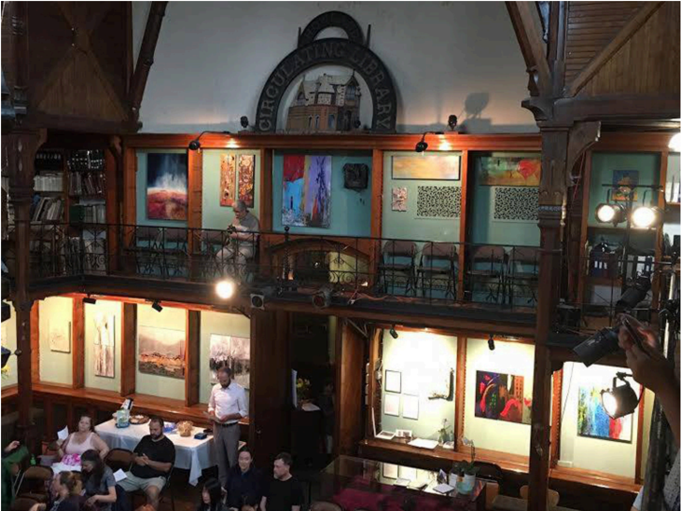
Wystawa w Howland Cultural Center w Beacon, NY.