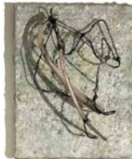
Kathryn Hart, "Cellular No 2"