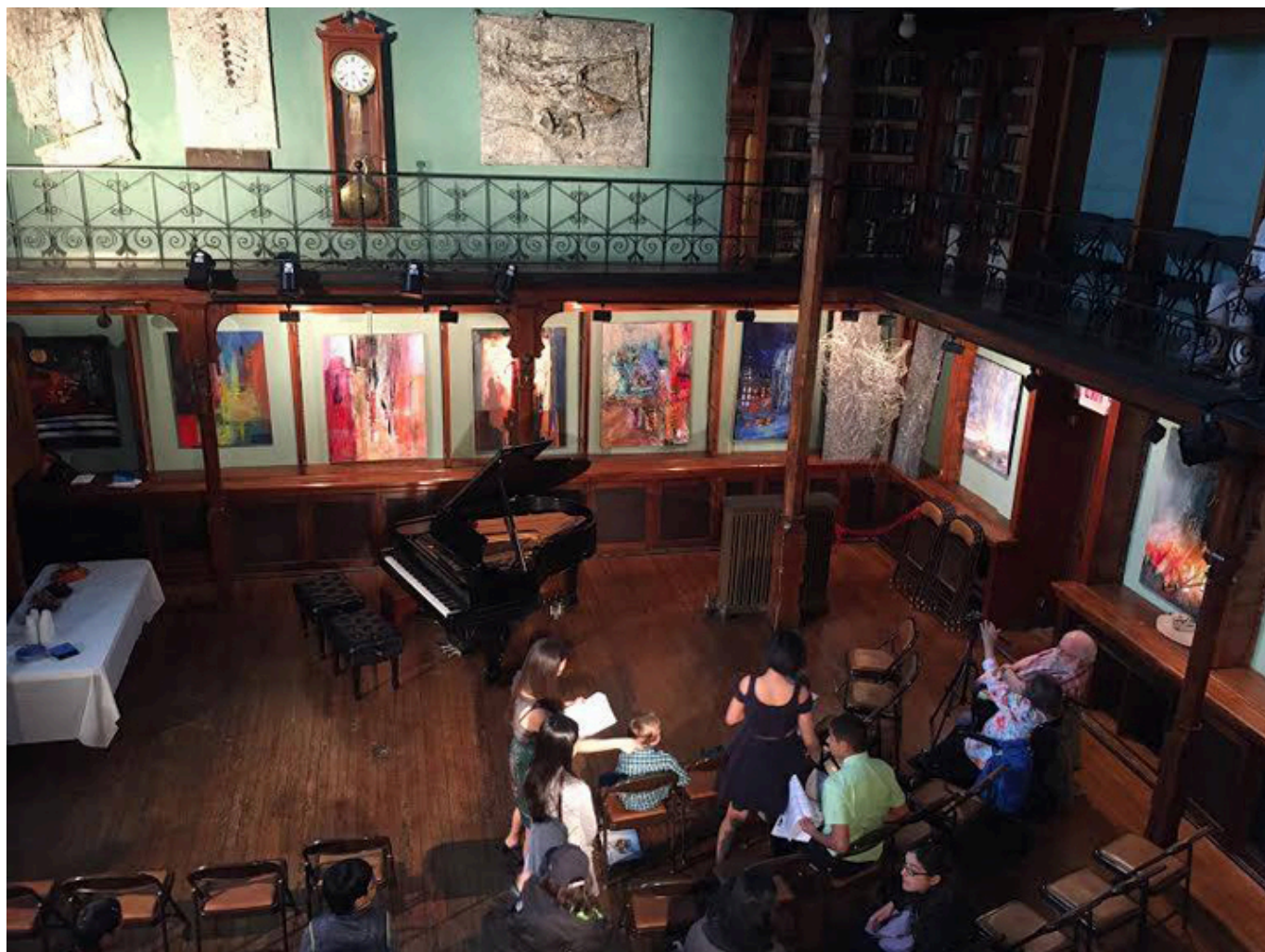
Wystawa w Howland Cultural Center w Beacon, NY.