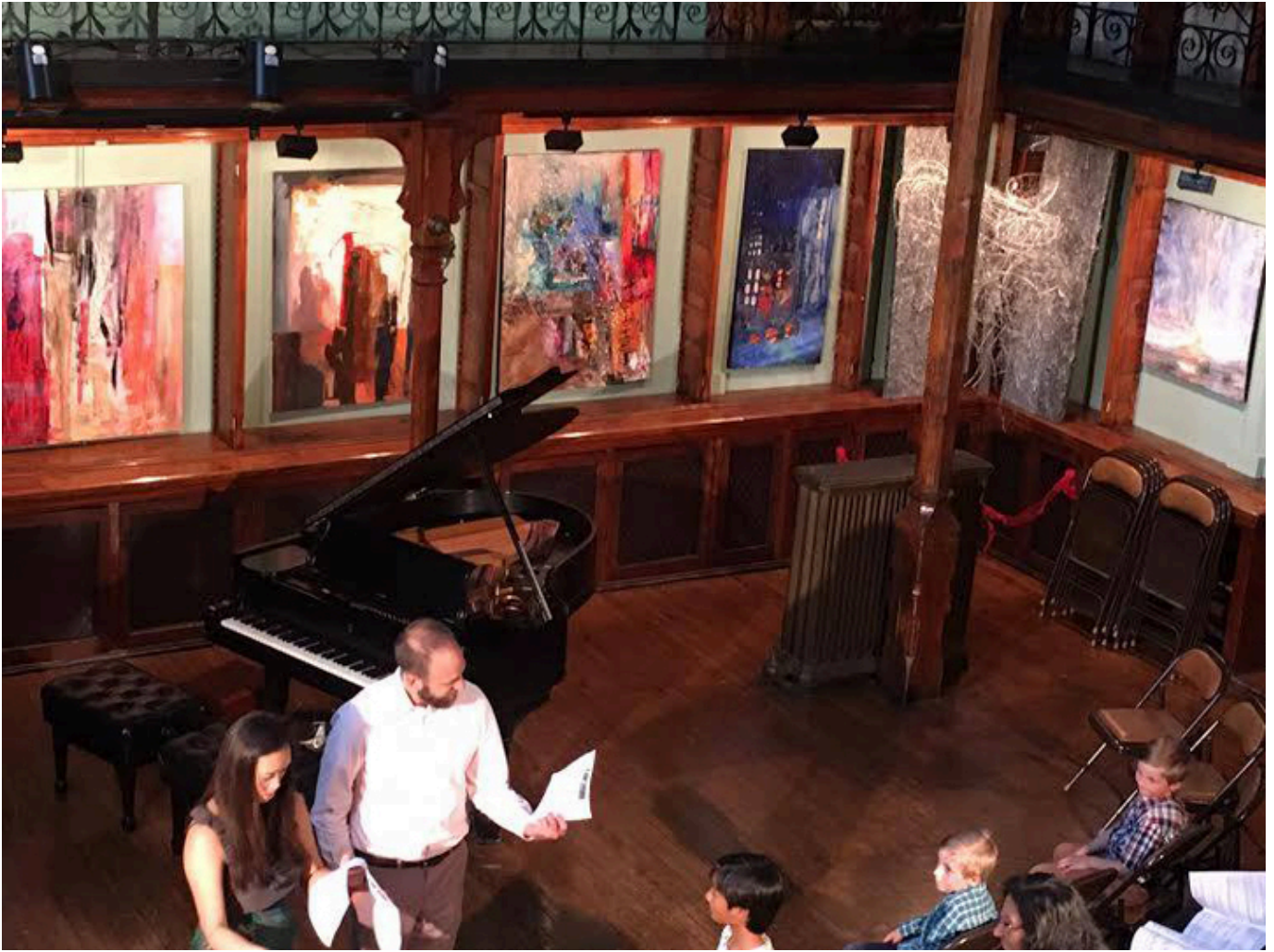
Wystawa w Howland Cultural Center w Beacon, NY.