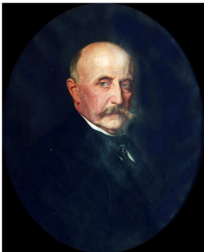
Portret Stanisława Kazimierza Kossakowskiego, XIX w., Archiwum Cyfrowe „Wojtkuszki”, wikimedia commons