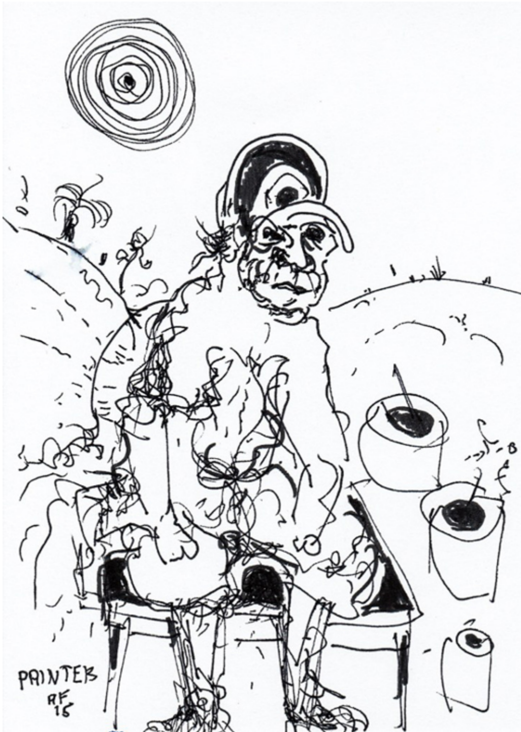
Adam-Fiala, Painter, rysunek

Ekspozycja w Domu Polonii w Krakowie prezentuje ponad 40 prac Artysty z lat 2010-2017, malarstwo (akwarele, gwasze) oraz rysunki wykonane różnymi technikami. Prace zostały pokazane w seriach, założonych od początku przez samego twórcę (np. seria