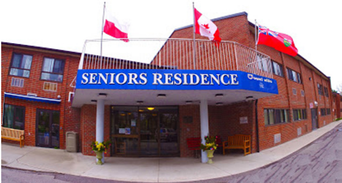
Wejście do siedziby Domu Seniora Wawel Villa w Mississaudze, gdzie mieści się Muzeum im. Bolesława Orlińskiego.

Pierwsze zbiory pamiątek ograniczały się do polskiego lotnictwa, ale szybko doszły inne przedstawiające wszystkie rodzaje Polskich Sił Zbrojnych na Zachodzie, dary Polonii miejscowej i innych skupisk polonijnych w okolicach torontońskiej metropolii. Po stosunkowo niedługim czasie Muzeum mogło urządzać wystawy eksponatów nie tylko lotnictwa, ale też Wojska Polskiego, Marynarki i nawet Brygady Spadochronowej. W maju 2012 r. Muzeum wzbogaciło się o zbiory z nieczynnego Polonia Museum , aktywnego przez parę lat przy Polskiej Placówce Kanadyjskiego Legionu 418 w St. Catharines, Ontario.