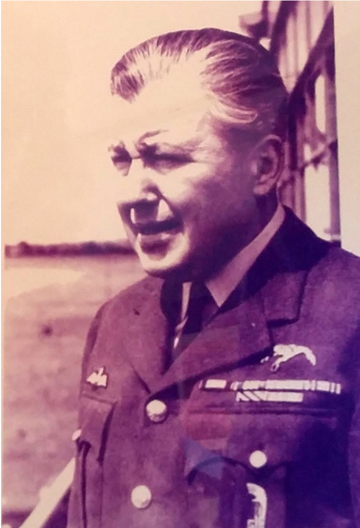
Plk. Bolesław Orliński, fot. Muzeum im. B. Orlińskiego w Mississaudze.

Wolontariusze/pracownicy organizują wystawy zbiorów muzealnych na spotkaniach z młodzieżą Szkół Polskich w okolicach metropolii torontońskiej czy też w St. Catharines, Ontario. Organizowane są również wystawy Muzeum na dorocznych polonijnych Festynach takich jak „Festiwal ulicy Roncesvalles” w Toronto czy „Dzień Polski” w Mississaudze, Ontario.