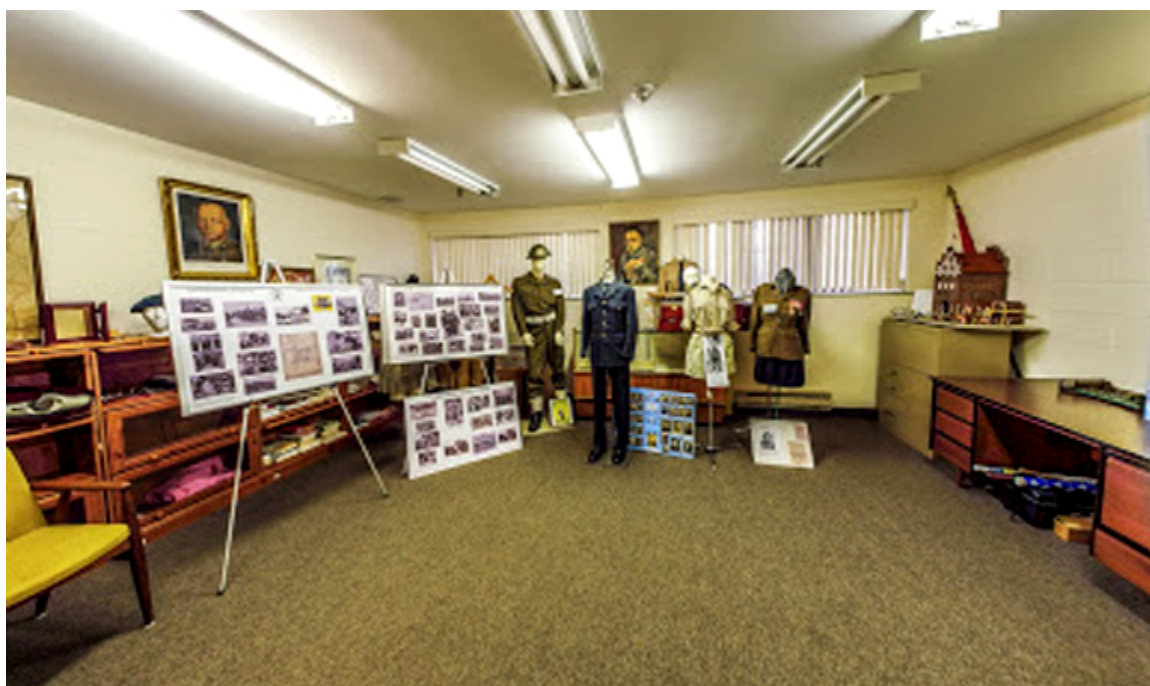
Pokój Andersa w Muzeum im. Bolesława Orlińskiego, z mundurami kadeta, lotnika, młodszej ochotniczki i junaka.

mundurów kadeckich, junackich, młodszych ochotniczek i młodego lotnika. Między innymi są tam składy podręczników szkolnych, wydawnictw z Jerozolimy w latach 1943 i później, ręcznie sporządzone skrypty, odznaki szkolne i albumy z oryginalnymi zdjęciami z tamtych lat. W toku publikacji jest obszerna Historia Wojskowych Szkół Junackich w latach 1941-1947 autorstwa jednego z kustoszy/wolontariuszy.