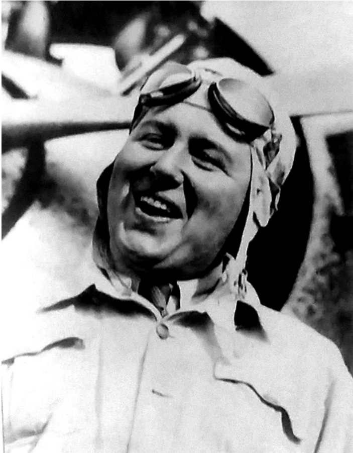
Płk. Bolesław Orliński, fot. Muzeum im. B. Orlińskiego w Mississaudze.