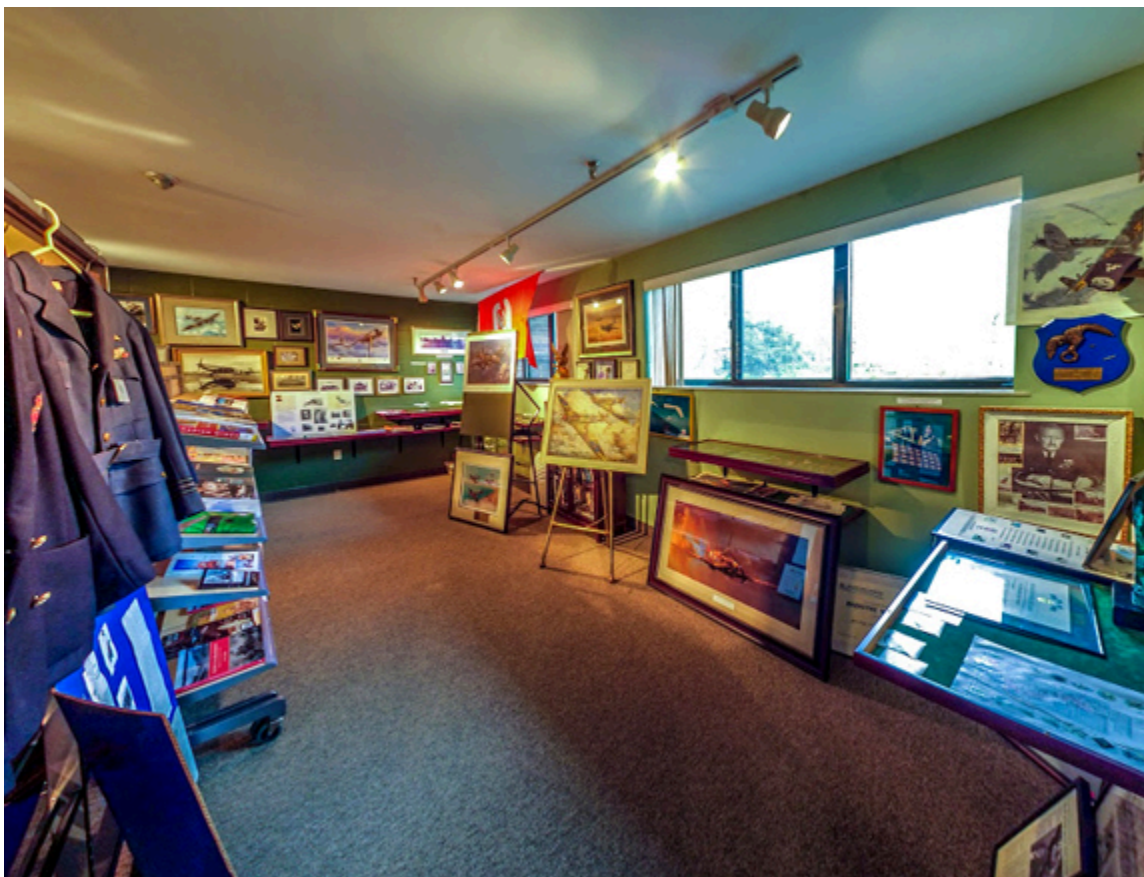
Muzeum im. Bolesława Orlińskiego w Mississaudze.

Biblioteka przy Muzeum z ponad tysiącem pozycji prac historycznych, dokumentalnych i pamiętnikarskich, jak też obszerne i ważne składy dokumentacji archiwalnej, mogą służyć badaczom, naukowcom i młodzieży w pracach akademickich.