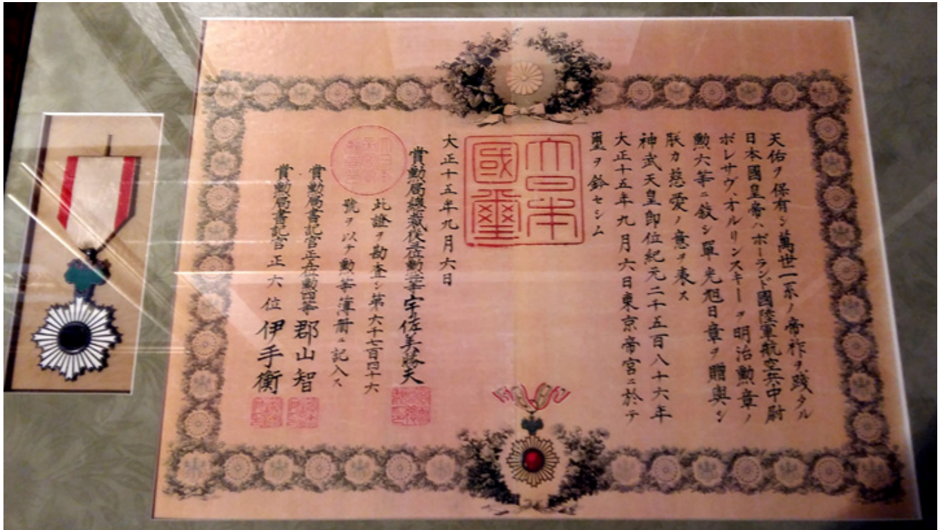
Order „Wschodzącego Słońca” oraz Dyplom od Cesarza Japonii w uznaniu zasług dla pilota, fot. Muzeum im. B. Orlińskiego.