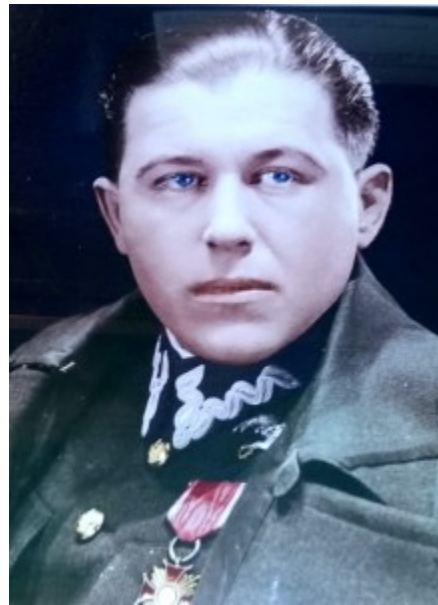
Plk. Bolesław Orliński