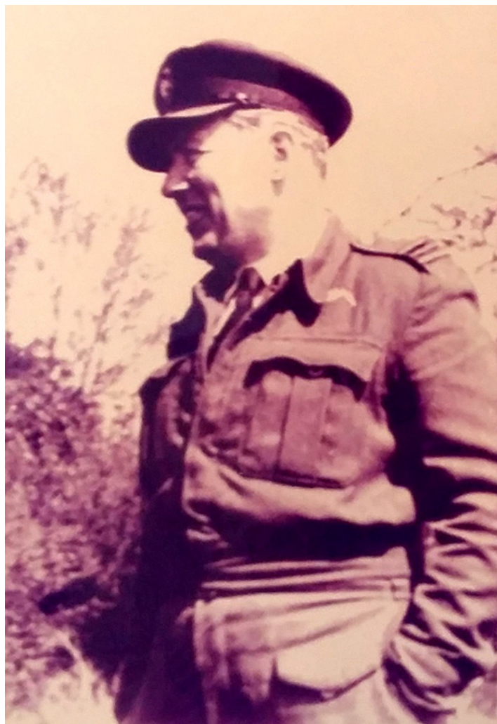
Płk. Bolesław Orliński

historię 22-tysięcznej Polskiej Ochotniczej Armii, która ćwiczyła się w Niagara-on-the-Lake w Ontario, a potem walczyła we Francji w 1918 r. i jako część Armii Hallera w latach 1919-1920 i brała udział w walkach o granice Polski. W Muzeum miasteczka Niagara-on-the-Lake ci kuratorzy/wolontariusze zorganizowali bogatą wystawę pamiątek po tych żołnierzach, jak i zdjęć czy plansz z życia obozowego. Wielu z kuratorów/wolontariuszy bierze udział w specjalnych uroczystościach na polskim wojskowym cmentarzyku w tym miasteczku.