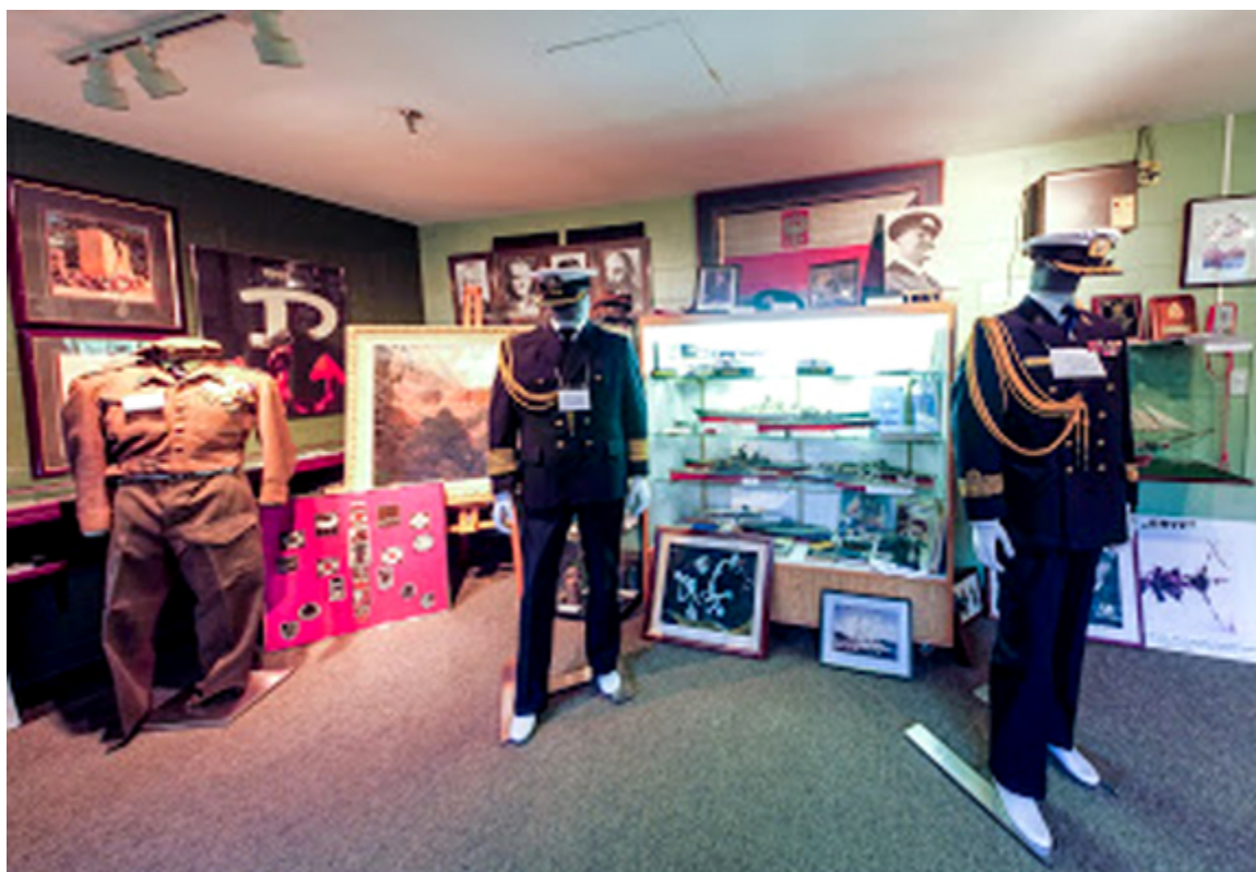
Muzeum im. Bolesława Orlińskiego w Mississaudze.

Stała ekspozycja w Muzeum Orlińskiego przedstawia zbiory wielu ważnych i niezwykłych pamiątek, mundurów i wysokich odznaczeń wojskowych, oryginalnych obrazów i albumów z fotografiami z czasów II wojny światowej. W składach można znaleźć oryginalne dokumenty, legitymacje, świadectwa, dyplomy i inne bezcenne archiwalia.