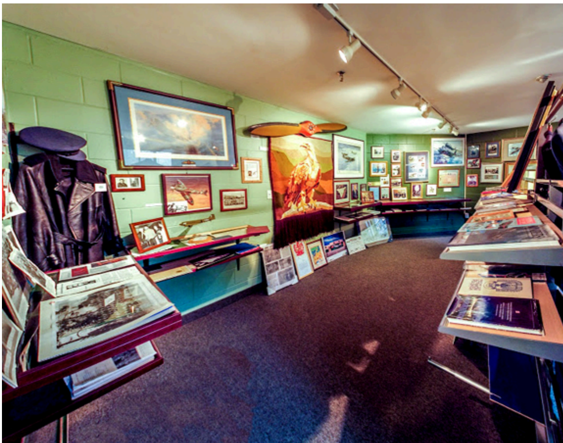
Muzeum im. Bolesława Orlińskiego w Mississaudze.

Muzeum Orlińskiego bez zastrzeżeń może twierdzić, że nie istnieją tak bogate zbiory pamiątek czy też materiałów historycznych dotyczących Wojska Polskiego z okresu II wojny światowej przy jakiegokolwiek grupie lub organizacji polonijnej w Kanadzie. Zapraszamy wszystkich chętnych do zwiedzania Muzeum Płk. Pilota Bolesława Orlińskiego.