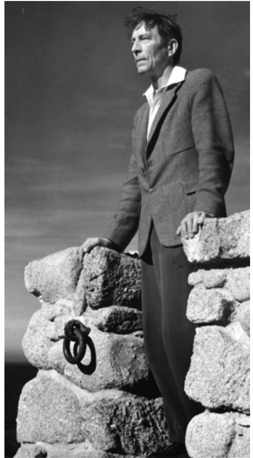
Robinson Jeffers, 1940 r.

Kiedy ptaki nadciągną znowu z nad wód, niech zakwilą wieloma głosami. A myśli ludzkie niech im odpowiedzą też na wiele głosów, wieloma językami, wieloma wierszami. Bo mnogość myśli jest potrzebna duszy ludzkiej. Mnogość takich kwilących myśli, gdy nastaje nowy świt nad skałami Wielkiego Południa. Potrzebne są duszy ludzkiej dźwięcznie hałasujące sokoły i mewy i kormorany. Nad skałami i piaszczystymi brzegami światów, które się właśnie wyłaniają z tajemnych wód. Myśli takie jak ta o ludziach w kutrach rybackich, płynących na skraju mgły. O ludziach w łodziach, które okrążyły Półwysep płynąc ku bojom w porcie Monterey , i które wydają się płynąć wprost z baśni, między skałami a kłębami oparów . I o ludziach patrzących na powracających z połowu rybaków. O nas, którzy powinniśmy wiedzieć, że wszystkie sztuki gasną wobec istotnej rzeczywistości stworzeń zajętych swoimi sprawami wśród równie poważnych żywiołów natury . Lub inna myśl. O tym, że kiedy nasi ojcowie przeszli w bród pierwszą rzekę Azji i przekroczyli tym samym pierwszą granicę świata oraz kiedy Atlantyk huśtał angielski dąb a żeglarz nie wiedział, że czeka go jeszcze jeden ocean, już wtedy piły ze źródła piękna oczy orłów . A morza rozpościerały się od