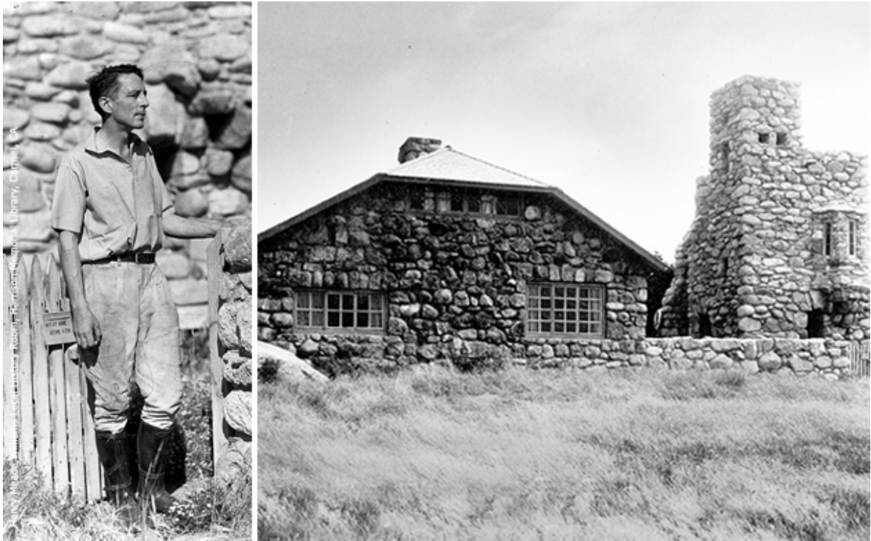
Robinson Jeffers i jego dom w Carmel na wybrzeżu Kalifornii.

Echa tych sanskryckich wierszy można znaleźć u Jeffersa, kiedy mówi o hałasie, który czyni słońce ", a także o „ wojnie, łamiącej wszelkie obietnice, zabijającej tych, których uwalnia ". I o sztormie, który „nadchodzi, kiedy lwy polują wśród nocy pociętej piorunami .