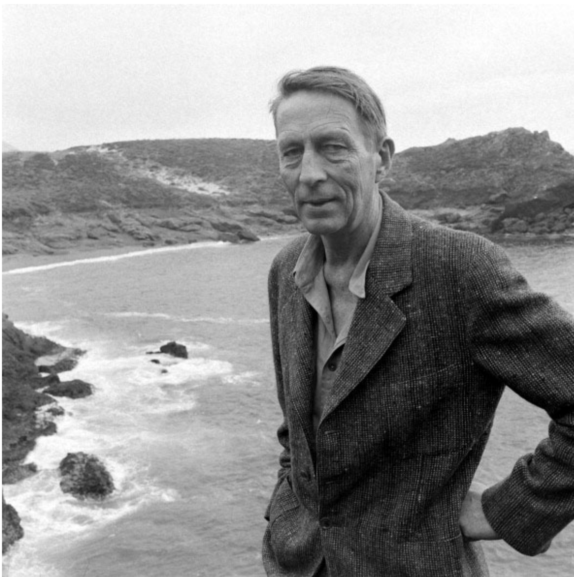
Robinson Jeffers, fot Getty Images.

w iskrzeniu trawy. Zostawiłem światło aby się sączyło z grobu do ziemi na dowód swojej miłości.