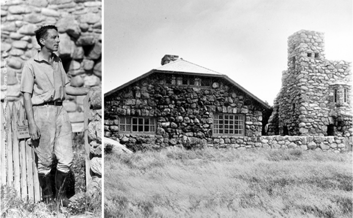
Robinson Jeffers i jego dom w Carmel na wybrzeżu Kalifornii.

Echa tych sanskryckich wierszy można znaleźć u Jeffersa, kiedy mówi o hałasie, który czyni słońce ”, a także o „ wojnie, łamiącej wszelkie obietnice, zabijającej tych, których uwalnia ”. I o sztormie, który „nadchodzi, kiedy lwy polują wśród nocy pociętej piorunami .