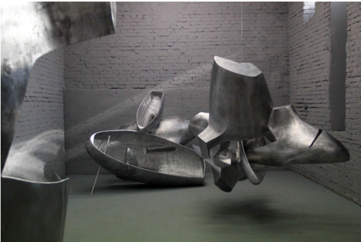
Rzeźby z cyklu „Moby Dick”, Czwórnia 2014 r., warszawskie studio artysty, fot. Krzysztof M. Bednarski.

BLC: Czym jest dla Pana tworzenie z rzeczy napotkanych, odnalezionych, wydrążonych przez czas, jak owa łódź, która zainspirowała do „Moby Dicka”?