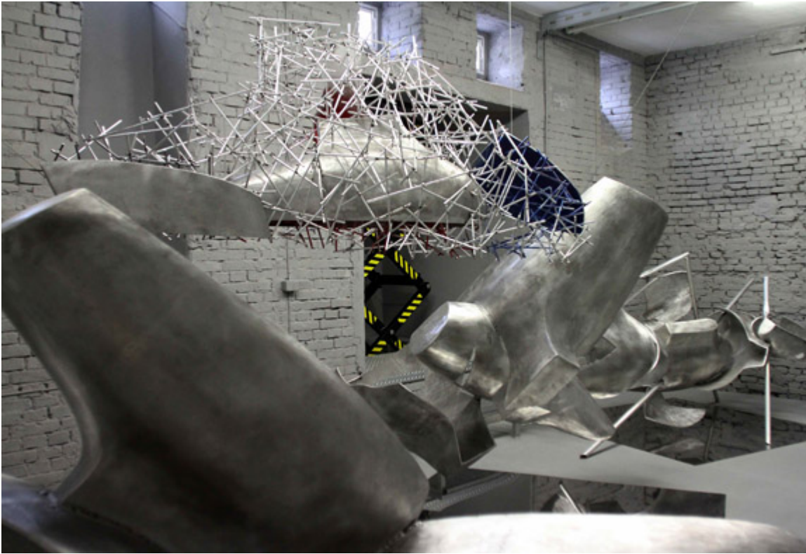
Rzeźby z cyklu „Moby Dick”, Czwórnia 2014 r., fot. Leszek Fidusiewicz.