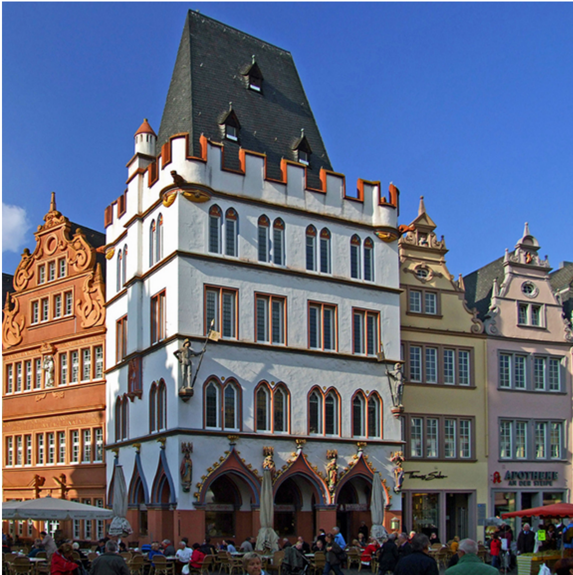
Trewir. Rynek Główny. Kamienica pod Arkadami i Czerwona Kamienica.

Podczas drugiego wyjazdu na wykład do Gießen , czy też wracając stamtąd, już nie pamiętam, a było to w dniach 10-12 lipca 1994 r., zatrzymałem się we Frankfurcie nad Menem . Upał był wówczas nieznośny. Obejrzałem zabytkowy ratusz z XV w. i szachulcowe kamieniczki na rynku, gotycki kościół Świętego Mikołaja z końca XIII w., gotycką Farę Świętego Bartłomieja z XIV w. i Dom Goethego, ale tylko z zewnątrz.