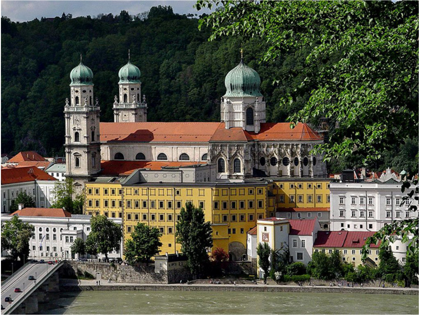
Pasawa. Widok na Katedrę św. Szczepana ze wzgórza Panny Marii Wspomożycielki.