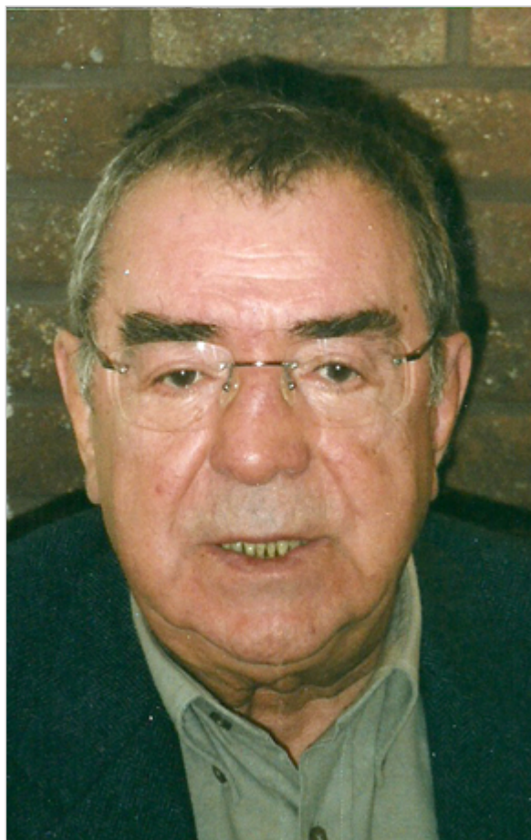
Prof. Waldemar Świerzy

W dniu 18 maja 2015, już po śmierci Waldemara Świerzego, na Zamku Królewskim w Warszawie doszło do wernisażu wspaniale przygotowanej wystawy, której towarzyszył pięknie wydany album Nowy poczet władców Polski . Waldemar Świerzy kontra Jan Matejko . Wystawy na której obok siebie zaprezentowano oba poczty z odpowiednimi opisami.