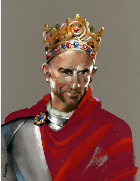
Władysław Jagiełło