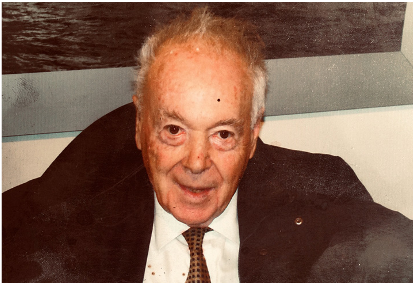
Jarosław Abramow-Newerly

Rozmowa z Jarosławem Abramowem-Newerlym, kompozytorem, satyrykiem, dramatopisarzem, pisarzem - o ludziach, wydarzeniach i sytuacjach, które pozostały w pamięci.