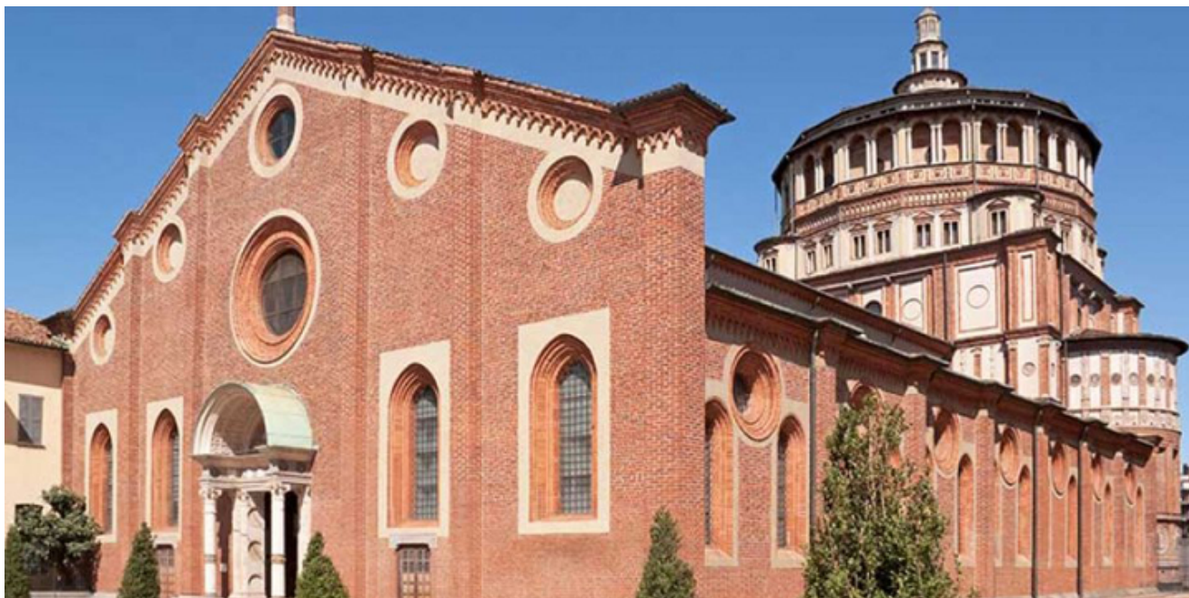
Kościół Santa Maria delle Grazie.

z limitowanych do kilkunastu osób, grup chętnych do zobaczenia Ostatniej Wieczery . Zdarza się jednak, że w okresie turystycznego szczytu, mając wcześniej zarezerwowane miejsce w kolejce, trzeba czekać ponad sześćdziesiąt dni, na moment wejścia do mediolańskiego refektarza.