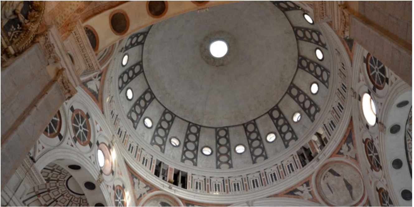
Kościół Santa Maria delle Grazie.