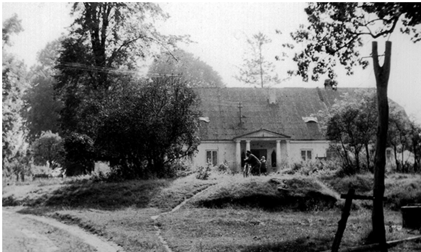
Dwór w Kraśnicy, podjazd