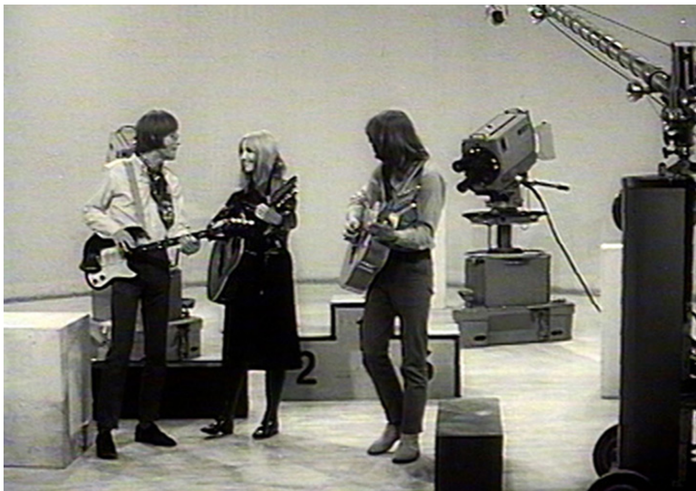
„Maryla. Tak kochałam”, reż. Michał Bandurski i Krystian Kuczkowski