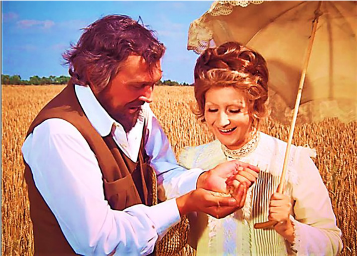
Jerzy Bińczycki jako Bogumił Niechcic i Jadwiga Barańska jako Barbara Niechcic w filmie „Noce i dnie”