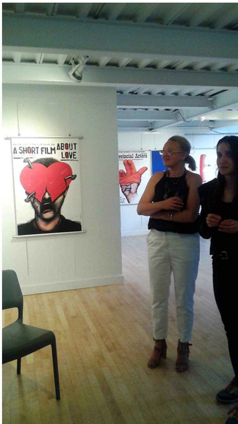
Wystawa prac polskich artystów w Ottawie, fot. arch. autorki,