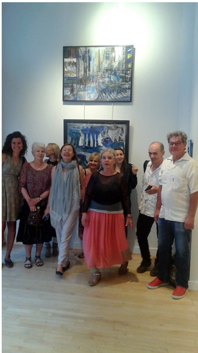
Wystawa prac polskich artystów w Ottawie