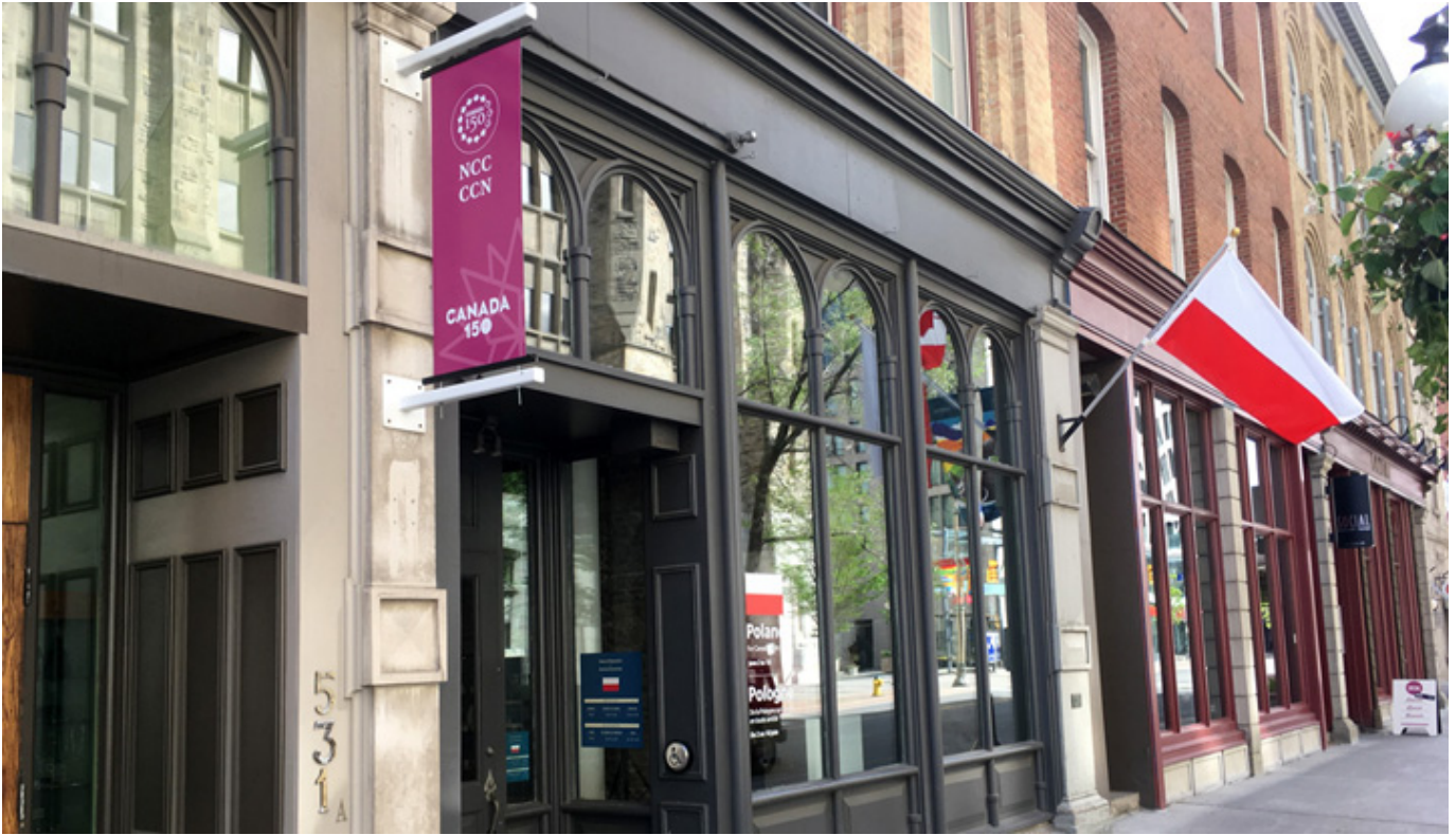
The International Pavilion w Ottawie, gdzie miała miejsce wystawa.