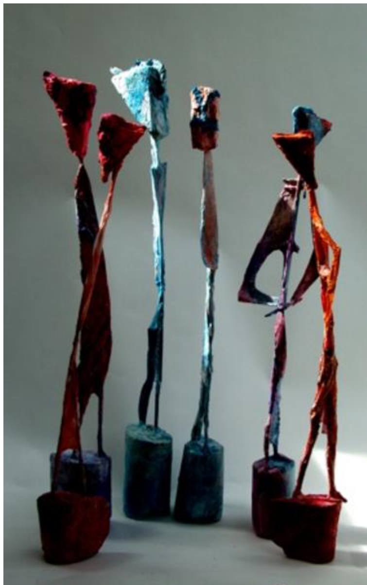
Gossiping six, 2004 r.