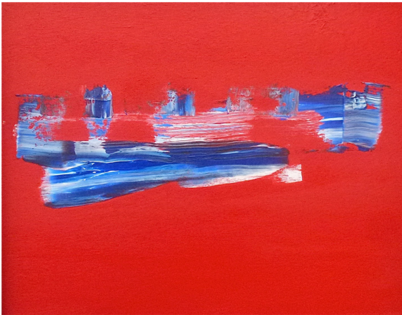
Abstract in Red No 3, oil on canvas, 40 x 50 cm.