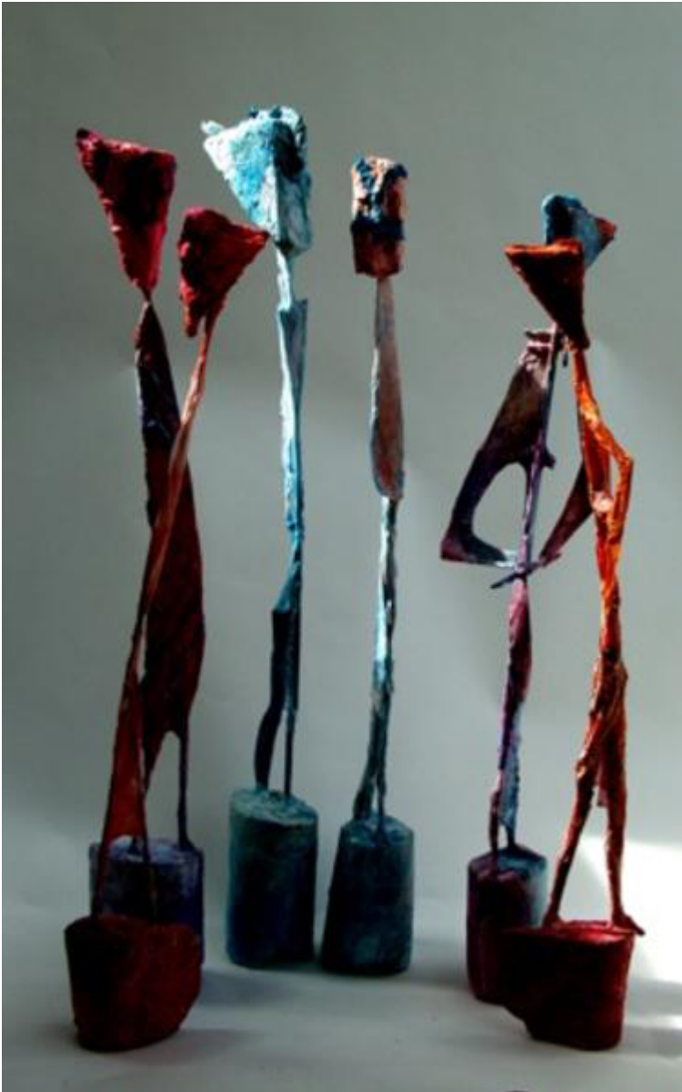
Gossiping six, 2004 r.