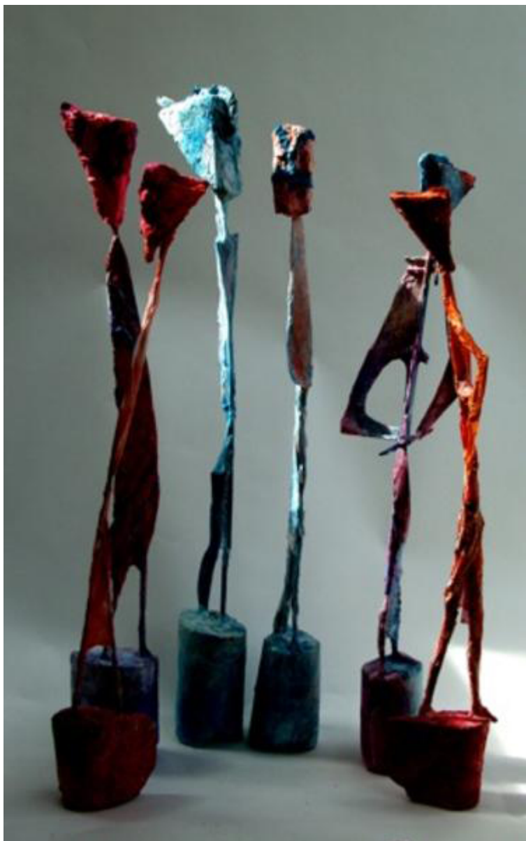
Gossiping six, 2004 r.