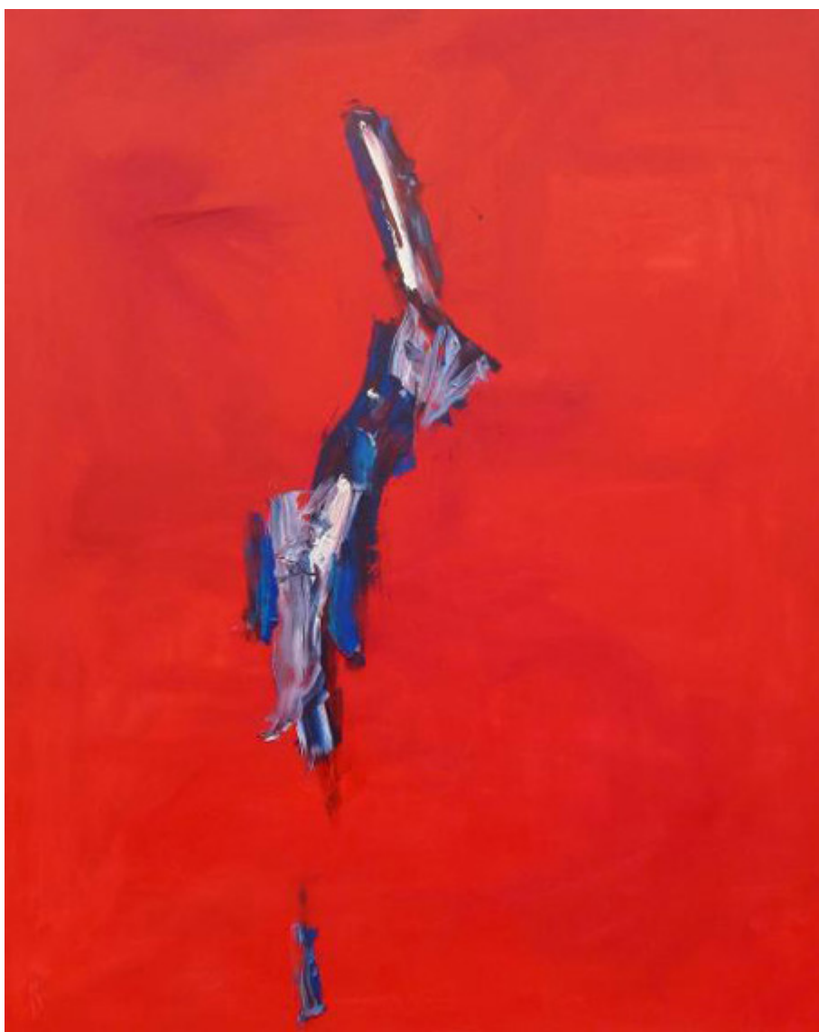
Abstract in Red No 1, oil on canvas and resin coat, 122 x 152.5 cm.