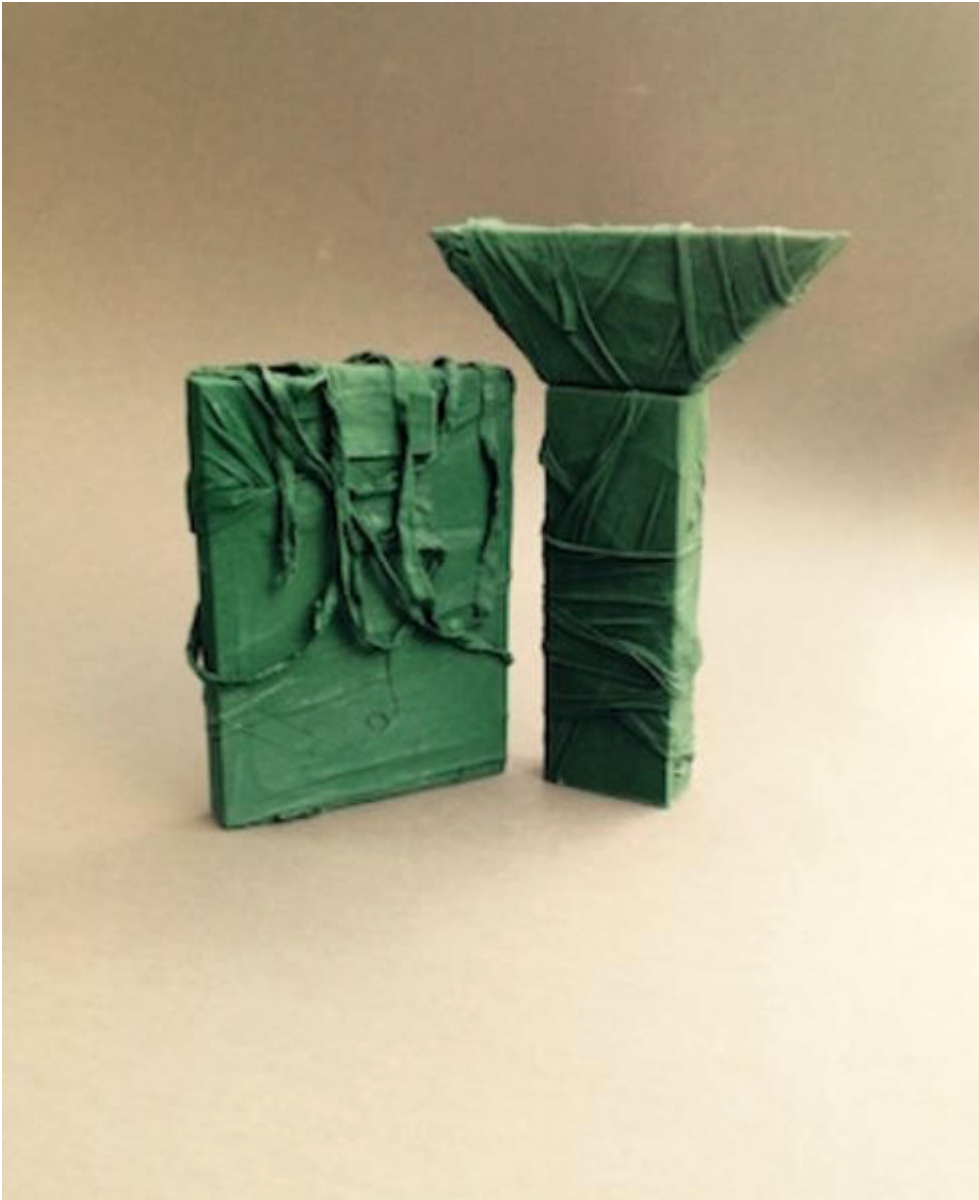
Two forms, 2016.