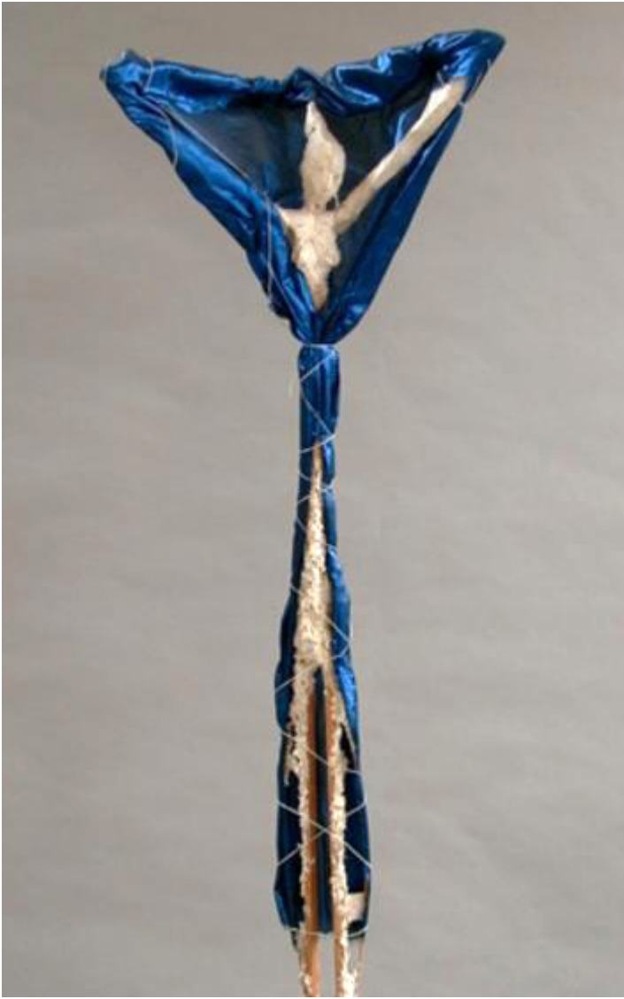
Catwalk figure, 2004 r.