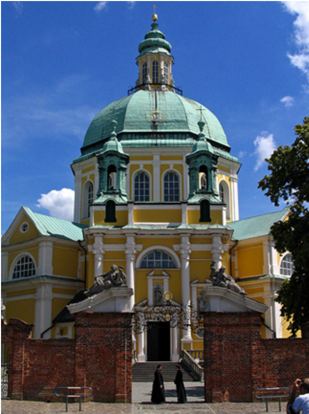
Klasztor w Gostyniu

W klasztorze oo. filipinów na Świętej Górze w Gostyniu zachowała się większość jego spuścizny kompozytorskiej. Część utworów znajduje się również w archiwach parafii farnych w Poznaniu, Grodzisku i katedry w Gnieźnie, a także na Jasnej Górze w Częstochowie.