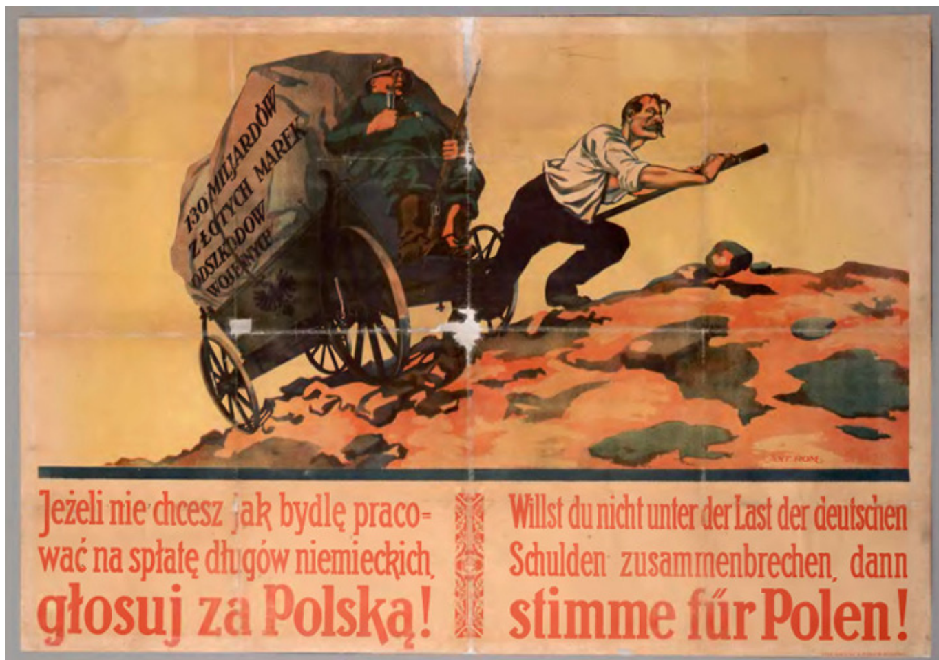
Anonim, 1921 r.