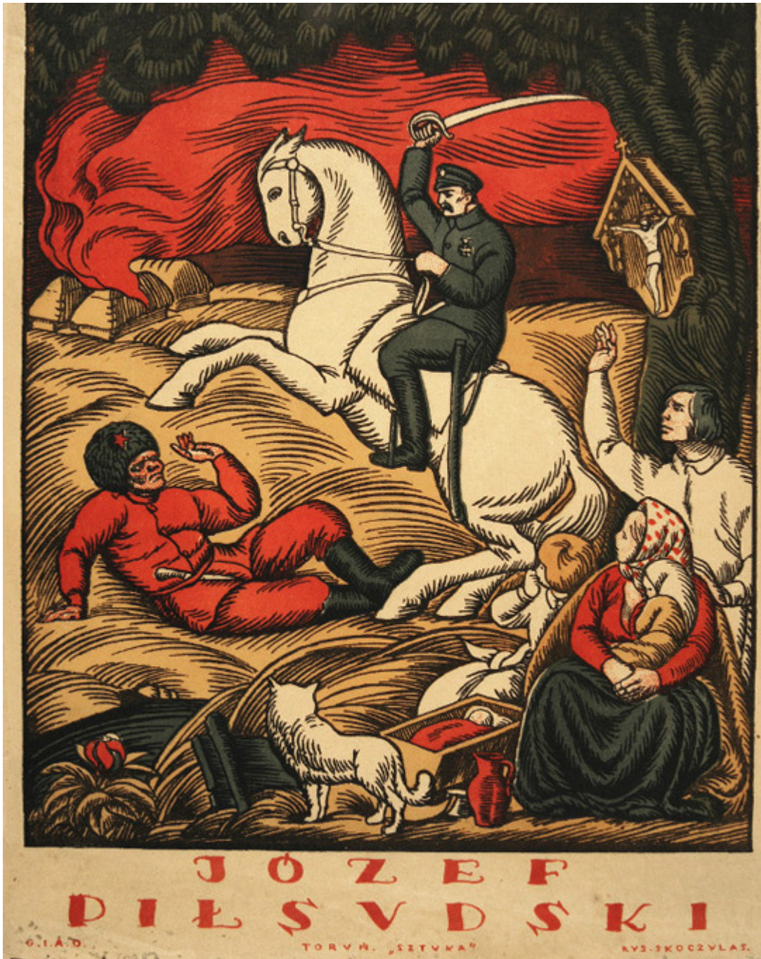
Władysław Skoczylas, 1920 r.