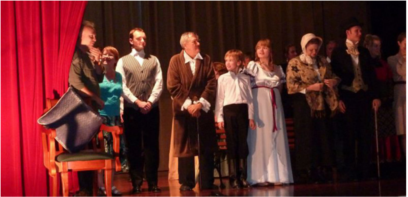
Zespół teatru Scena 98 z Perth po spektaklu „Portret z kobietami”, 2011 r., fot. Anna Habryn.

Natomiast sztuka Habryn dociera skutecznie do widza i czytelnika, nadając życie cieniom i docierając tam, gdzie uczone dzieła nie dotrą. I powinna być udostępniona nie tylko Polonii, lecz i widzom w Polsce.