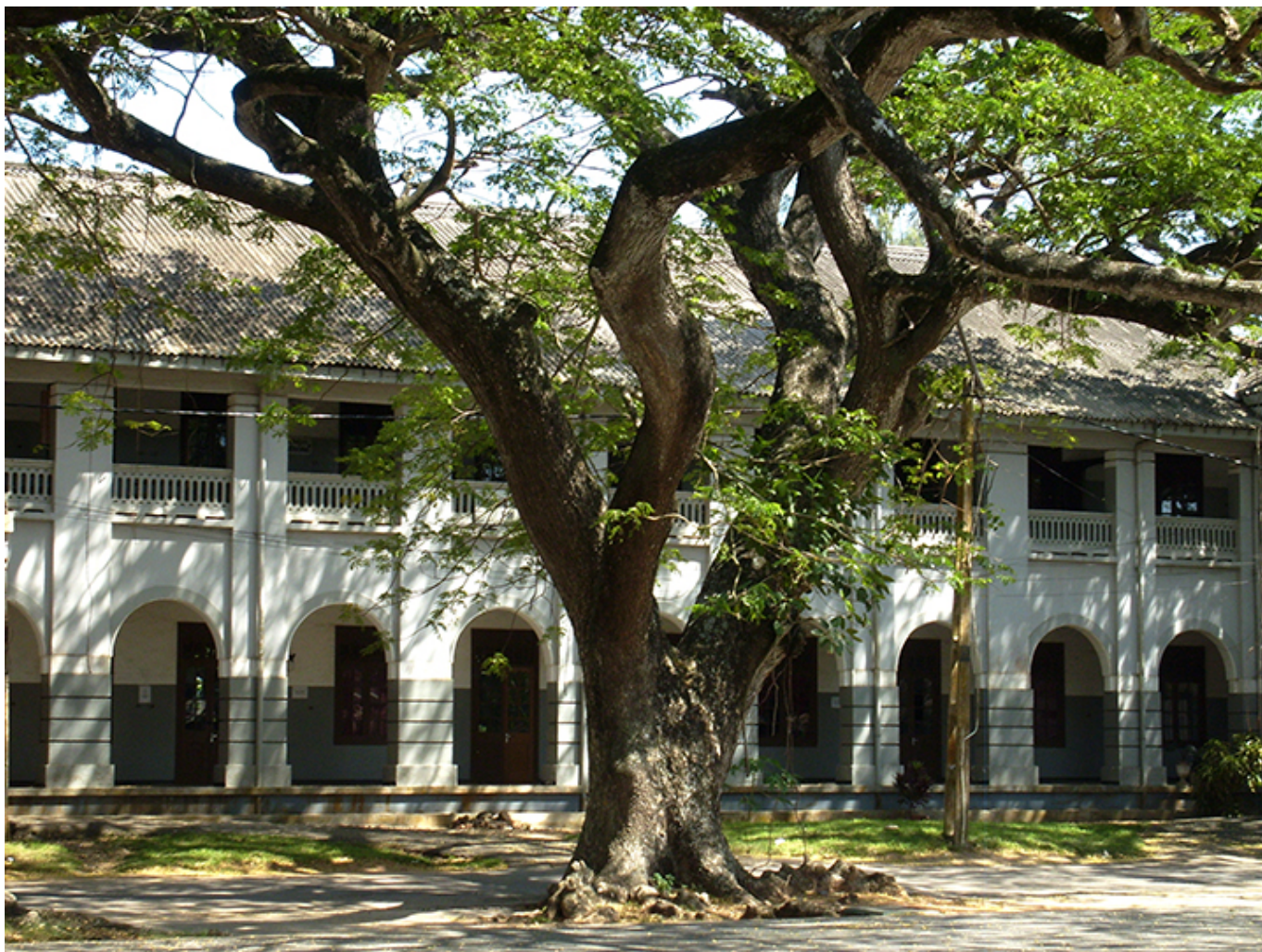
Galle. Główny plac w miasteczku.

rezydencji, a potem do meczetu. Ponownie przekonuję się, jak bardzo oryginalna to budowla także wewnątrz. Błyskawicznie dojeżdżam „tuk-tukiem” do autokaru.