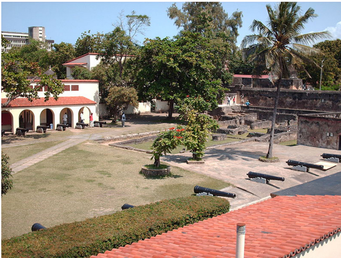
Fort Jezusa. Mombasa.

ciekawostka. Ładnie prezentują się zwieńczone kopułkami kaplice na skraju dziedzińca.