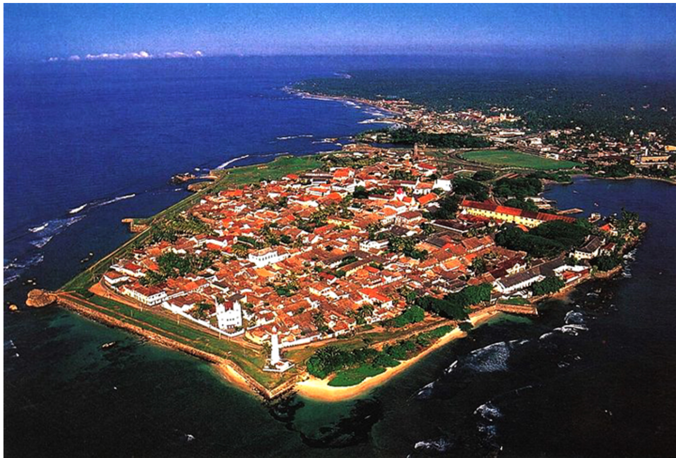
Galle. Widok ogólny.