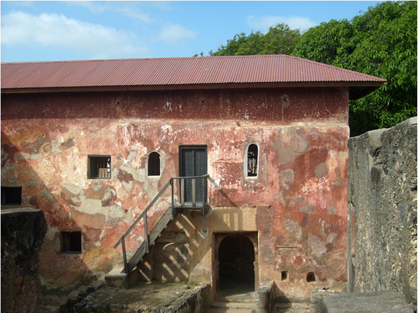
Zabudowania wewnętrzne portugalskiego foru Jezusa w Mombasie.