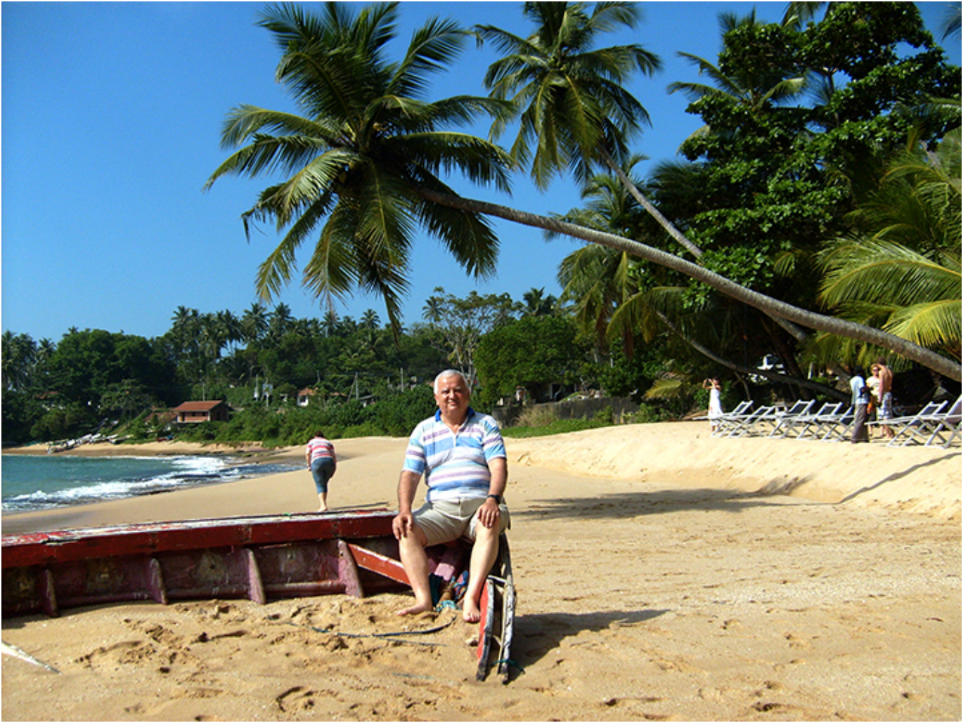
Sri Lanka. Plaża przed miasteczkiem Galle.