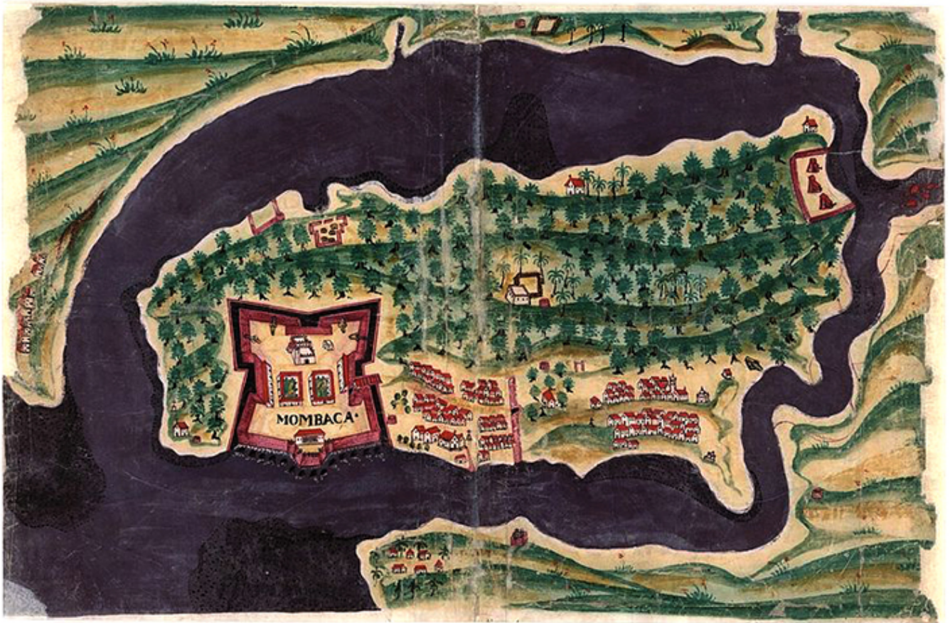
Forteca w Mombasie.