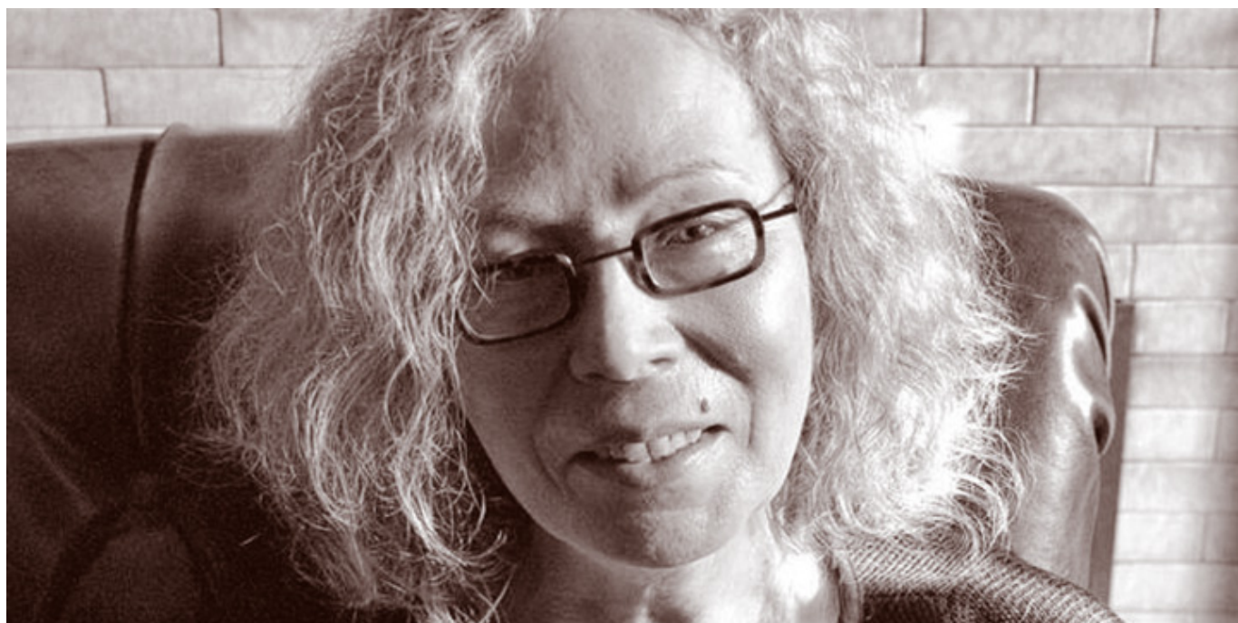
Ewa Stachniak