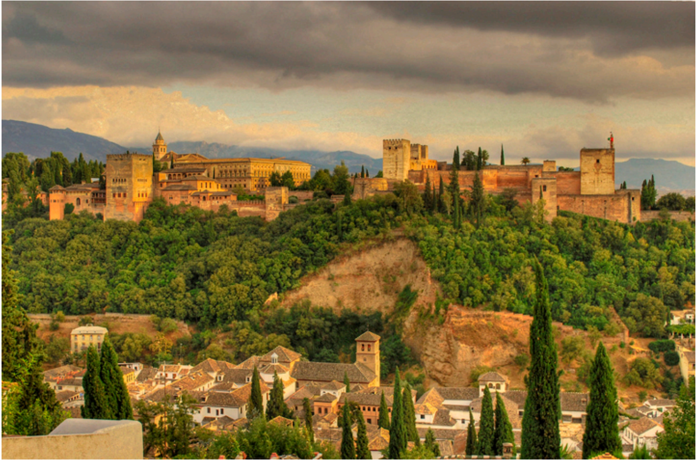
Grenada. Alhambra widziana z punktu widokowego św. Mikołaja.