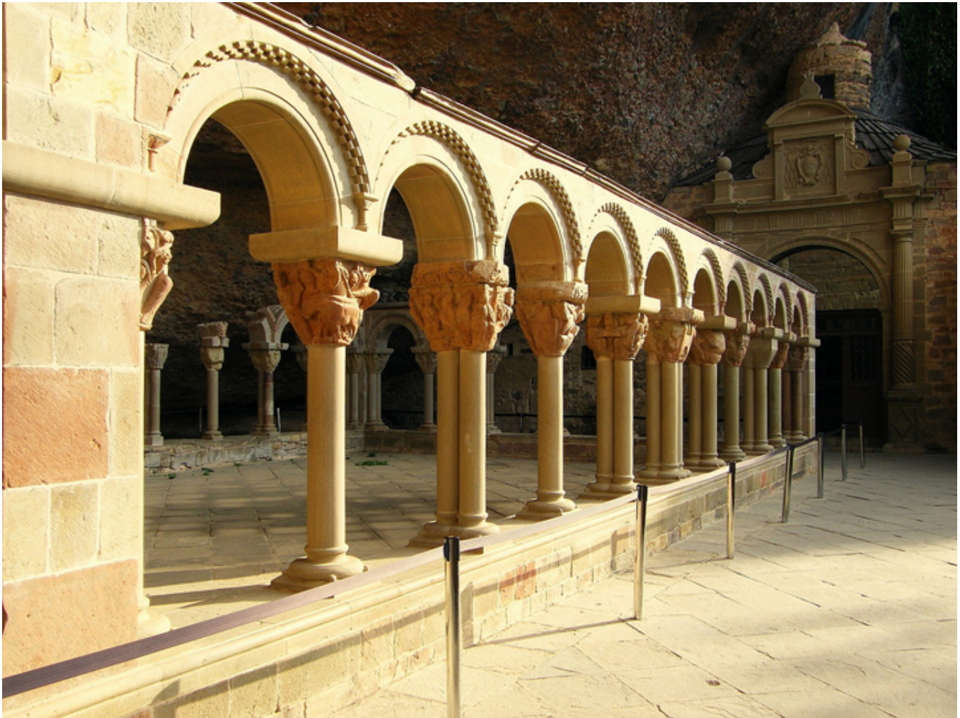
Klasztor św. Jana pod Skałą. Wirydarz.

Upał panował ogromny. Jeździłem wszędzie auto-stopem i któregoś dnia wybrałem się do cudownej doliny Ordesa , obrzeżonej wysoko nad lasem ogromnymi skałami, nieprawdopodobnie malowniczej. Wysoko znajduje się słynny Wyłom Rolanda ( Brecha de Rolando ), który, jak głosi legenda, po klęsce pod Roncevaux , rzucił tak mocno swoją szpadę o skałę, że utworzył się tam właśnie ten wyłom, 40 m szerokości i 100 m wysokości. Było już dosyć późno. Piąłem się wciąż uparcie pod górę. Żywego ducha! Wreszcie zrobiło się ciemno i jakąś dróżką dotarłem do miejsca, gdzie biwakowało dwóch młodych