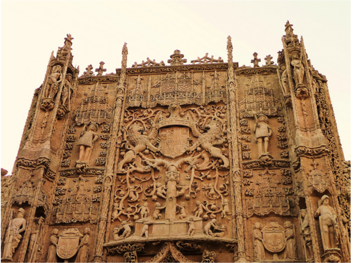
Valladolid. Kolegium św. Grzegorza i siedziba Muzeum Rzeźby.