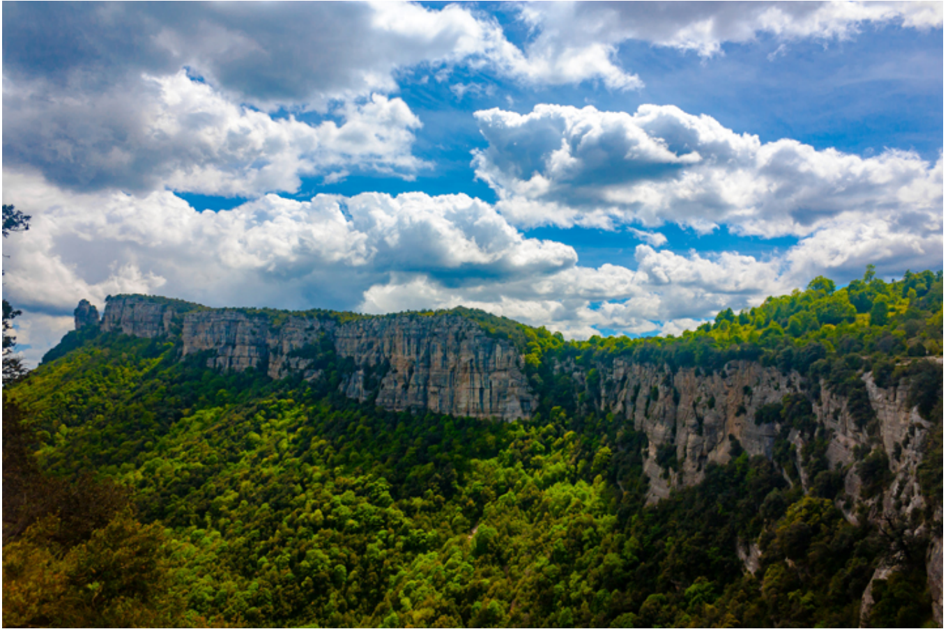
Rupit. Krajobraz okolicy miasteczka.