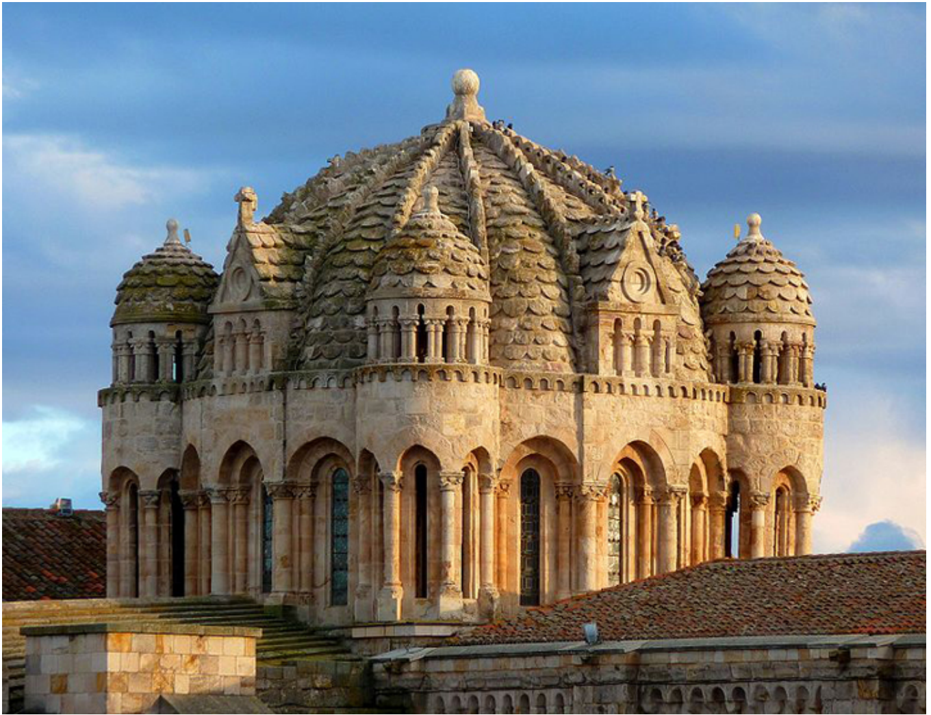
Zamora. Kopuła romańskiej katedry pokryta kamiennymi łuskami.