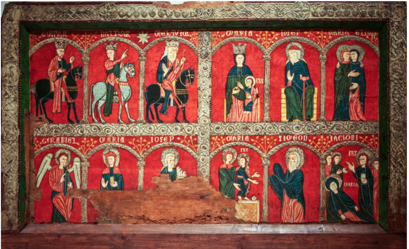
Antependium w Mosoll (Katalonia)