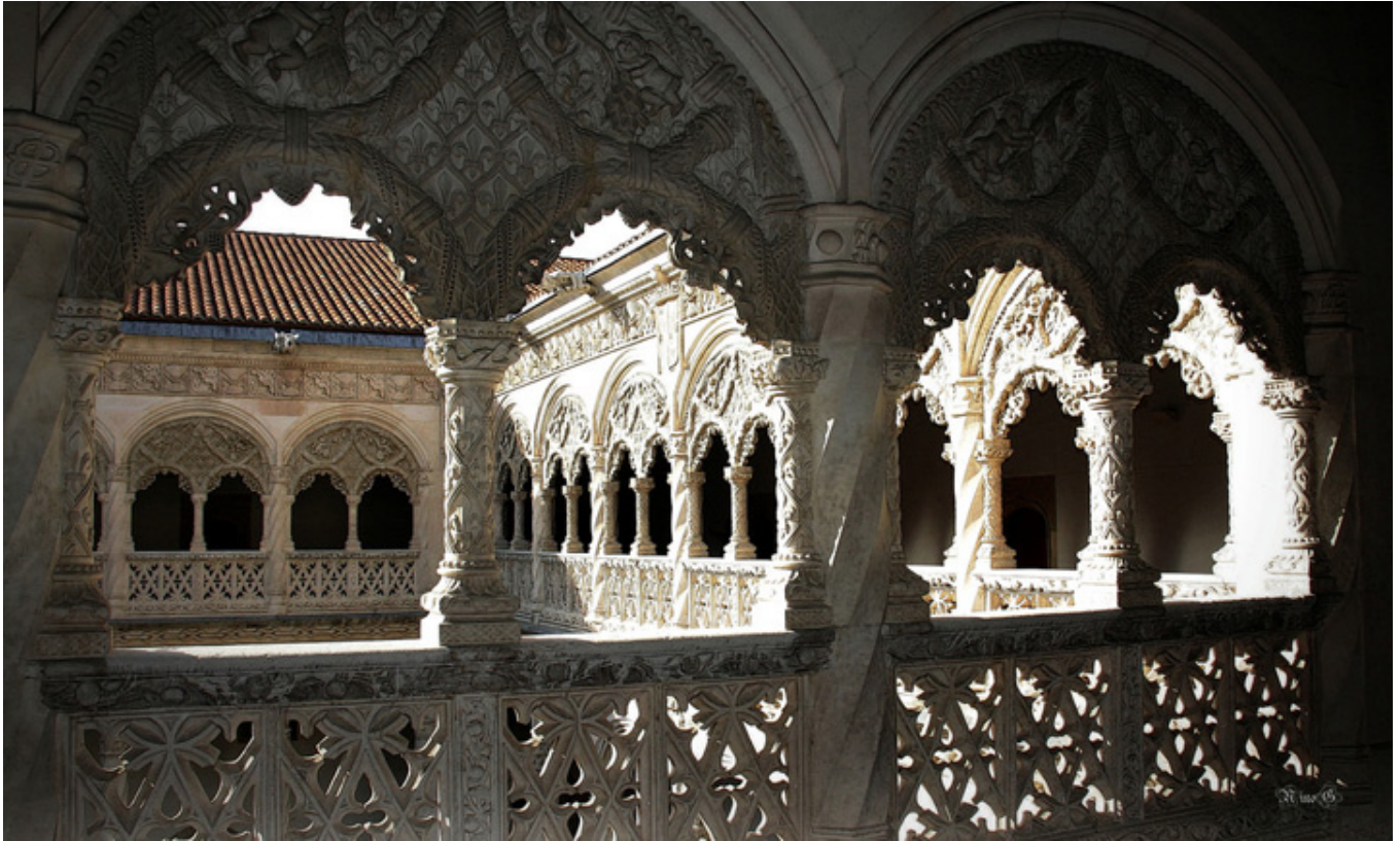
Valladolid. Dziedziniec Kolegium św. Grzegorza.