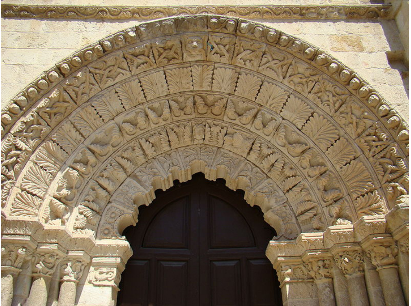
Zamora. Portal romański kościoła św. Magdaleny.

Niesłychanie ciekawym miastem, gdy idzie o sztukę romańską, jest położona na zachodzie Hiszpanii Zamora . W mieście i okolicy znajduje się największa ilość kościołów romańskich na terenie całego Półwyspu Iberyjskiego . Największa jest katedra z XII w., z ogromną kopułą pokrytą łuskami i otoczoną kolumnami o ciekawych głowicach. Kościół Świętego Klaudiusza z Ogrodu Oliwnego ( San Claudio de Olivares ) jest także z XII wieku i słynie z wyjątkowo pięknych i dobrze zachowanych głowic kolumn. Z kolei kościół Marii Magdaleny (XII-XIII w.) ma wspaniały romański portal