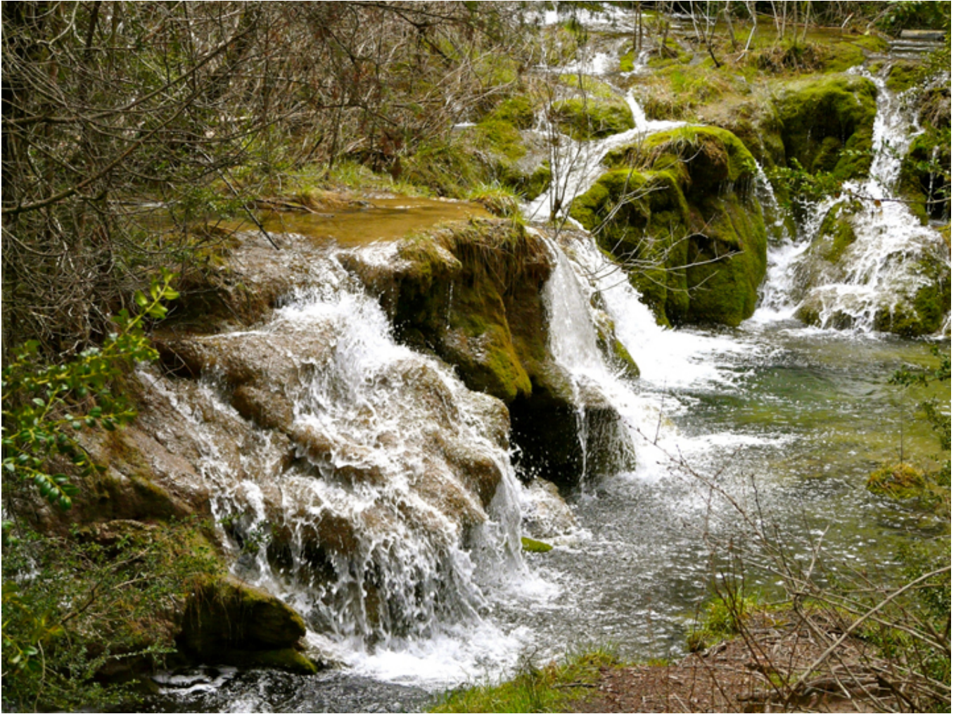
Źródła rzeki Cuervo (Cuenca),