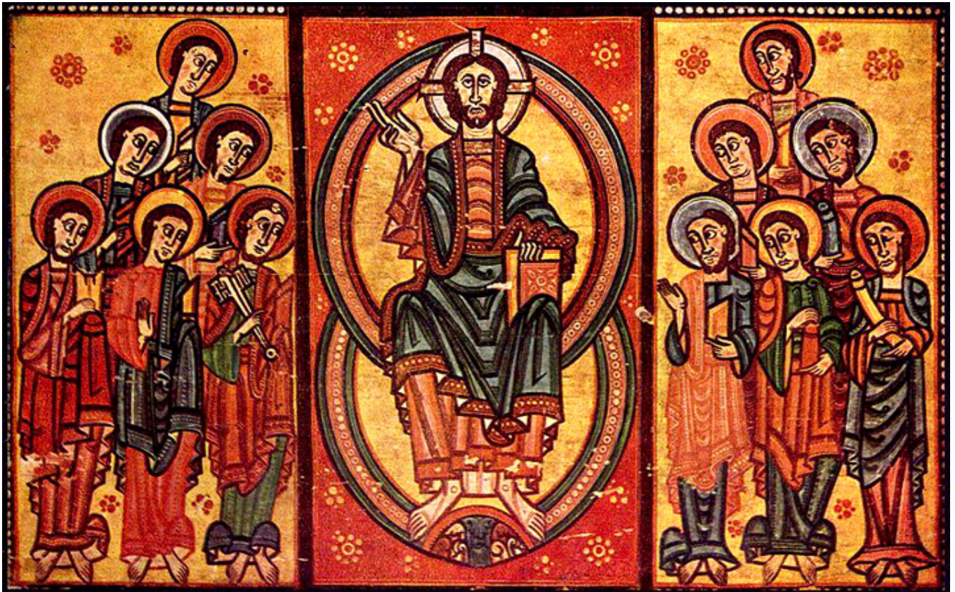
Antependium w katedrze w Urgell (Katalonia)