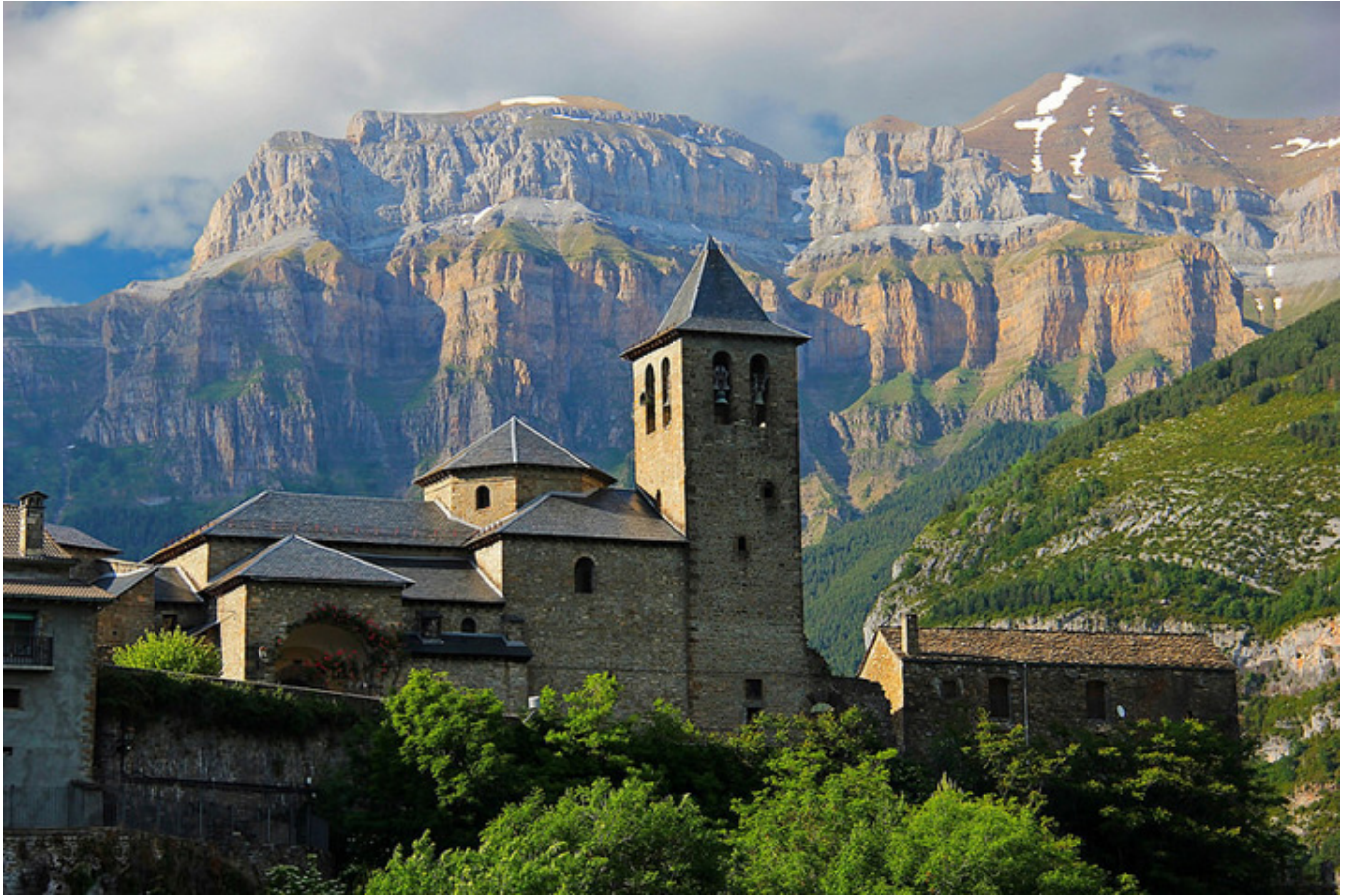
Torla. Pireneje aragońskie.