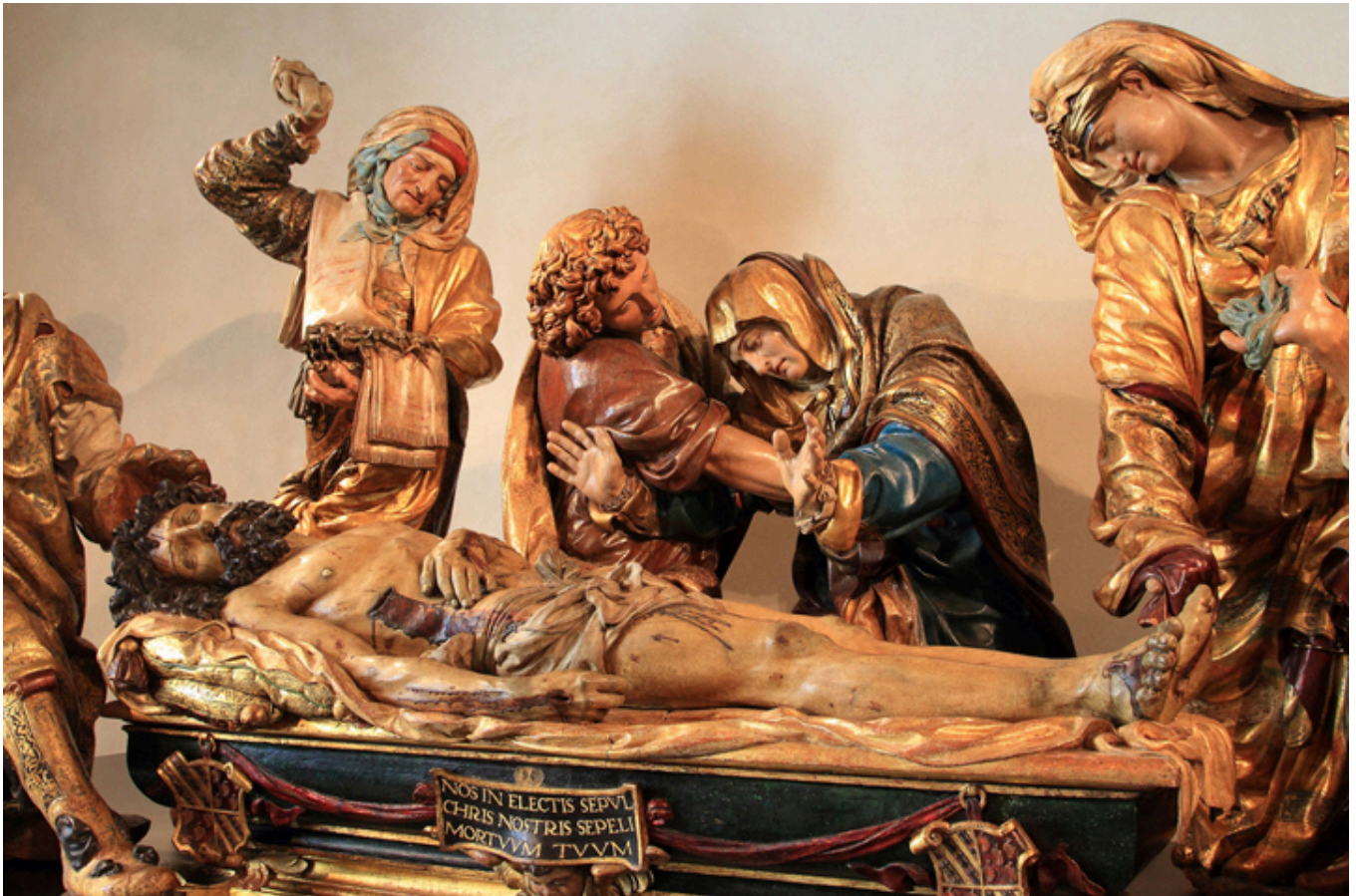
Valladolid. Juan de Juni - Pogrzeb Chrystusa.