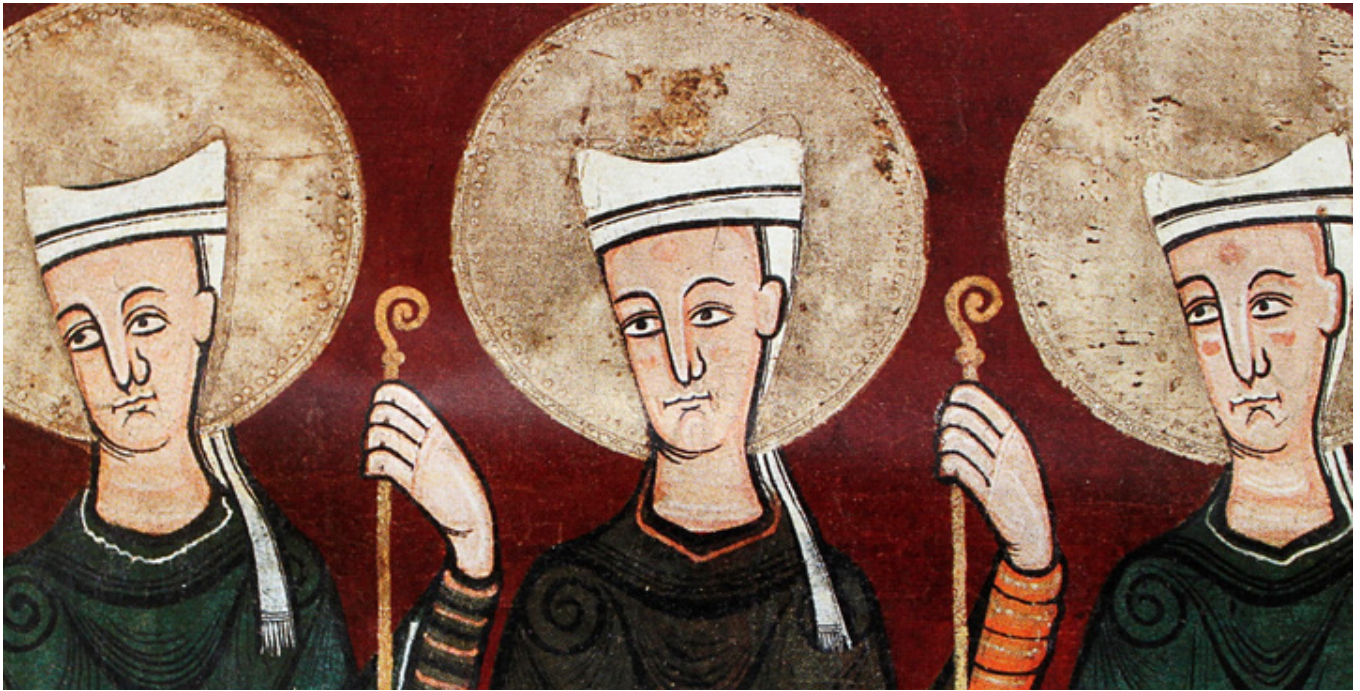
Tavèrnoles (Katalonia). Antependium.