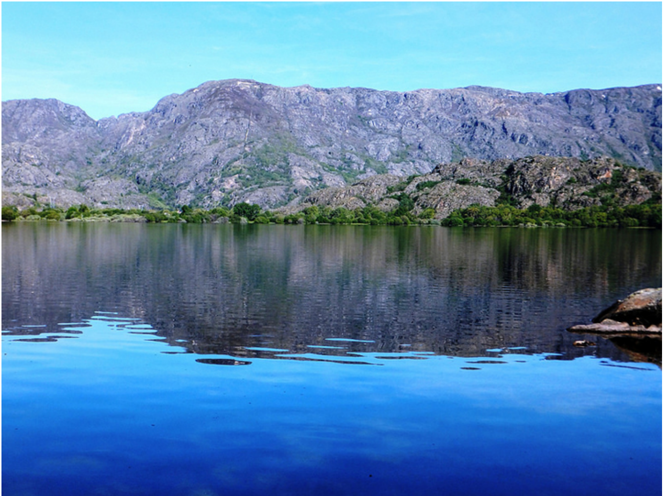
Jezioro Sanabria (Zamora)

Dziennik z podróży ukazuje się w drugi czwartek miesiąca