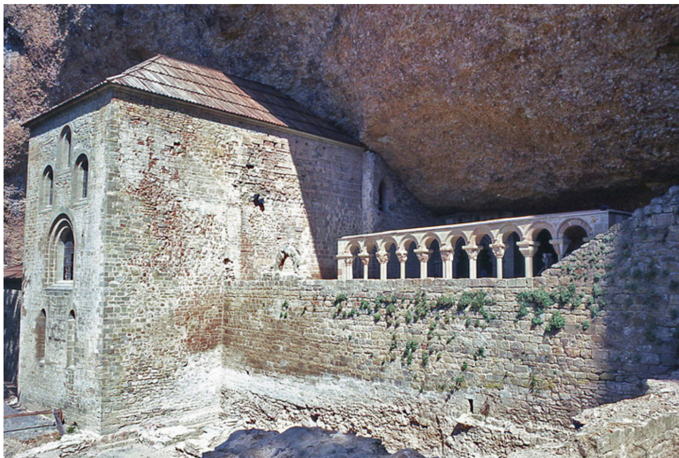
Klasztor św. Jana pod Skałą (Huesca).

basztami i fosą, z XVI w. Stosunkowo blisko, z jednej strony przytulony do skały romański klasztor Świętego Jana pod Skałą ( San Juan de la Peña ), XI-XII w. Robi wielkie wrażenie, zwłaszcza częściowo zachowany wirydarz z pięknymi kolumnami, pod wielką nagą skałą.