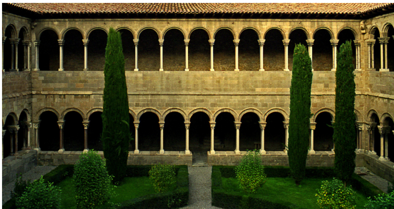
Ripoll. Wirydarz klasztoru Panny Marii.

Gdy chodzi o sztukę romańską absolutnym skarbem jest Ripoll i jego klasztor Matki Boskiej ( Santa María de Ripoll ), IX w. Portyk główny ozdobiony ogromną ilością rzeźb i płaskorzeźb romańskich ze scenami biblijnymi, niestety dość zniszczonych (mimo osłonięcia zewnętrzną galerią z łukami). Sam klasztor jest obszerny, posiada dwukondygnacyjny wirydarz z kolumnami o bogato zdobionych kapitelach.