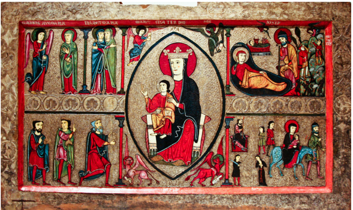
Cardet (Katalonia). Antependium.