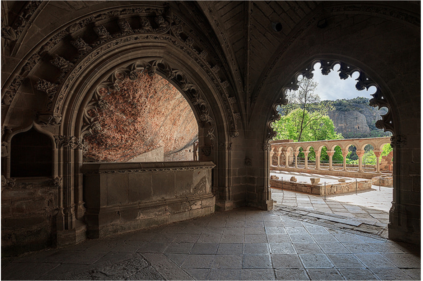
Klasztor św. Jana pod Skałą (Huesca).