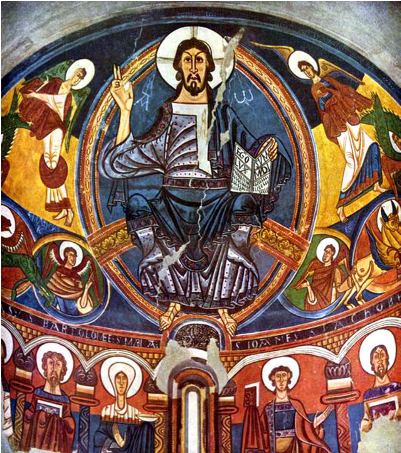
Pantokrator z kościoła św. Klementa w Taül (Katalonia).