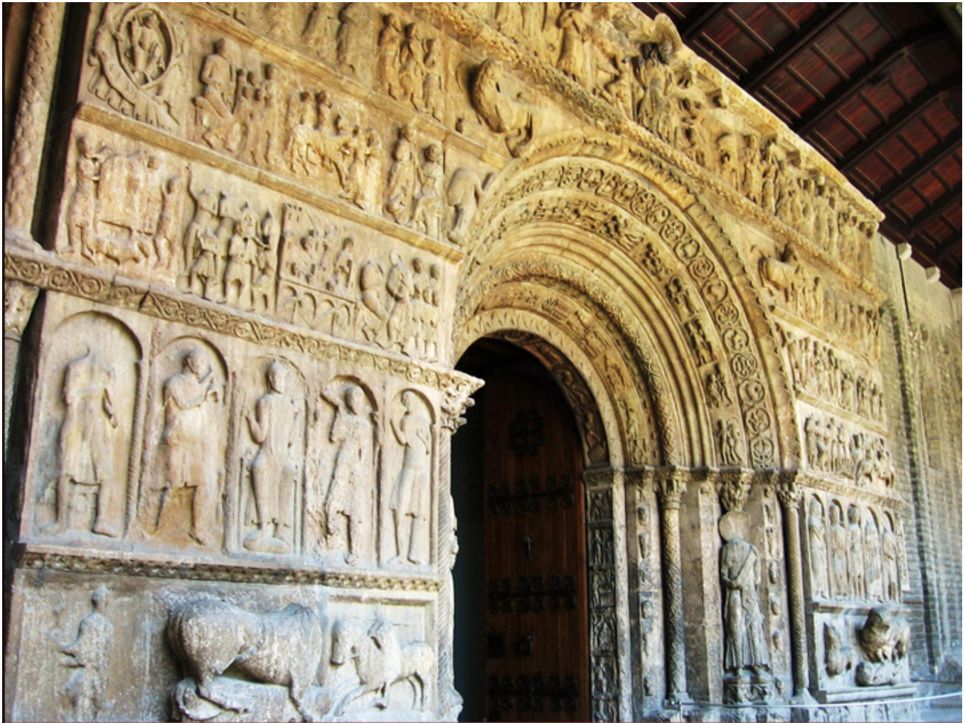
Ripoll. Portal romański.

W Camprodón , tuż przy granicy z Francją, krajobraz jest już wysokogórski. Miasteczko leży w dolinie u zbiegu rzek Ter i Ritort . Najwspanialszym jego elementem architektonicznym jest wspinający się i opadający most o wielkim łuku nad rzeką Ter (XII w.). Romański klasztor Św. Piotra pochodzi z X wieku.