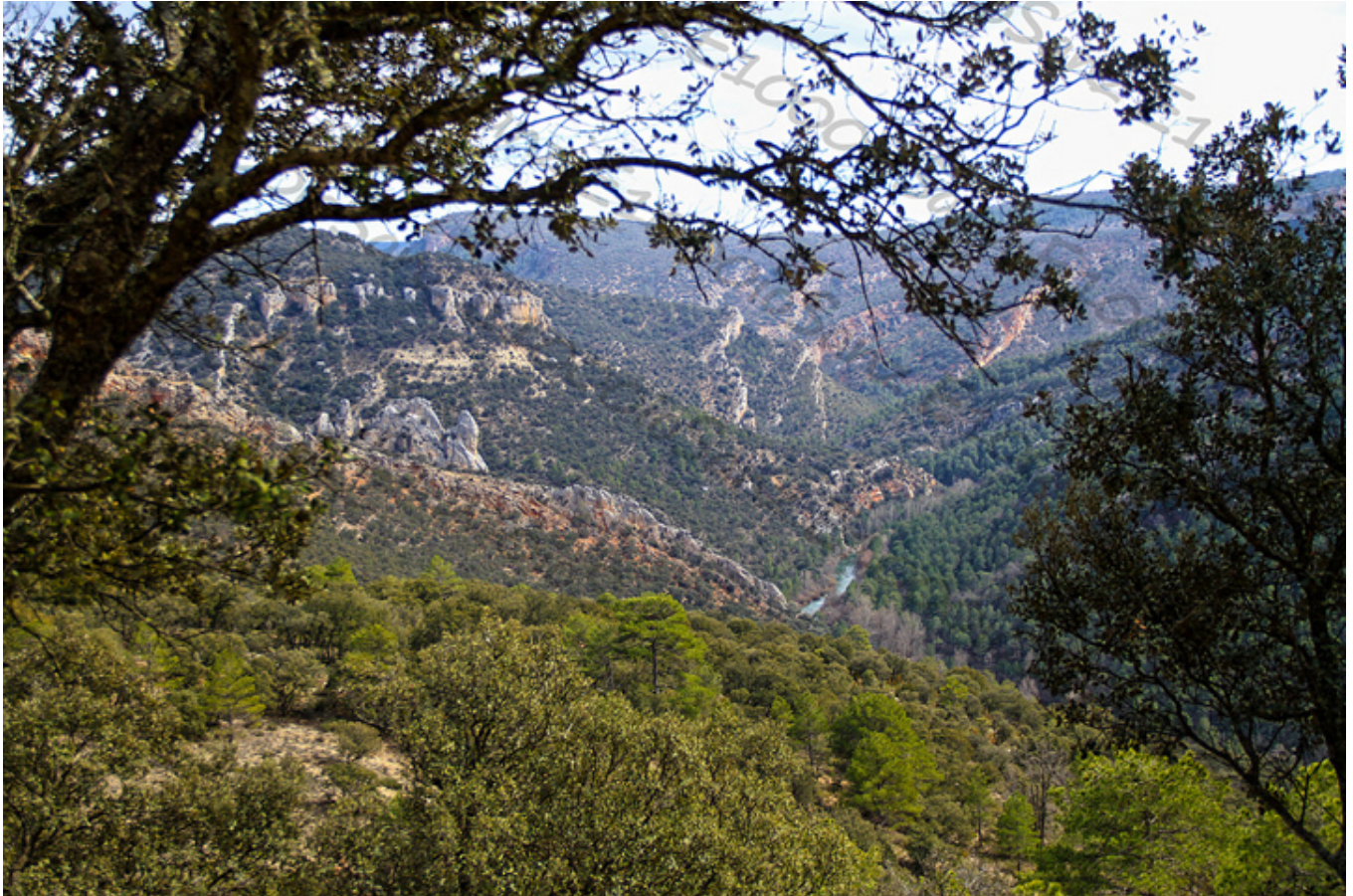
Park Naturalny Górnego Tagu.