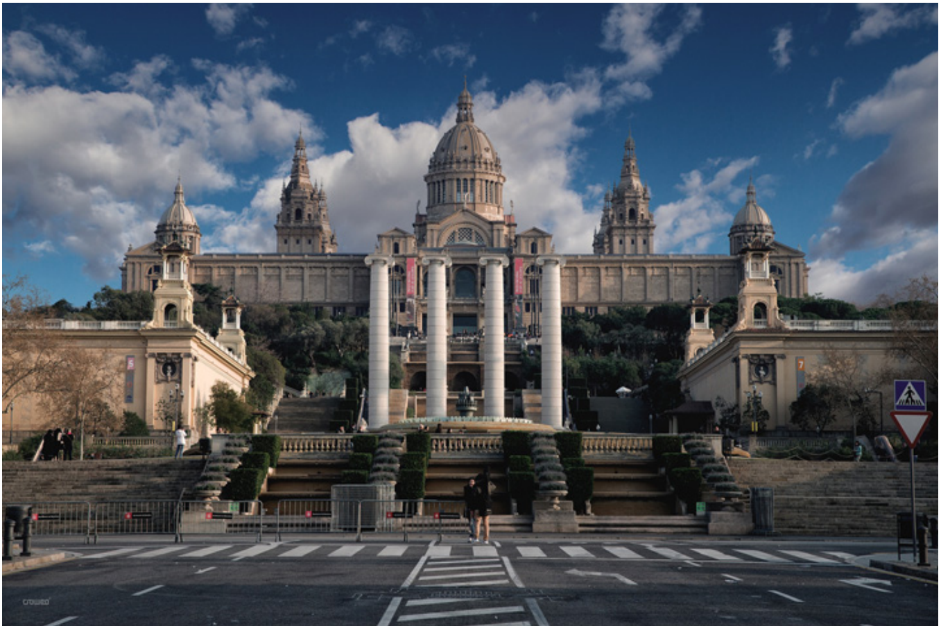
Barcelona. Muzeum Narodowe Sztuki Katalońskiej.

W roku 2001 miałem okazję zwiedzić w Pałacu Narodowym w Barcelonie dział sztuki romańskiej Państwowego Muzeum Sztuki. Skarby nadzwyczajne!