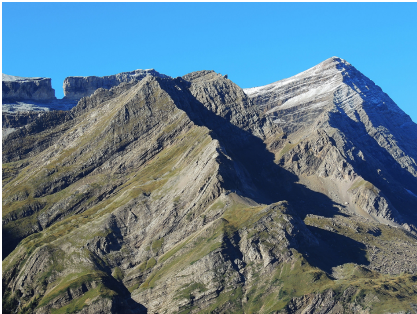
Wyłom Rolanda po lewej i szczyt Taillon po prawej (Pireneje).

turystów. Siedzieli przy ognisku obok namiotu. Okazali się bardzo gościnni i przygarnęli mnie na noc. Rano wróciłem do miasta Jaca . Wracałem przez stolicę prowincji, Hueskę , miasto położone na południe od Jaki . Tam, gotycka katedra z pięknym portalem, XIII w.