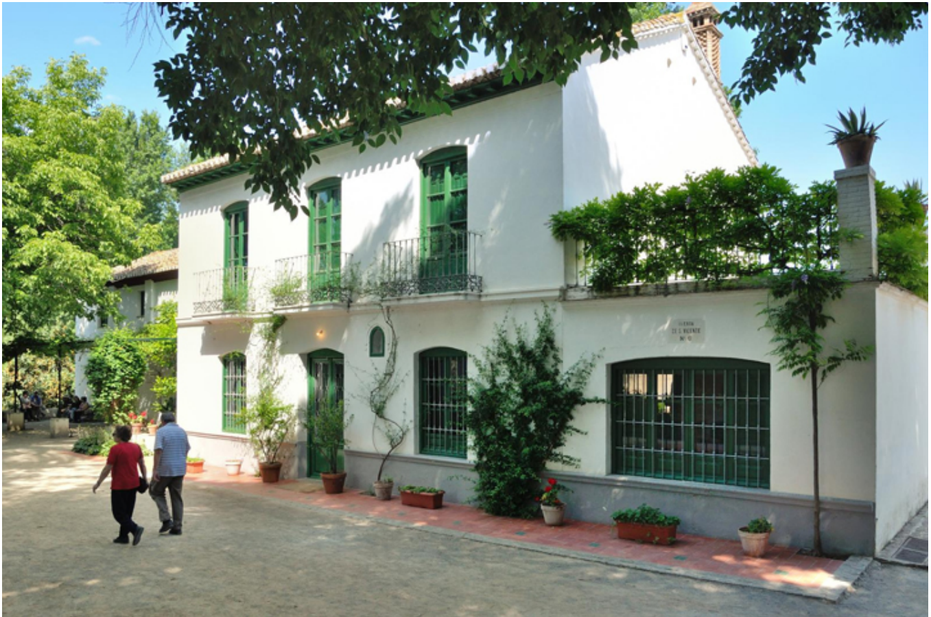
Grenada. Huerta de San Vicente. Dom Muzeum Federica Garcíi Lorki.

W 1995 r. miałem okazję znaleźć się w dobrze mi znanej Grenadzie . Tym razem przyjrzałem się labiryntowi „arabskich” uliczek, tak podobnych do marokańskich i tunezyjskich. Nowym obiektem było dla mnie muzeum Federica Garcíi Lorki, otwarte stosunkowo niedawno w dzielnicy zwanej Huerta de San Vicente (Ogród Świętego Wincentego). Mały, biały jednopiętrowy domek w ogrodzie. Uroczy, z pamiątkami po poecie. Poszedłem jeszcze na punkt widokowy Świętego Mikołaja ( Mirador de San Nicolás ) w dzielnicy Albaicín , naprzeciwko Alhambry . Cudowny widok na Alhambrę i w tle góry Sierra Nevada . Miałem okazję przekonać się raz jeszcze jak pięknym miejscem jest Grenada .