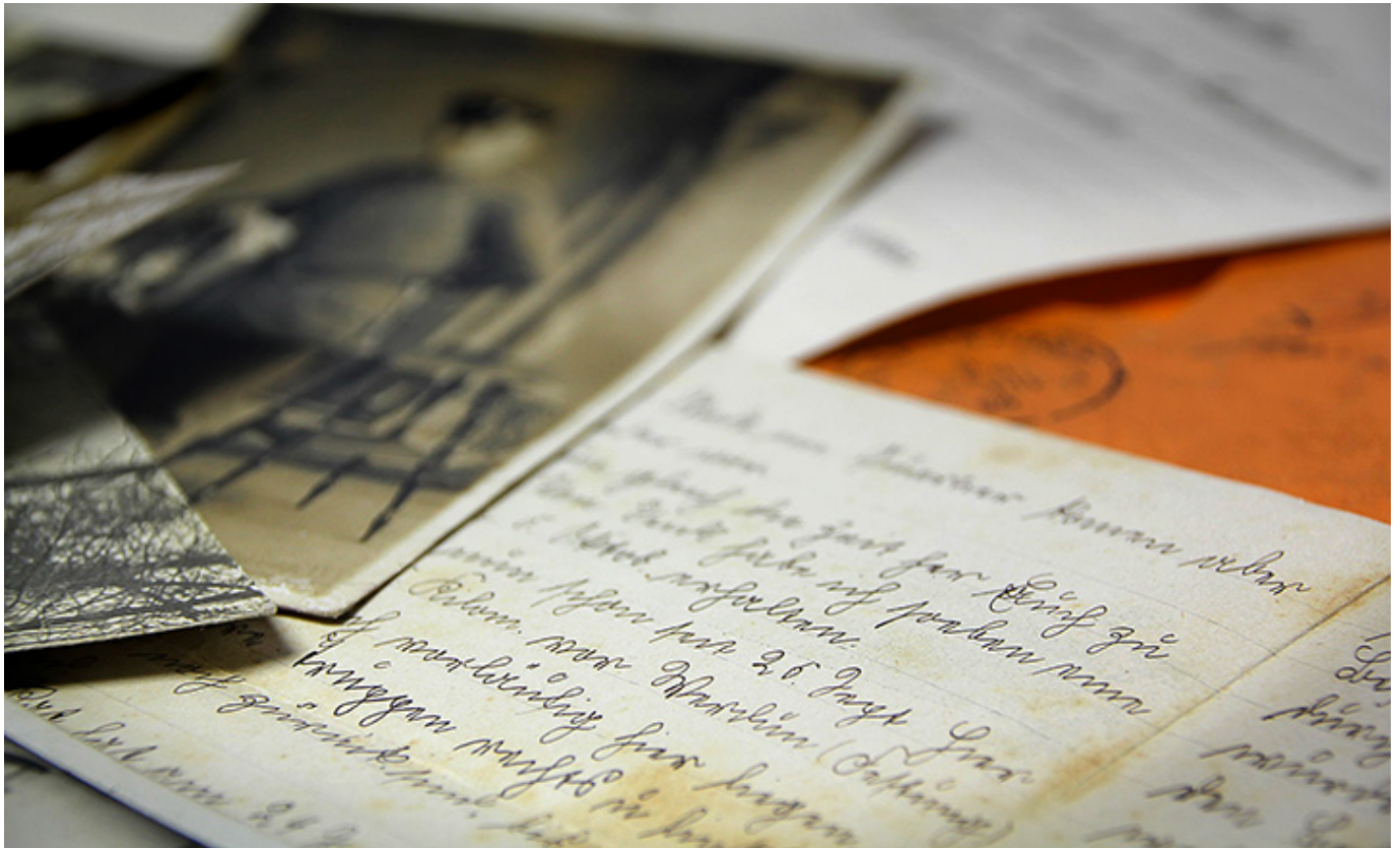
Poczta polowa