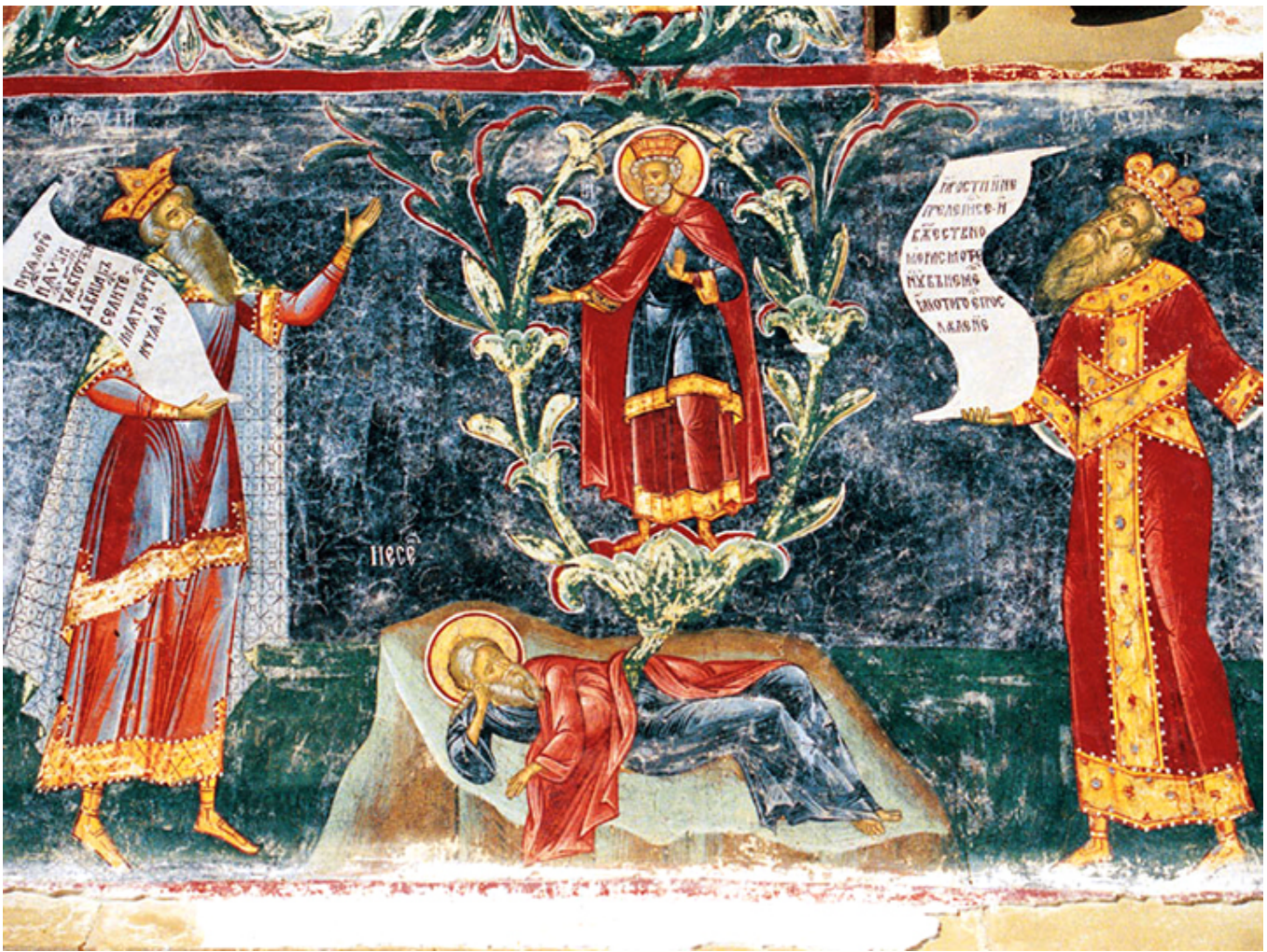
Sucevița, Prorocy - malowidło ścienne

Ostatni mój pobyt w Rumunii to kuracja błotna w sanatorium w Mangalii , w Dobrudży w roku 2001. O ile zabiegi w gorącym błocie pochodzącym z przybrzeżnego jeziora Techirghiol i w podgrzewanej wodzie morskiej okazały się skuteczne na moje przypadłości reumatyczne, o tyle obserwacja życia w Rumunii w owym czasie i to zarówno w Dobrudży , jak i w Bukareszcie , nie wypadła najlepiej. Rumunia nie była jeszcze w Unii Europejskiej i wydała mi się krajem pogrążonym w biedzie i bardzo zaniedbanym w zestawieniu z Polską. Jedynym pozytywnym akcentem była podróż pociągiem z Mangalii do Bukaresztu w