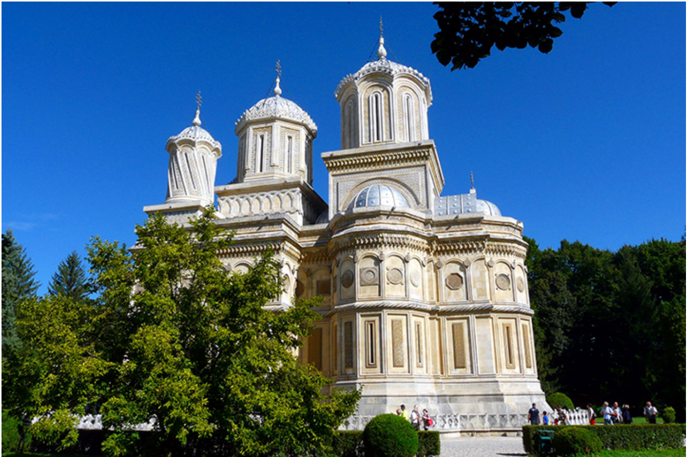
Cerkiew Metropolitalna w Curtea de Argeș