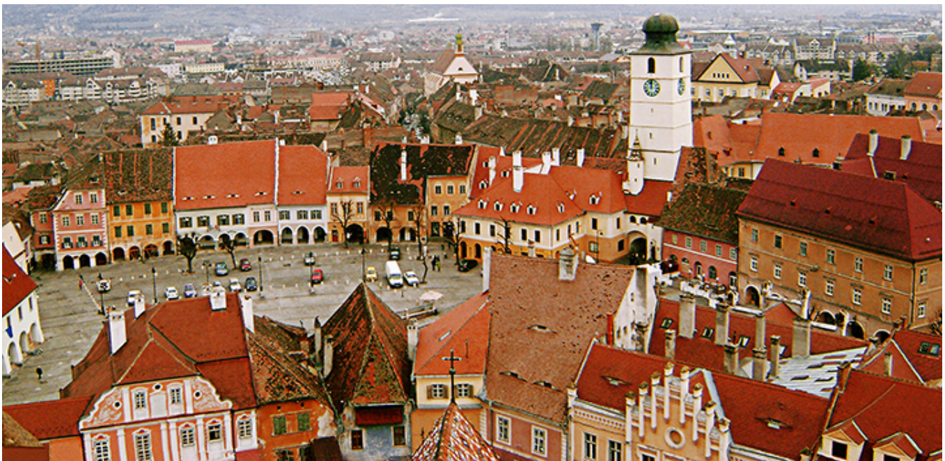
Mały Rynek w Sybinie