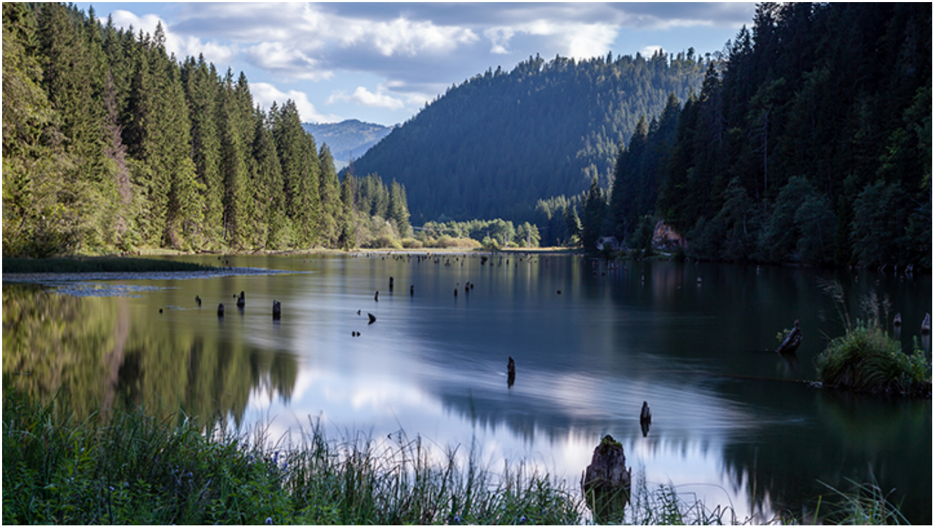
Jezioro Czerwone w Karpatach Wschodnich