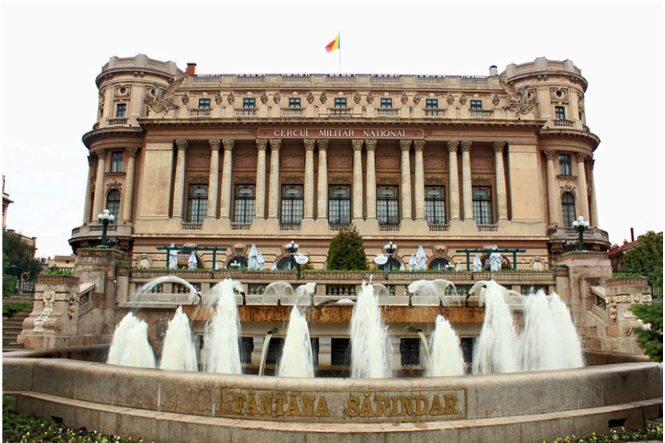
Narodowy Klub Wojskowy w Bukareszcie