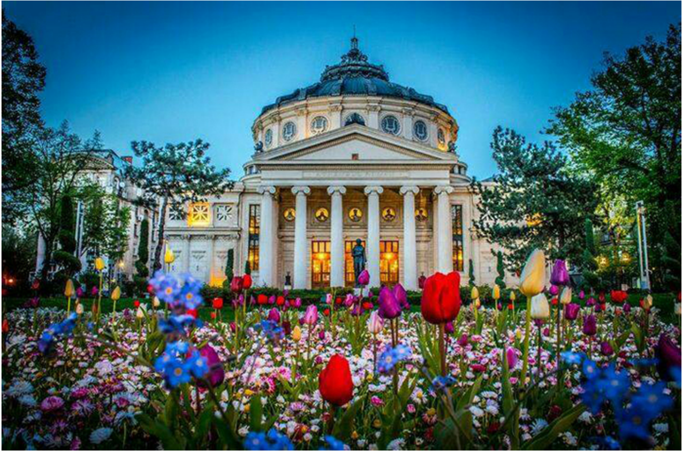
Ateneum Rumuńskie w Bukareszcie