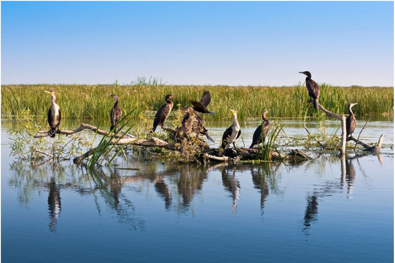
Kormorany w Delcie Dunaju