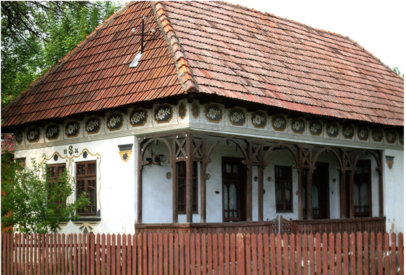
Dom wiejski w Zachodniej Wołoszczyźnie