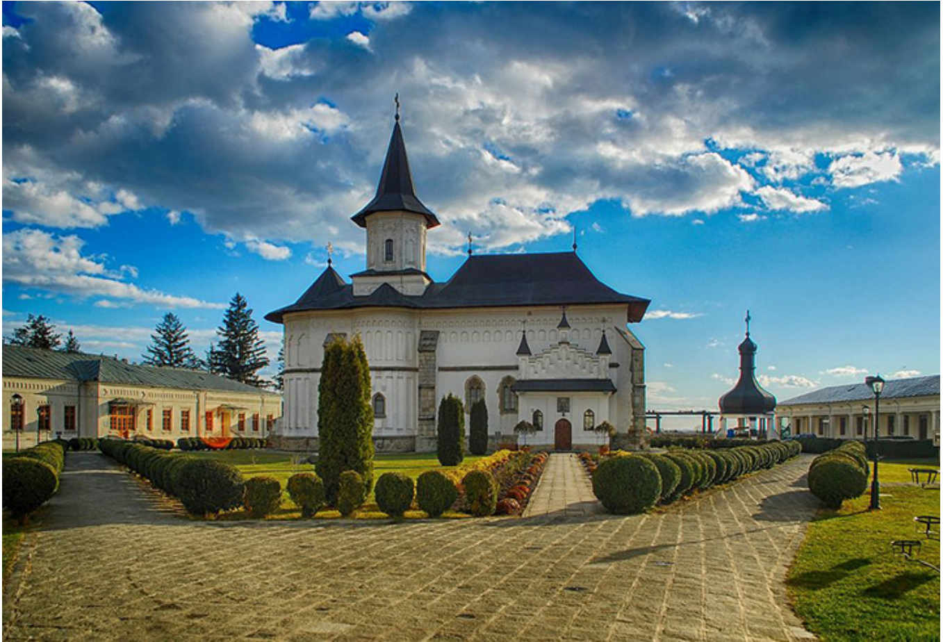
Katedra w mieście Roman (rumuńska Mołdawia)