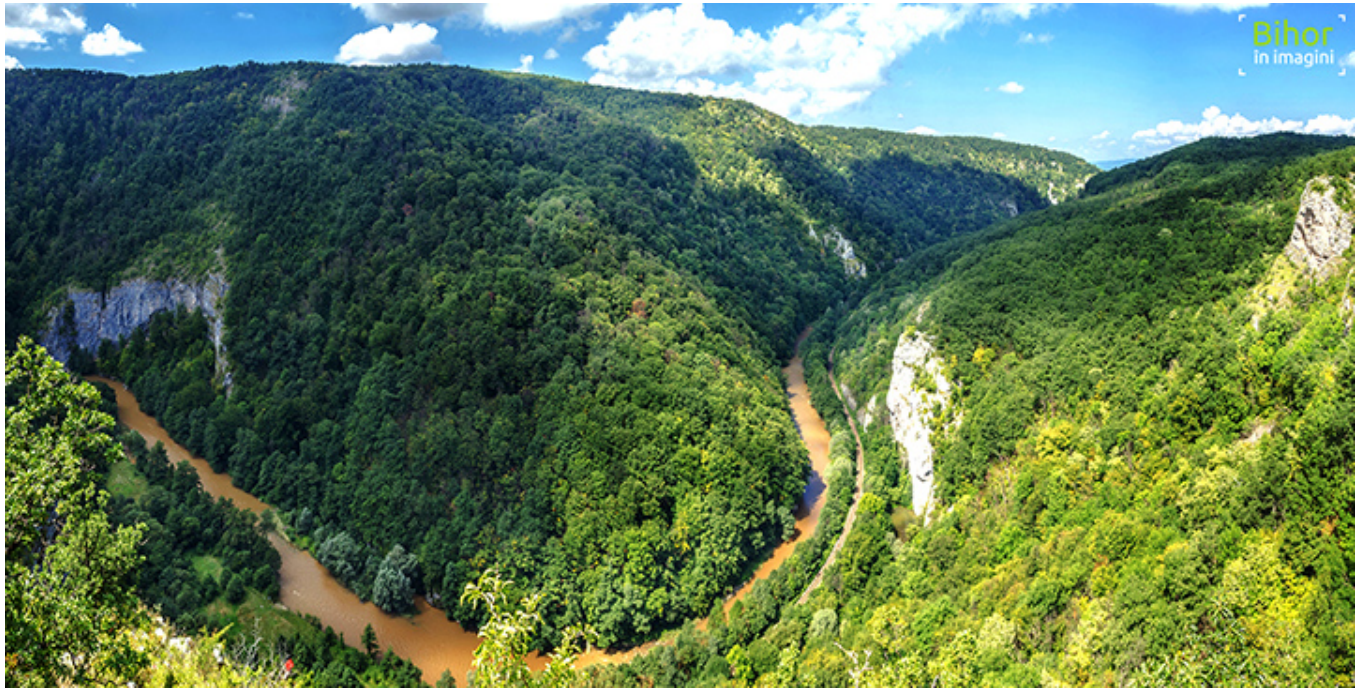
Przełom Złotego Szybkiego Potoku