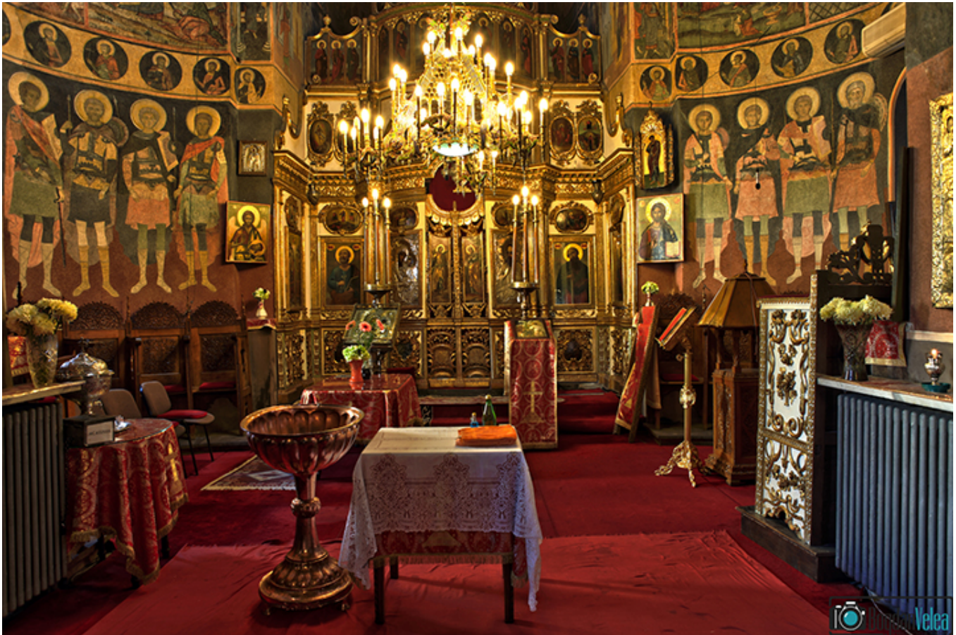
Wnętrze cerkwi Crețulescu w Bukareszcie