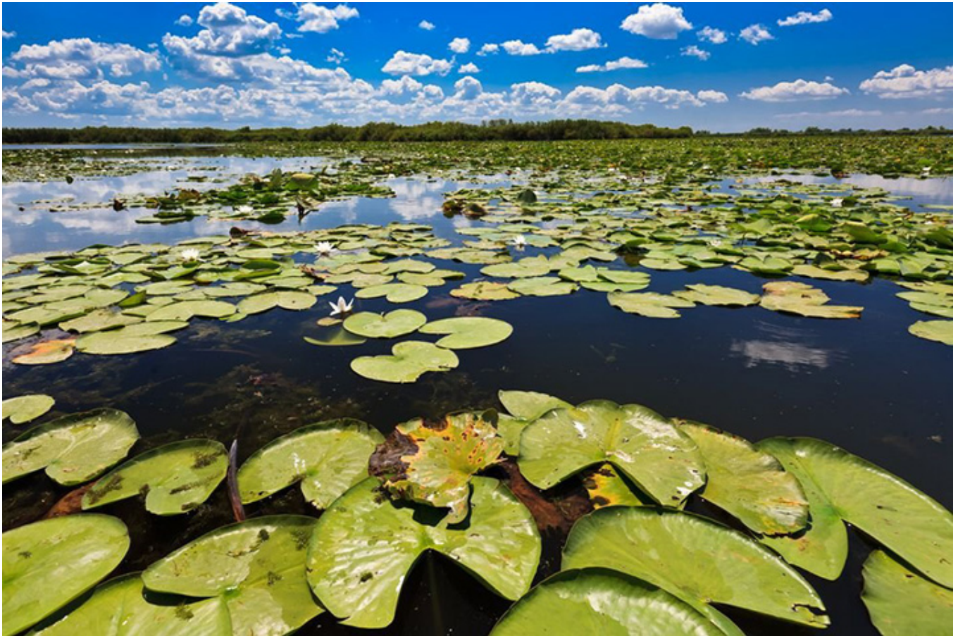
Jezioro na Delcie Dunaju