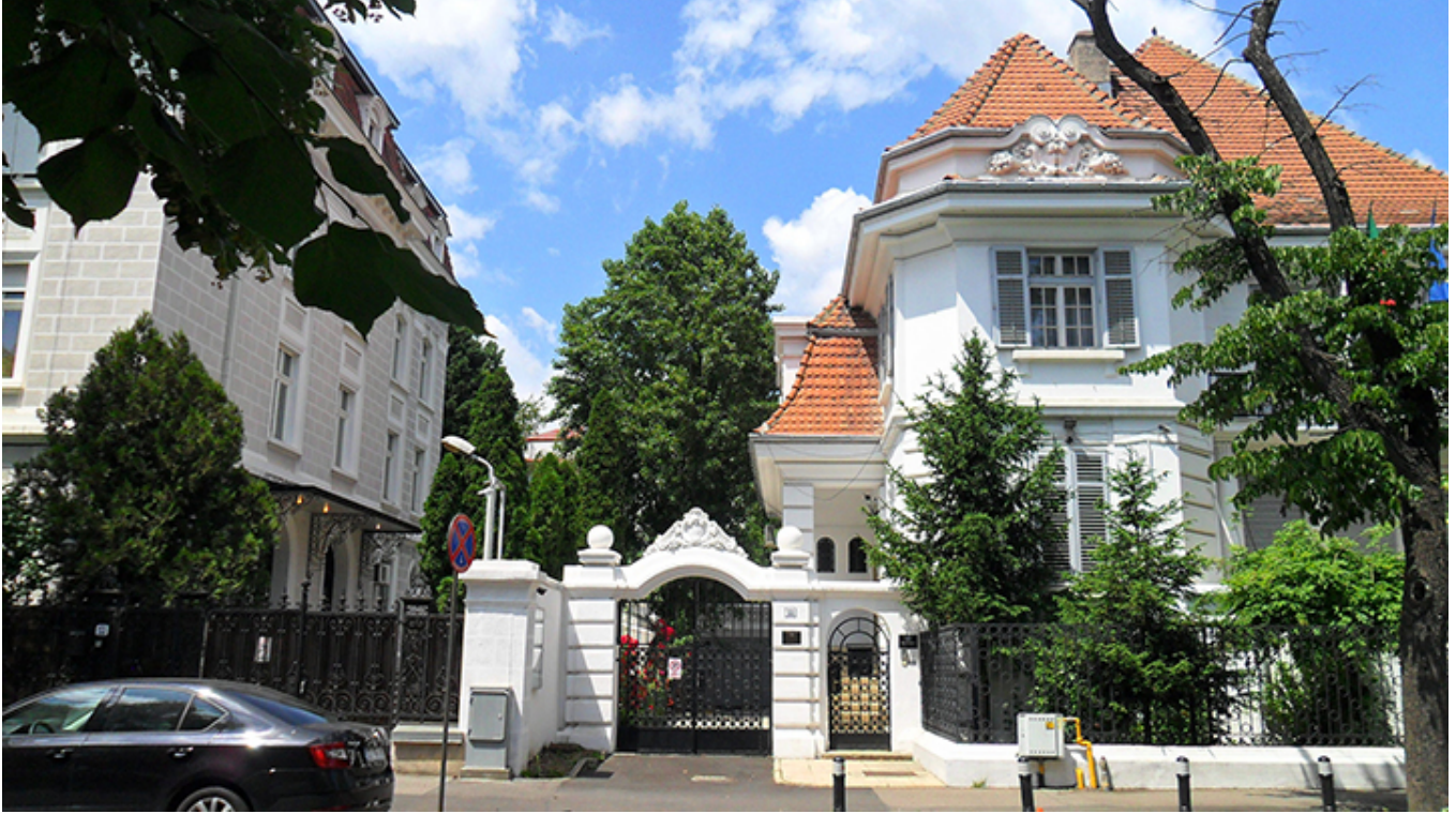
Architektura willowa w Bukareszcie