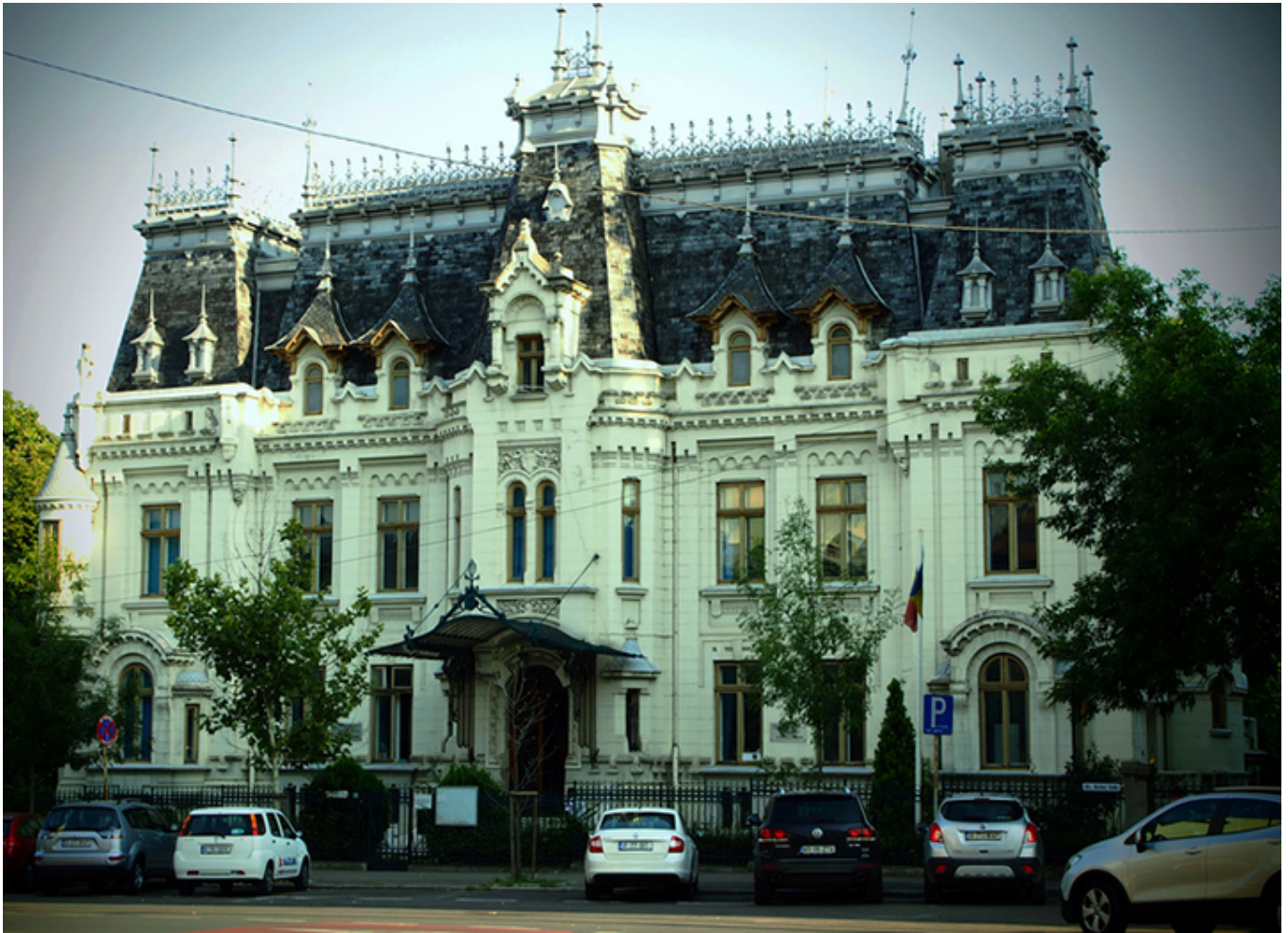
Pałac Cretulescu w Bukareszcie