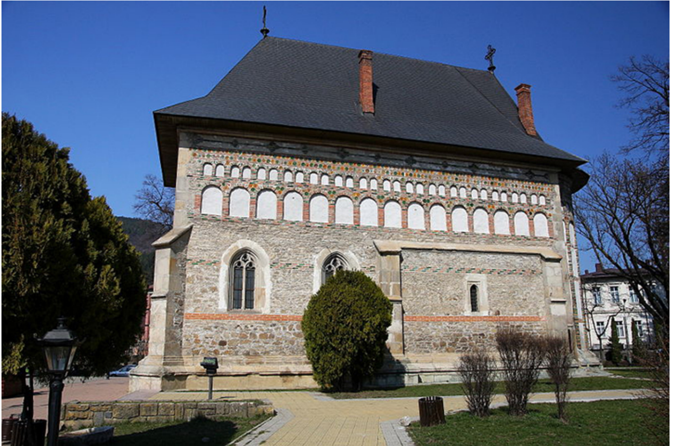
Cerkiew św. Jana w Piatra Neamț