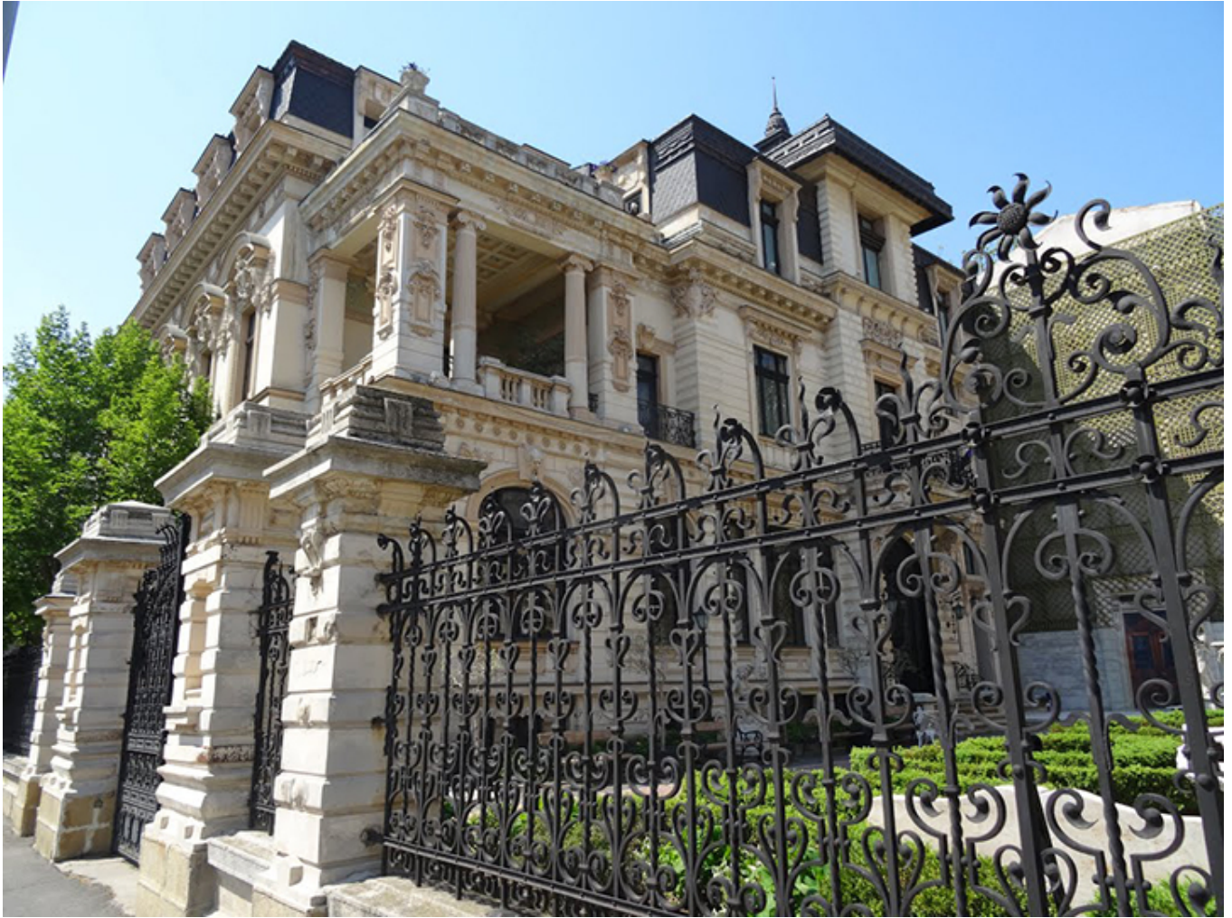
Pałac Grădișteanu w Bukareszcie