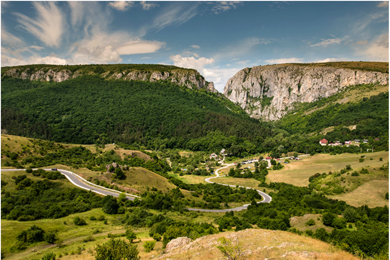
Przełom rzeki Turdy

Podczas kolejnej podróży do Rumunii , w roku 1969, obserwowałem niezwykle malowniczą dolinę rzeki Crișul Repede (Złoty Szybki Potok) wijącej się na dnie głębokiego jaru. Wsiadłem w mieście Kluż , gdzie napotkana młoda para węgierska, słysząc moje kłopoty w posługiwaniu się językiem rumuńskim natychmiast przeszła na węgierski, nie spodziewając się, że efekt będzie znacznie gorszy. Stamtąd dostałem się do przełomu rzeki Turdy . Przeszedłem cały ten szlak nocując w schronisku, gdzie zaprzyjaźniłem się z młodą parą węgiersko-rumuńską. Po przyjeździe do Bukaresztu wybrałem się do leżącej w karpackiej dolinie Sinai , znanej także z baśniowego Pałacu Peleş, wzniesionego z woli rumuńskiego króla Karola I.