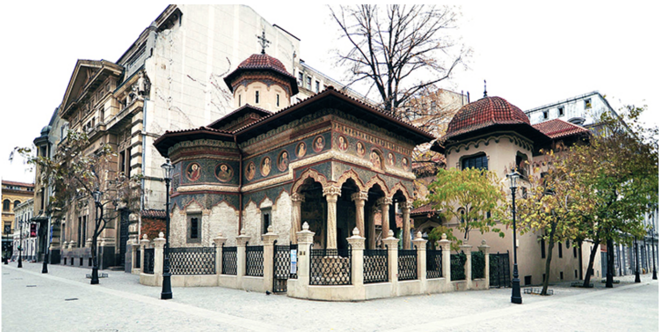
Monastyr Stavropoleos w Bukareszcie.