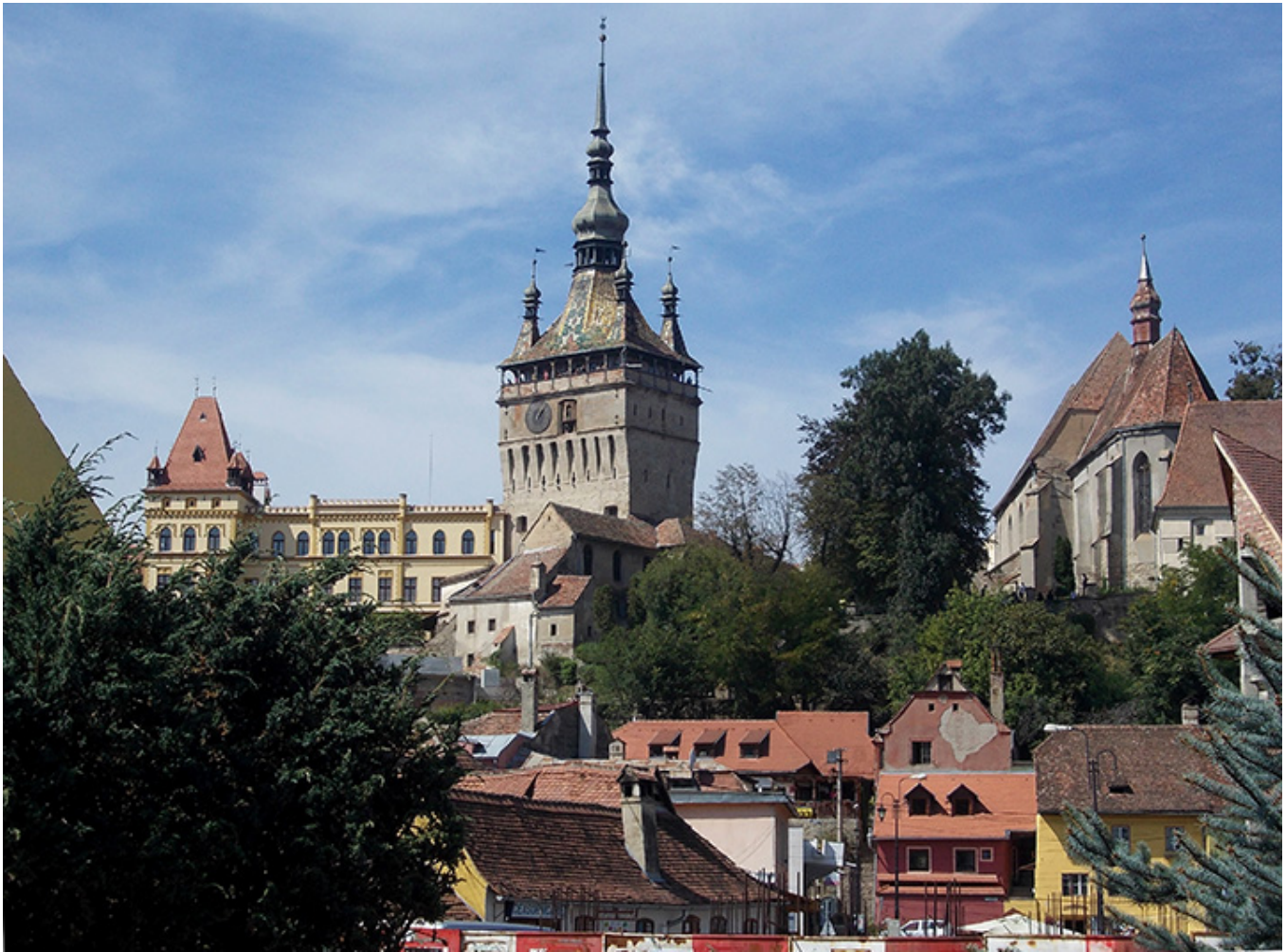
Sighișoara. Wpisana na listę Światowego Dziedzictwa Ludzkości

Po jednej nocy spędzonej w domku na obrzeżach Konstancy udałem się do Mamai , gdzie zamieszkałem na kempingu w dwuosobowym namiocie, który dzieliłem z bardzo sympatycznym Czechem. Czechów i Słowaków na tym kempingu było mnóstwo i czuli się tam znakomicie, bo Rumunia była jedynym demoludem, który nie brał udziału w napaści na Czechosłowację rok wcześniej. Po kilku dniach spędzonych na wybrzeżu dotarłem do miasta Tulcea leżącego przy samej Delcie Dunaju i tam wsiadłem na statek wycieczkowy, którym zwiedziłem ogromny obszar Deltę płynąc wśród morza wysp i wysepek i podziwiając