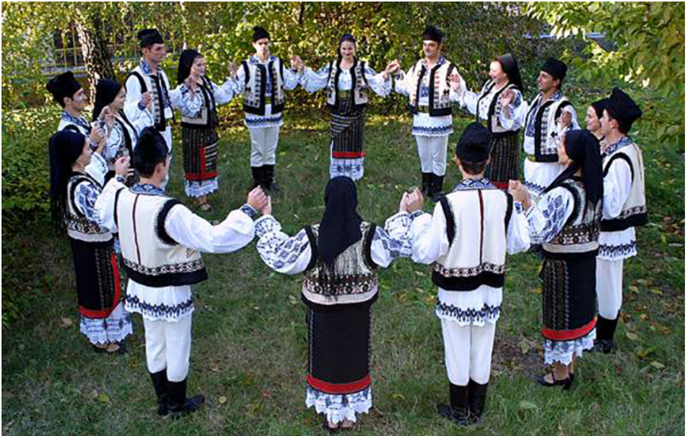
Hora z Mołdawii

młodego i jego podkreślanie, jak ważne w życiu są książki. Wołał: „Cărți, cărți!” Pod koniec wesela wszyscy goście wyszli przed dom na ulicę i zatańczyli w wielkim kręgu słynną rumuńską horę.