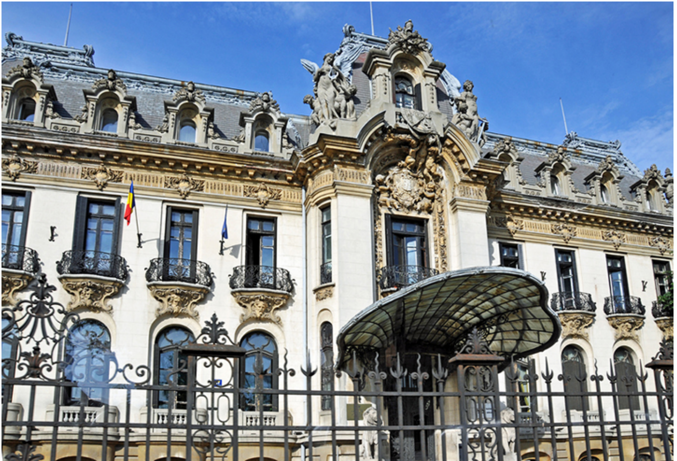
Pałac Cantacuzino w Bukareszcie