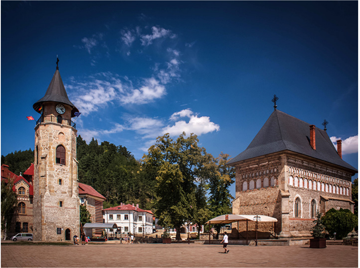
Dziedziniec Bojarów w Piatra Neamț (Mołdawia).