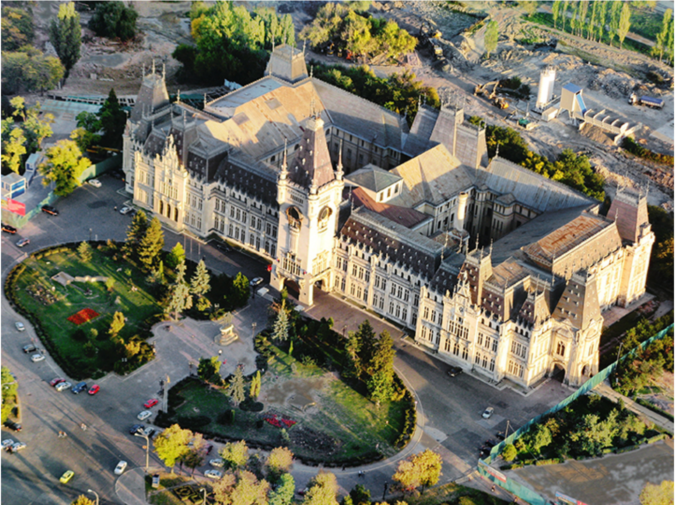
Pałac Kultury w Jassach

Wreszcie deser: najpiękniejsza zdecydowanie część Rumunii pod względem artystycznym, ale także krajobrazowym, mianowicie południowa Bukowina . W pięknie pofalowanym, zielonym pejzażu, poprzecinanym górskimi potokami, leżą cudowne prawosławne monasterium z doskonale zachowanymi freskami na ścianach zewnętrznych. Najbardziej znany jest Voroneț , ale także Gura Humorului , Moldovița i Sucevița . Przepiękne malowidła pochodzą z XIV, XV i XVI wieku i nadal doskonale się prezentują. Stanowią znakomitą ilustrację scen biblijnych i ewangelicznych dla prostego wiejskiego ludu. Stolicą