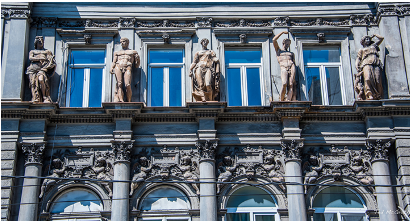
Ministerstwo Gospodarki Morskiej w Bukareszcie