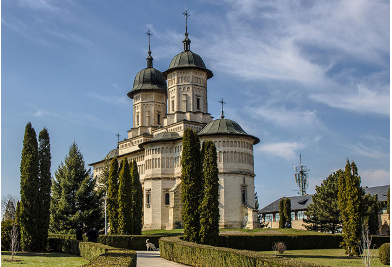
Monastyr Forteca w Jassach