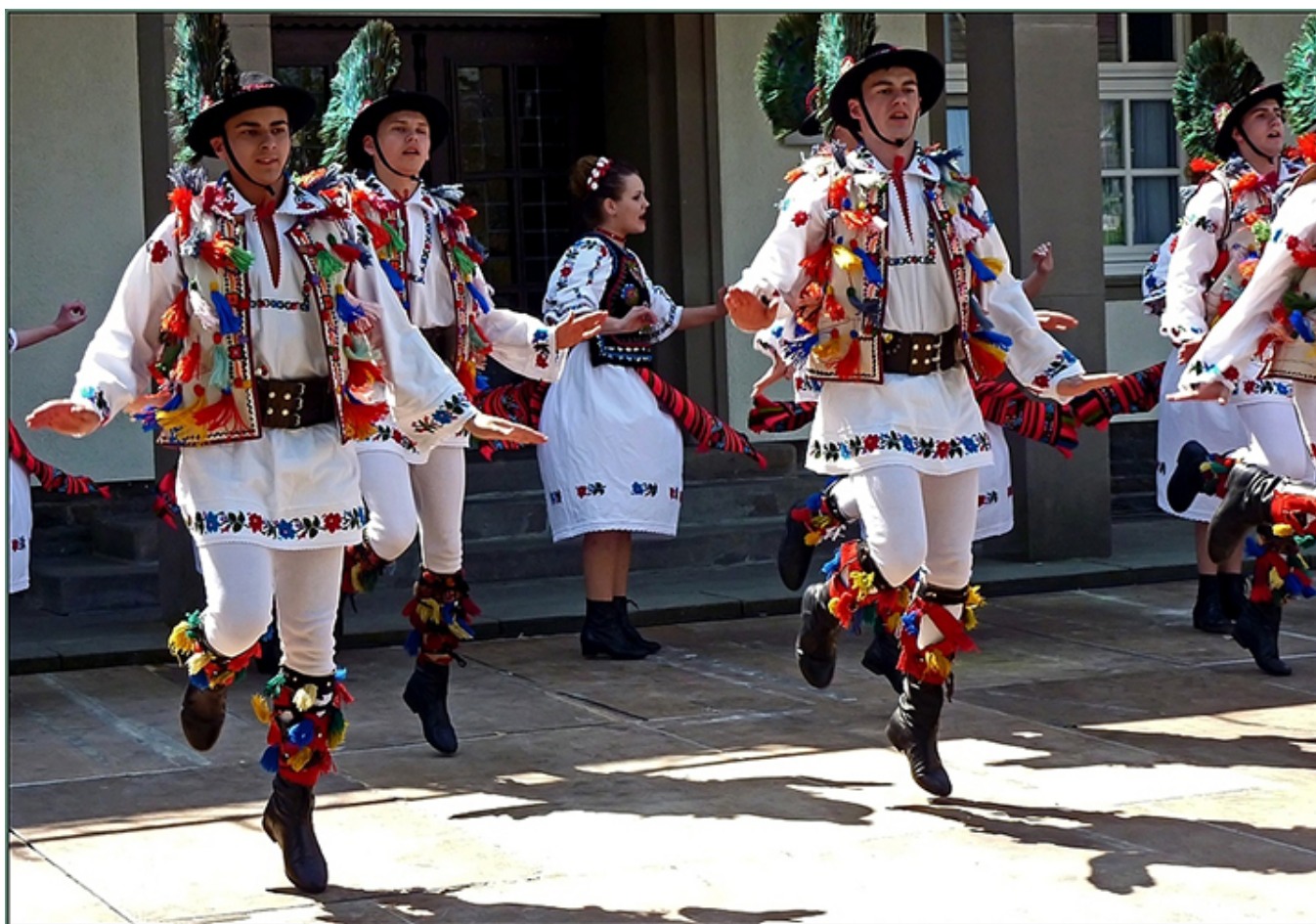
Tanec z regionu Marmarosz