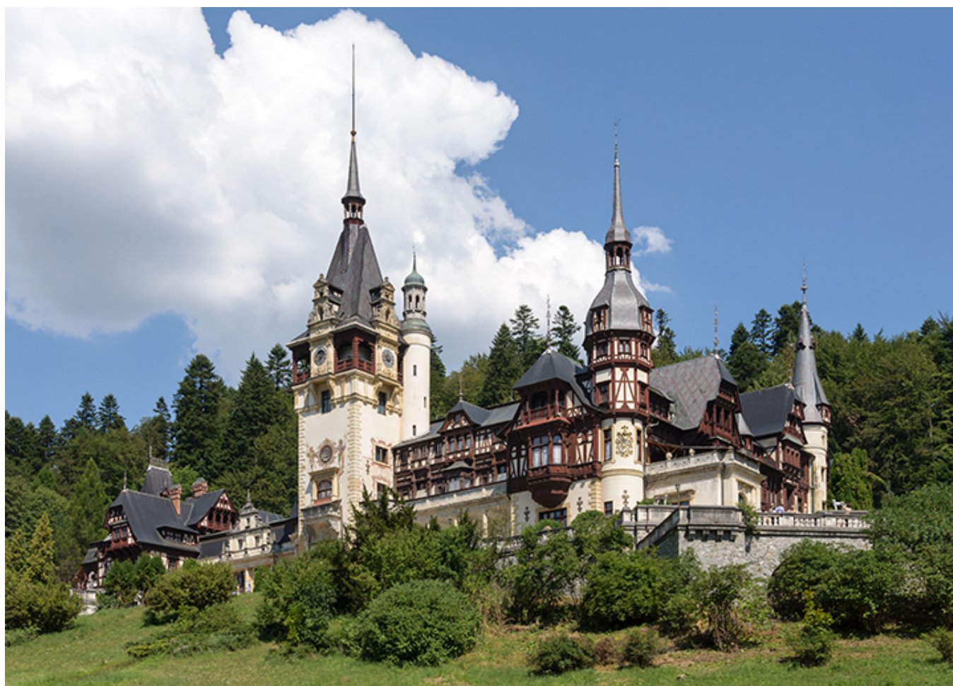
Zamek Peleş w Sinaia

Była to rezydencja królów rumuńskich w XIX i XX wieku. Latem w tym ogromnym pałacu odbywały się w latach 60. kursy języka i kultury rumuńskiej dla cudzoziemców. Gdy tam zajrzałem, uczestnicy kursu z zapałem śpiewali doinę, liryczną pieśń rumuńską, zwaną niegdyś w Polsce „dumką wołoską”. Doina jest uznanym przez UNESCO niematerialnym dziedzictwem kulturalnym ludzkości.