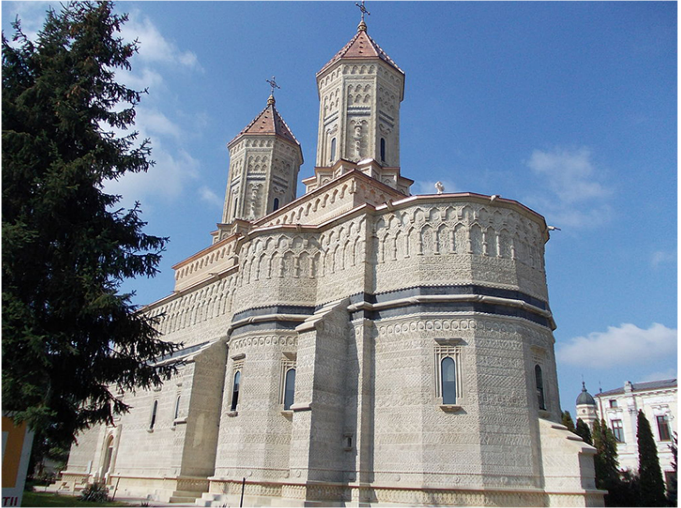
Monastyr Trzech Hierarchów (1639), Jassy