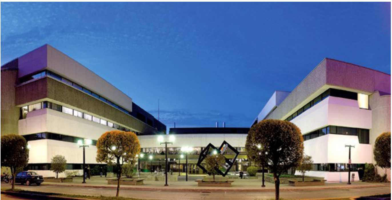
Université du Québec à Trois-Rivières.

nigdy takiej zimy nie widziałem, więc bardzo mi się spodobało. Wtedy można było stosunkowo łatwo na stałe zostać w Kanadzie. Były to złote czasy dla emigrantów. Szybko dostałem prawo pobytu i pozwolenie na pracę, a w ciągu dwóch tygodni otrzymałem pierwsze kanadyjskie zatrudnienie - post doctoral na uniwersytecie Laval, na wydziale geografii. Nie jestem geografem, tylko fizykiem, magisterium zrobiłem z geofizyki, a doktorat z meteorologii i klimatologii. Geografowie mają chyba trochę kompleksów na punkcie fizyków czy matematyków, więc byli szczęśliwi, że jakiś fizyk chce u nich pracować. No, a dla mnie był to nie tylko zaszczyt, ale i możliwość normalnego życia.