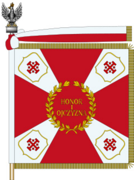
Sztandar V Dywizji Kresowej.

JL: Przed wojną mój ojciec był dowódcą pułku, stacjonującego w Nowej Wilejce, która należała wówczas do Polski. Stacjonowały tam trzy pułki - 85 pułk strzelców wileńskich, 13 pułk kawalerii i 19 pułk artylerii. Był to jeden z większych ośrodków wojskowych w przedwojennej Polsce. Miasteczko było małe, ale koszary, oddalone o jakieś 3 km, stanowiły duży kompleks. Ja się urodziłem w Warszawie, ale mój młodszy brat urodził się w Nowej Wilejce i to akurat w dzień święta pułkowego. Odbyła się wtedy wielka była uroczystość, syn dowódcy, dostał pamiątkowy dyplom itd.