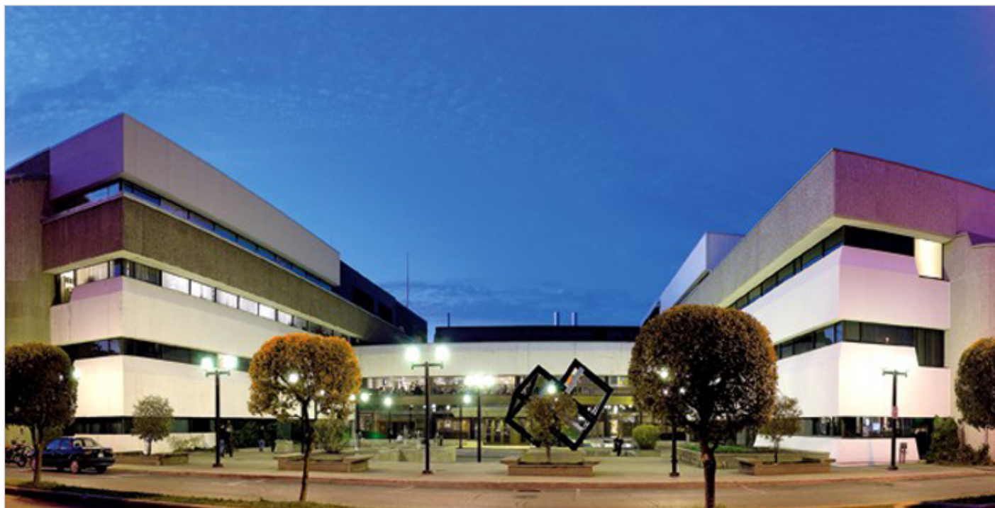
Université du Québec à Trois-Rivières.

śniegi, jak to opisywano w książkach, z wykopanymi tunelami i przejściami. W Polsce nigdy takiej zimy nie widziałem, więc bardzo mi się spodobało. Wtedy można było stosunkowo łatwo na stałe zostać w Kanadzie. Były to złote czasy dla emigrantów. Szybko dostałem prawo pobytu i pozwolenie na pracę, a w ciągu dwóch tygodni otrzymałem pierwsze kanadyjskie zatrudnienie – post doctoral na uniwersytecie Laval, na wydziale geografii. Nie jestem geografem, tylko fizykiem, magisterium zrobiłem z geofizyki, a doktorat z meteorologii i klimatologii. Geografowie mają chyba trochę kompleksów na punkcie fizyków czy matematyków, więc byli szczęśliwi, że jakiś fizyk chce u nich pracować. No, a dla mnie był to nie tylko zaszczyt, ale i możliwość normalnego życia.