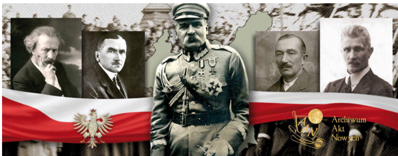
Twórcy polskiej niepodległości, od lewej: Ignacy Jan Paderewski, Roman Dmowski, Józef Piłsudski, Wincenty Witos, Ignacy Daszyński