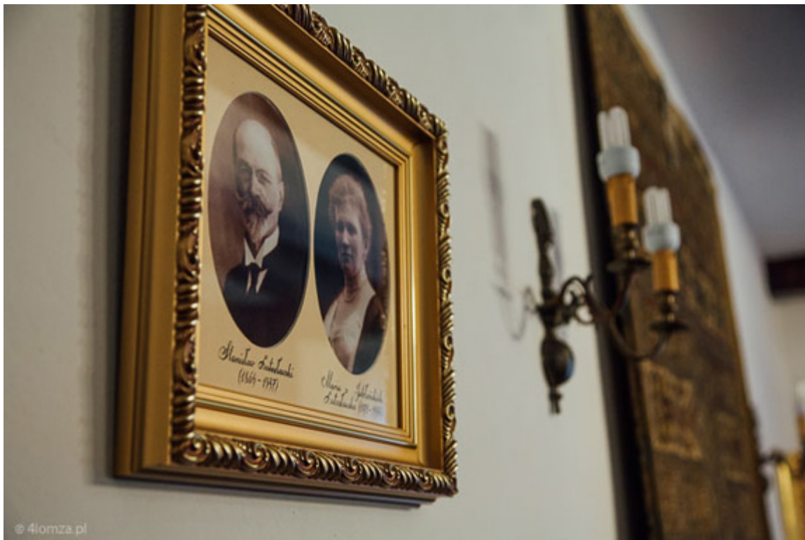
Dwór Lutosławskich w Drozdowie, koło Łomży.