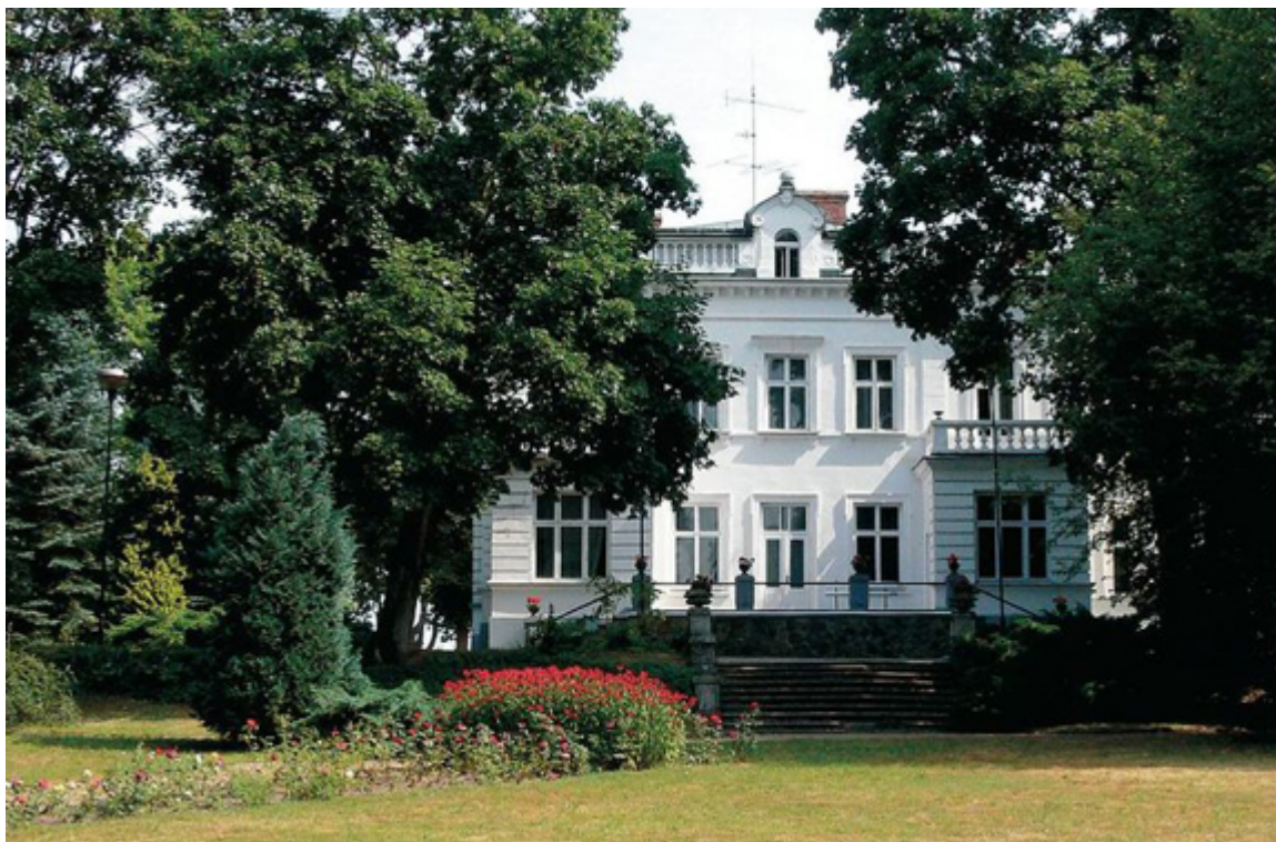
Dwór Lutosławskich w Drozdowie, koło Łomży.