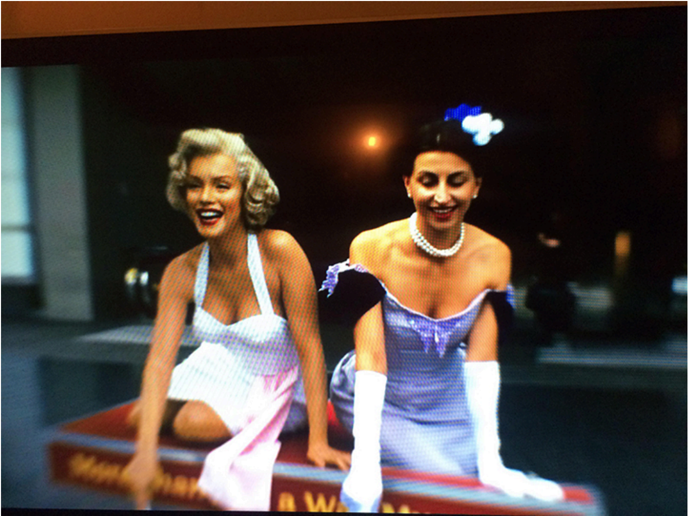
Kadr z video, fot. Bartosz Nalązek.