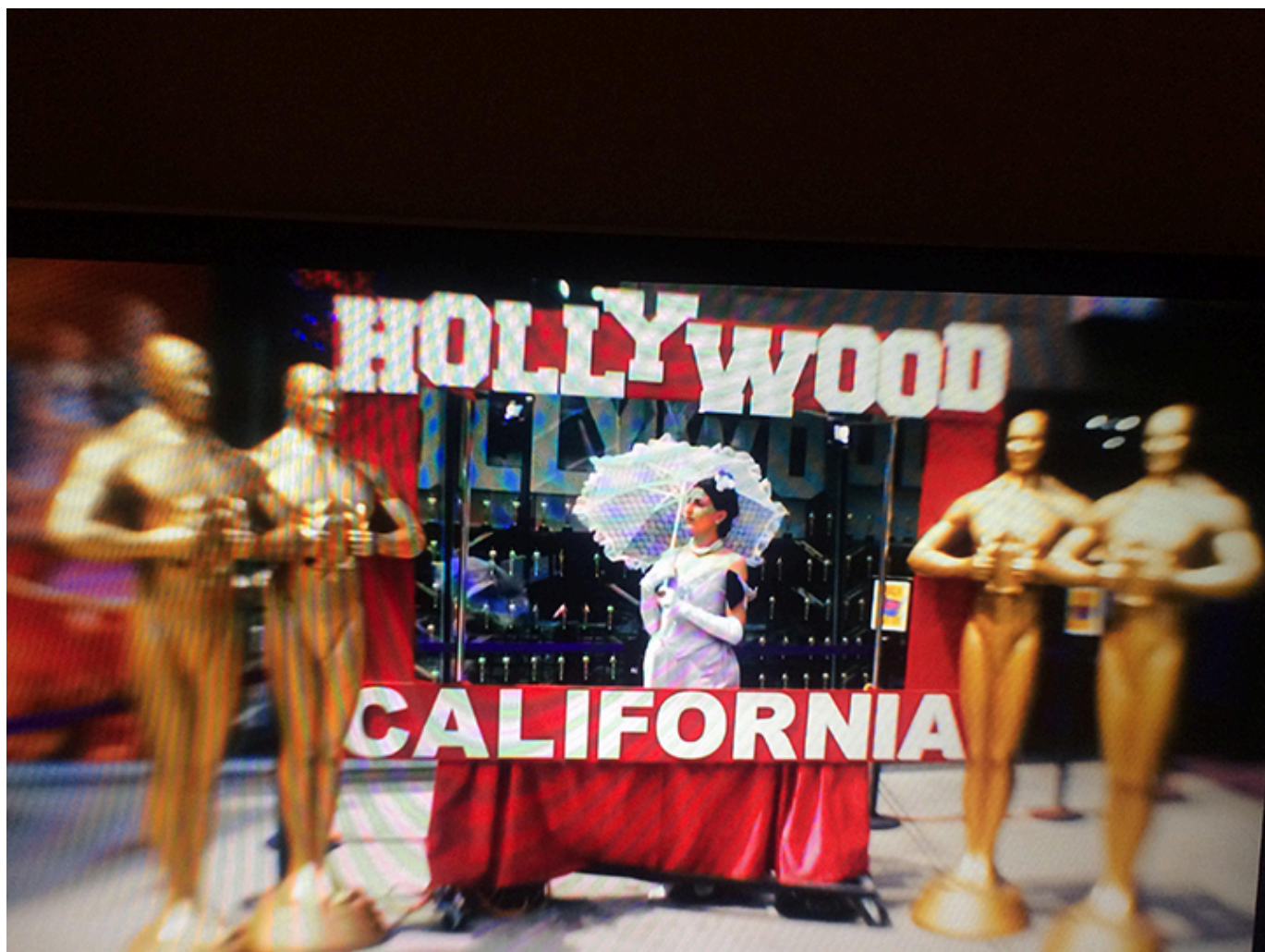
Kadr z video, fot. Bartosz Nalązek.