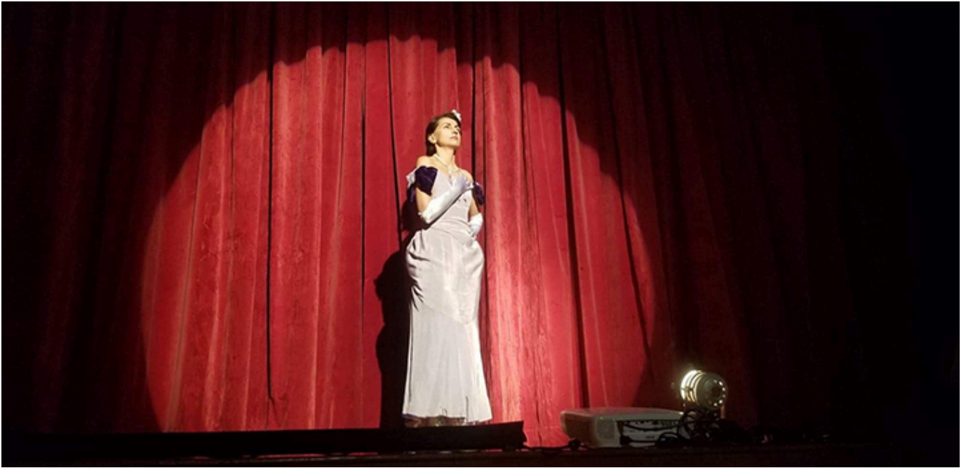
Marta Ojrzyńska, jako Helena Modrzejewska