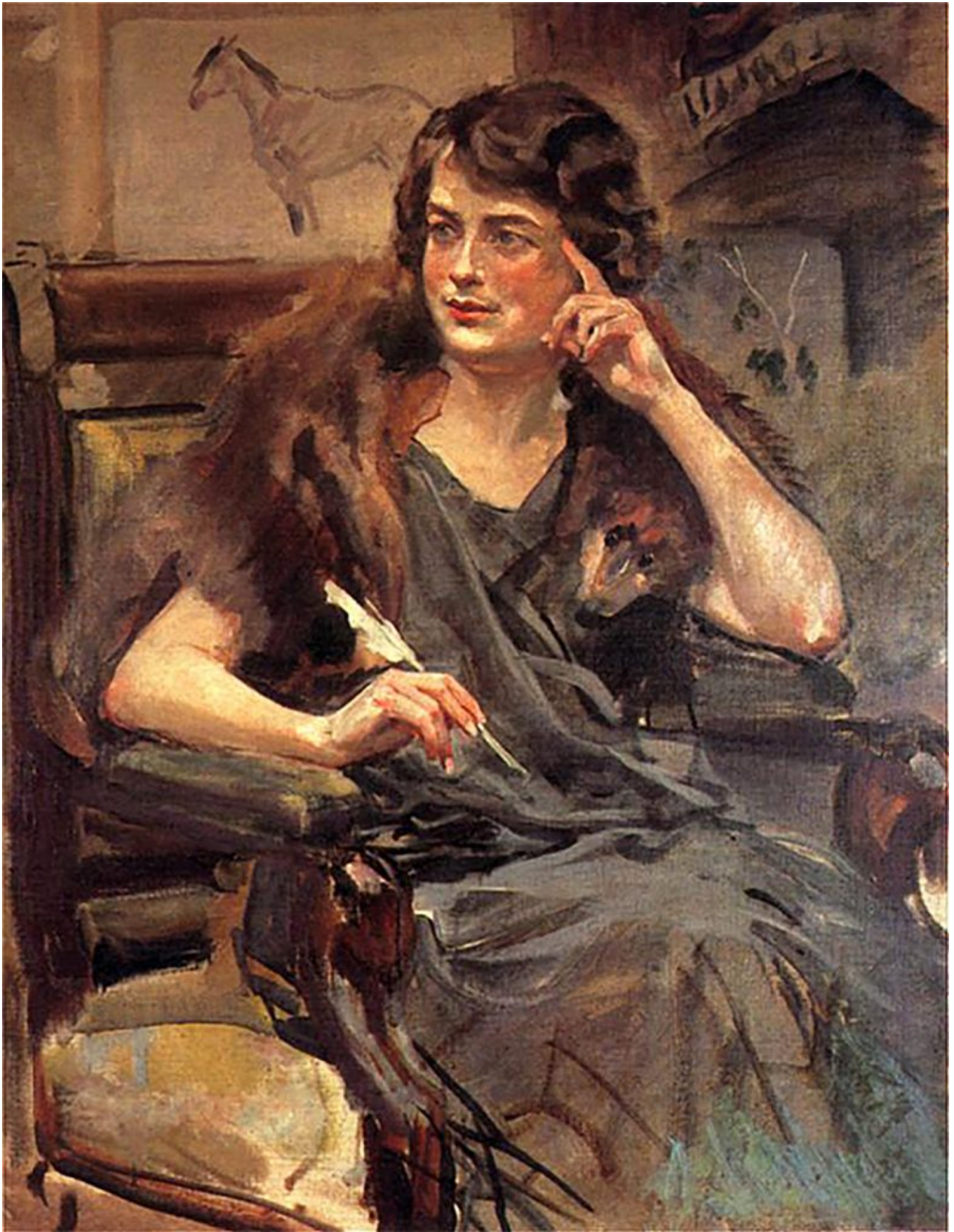
Magdalena Samozwaniec na portrecie pędzla Wojciecha Kossaka.