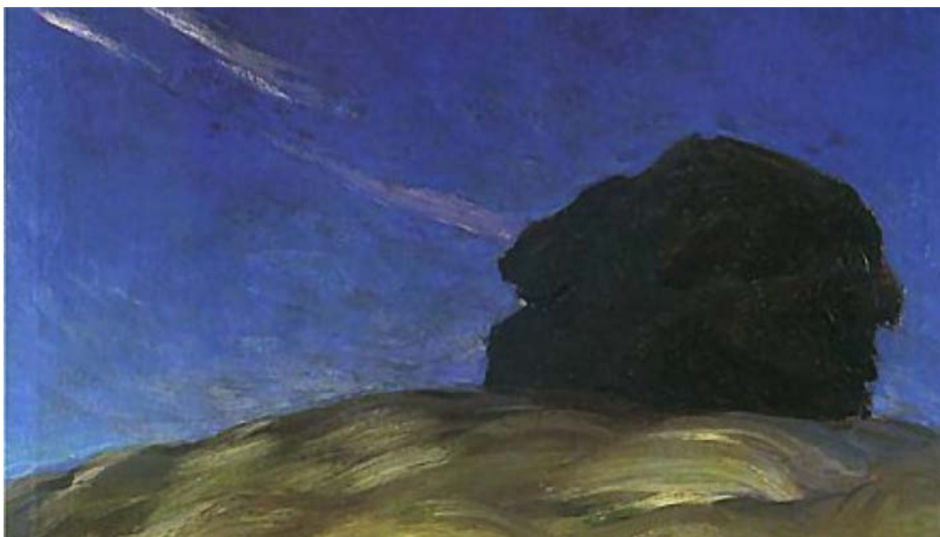
Ferdynand Ruszczyc, „Obłok”, 1902, olej na płótnie, 110 x 80 cm, wł. Muzeum Narodowe w Poznaniu.

Zdjęcia ukazują różne strony życia na Syberii, ludzi przy pracy. Dopełniają one kronikę syberyjskiego szlaku nie tylko rodziny Dargiewiczów, lecz wielu, którym wypadło razem żyć i dzielić trudny los.