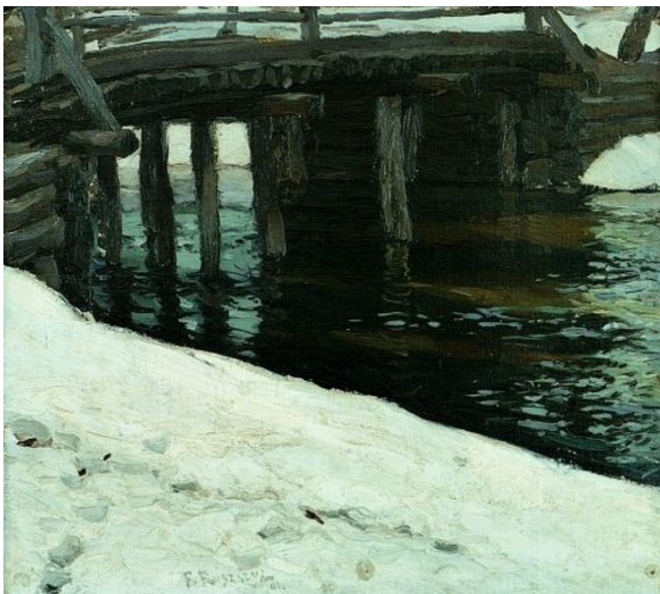
Ferdynand Ruszczyc Most zimą.