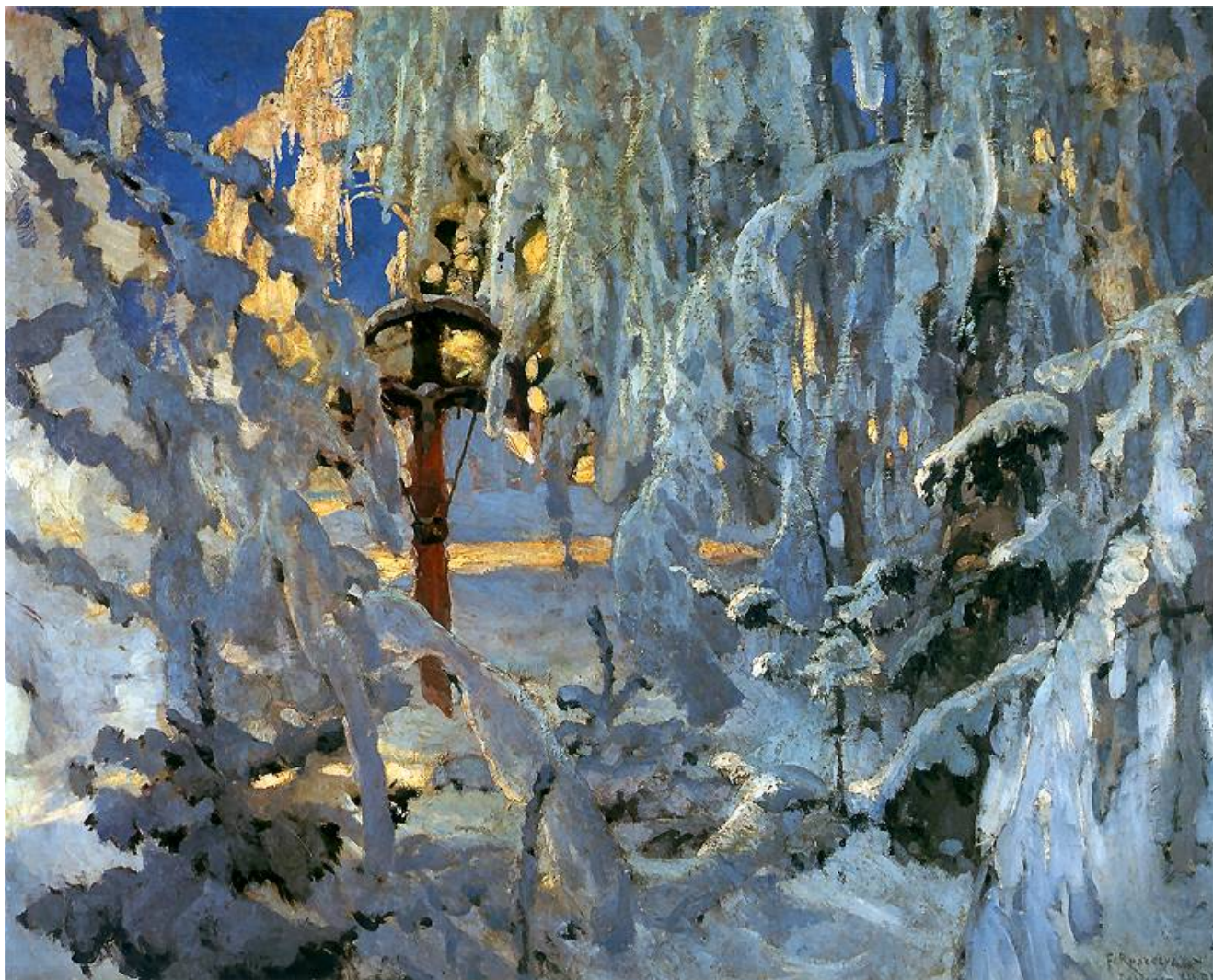
Krzyż w śniegu 1902. Olej na płótnie. 104 x 128 cm. Własność prywatna.