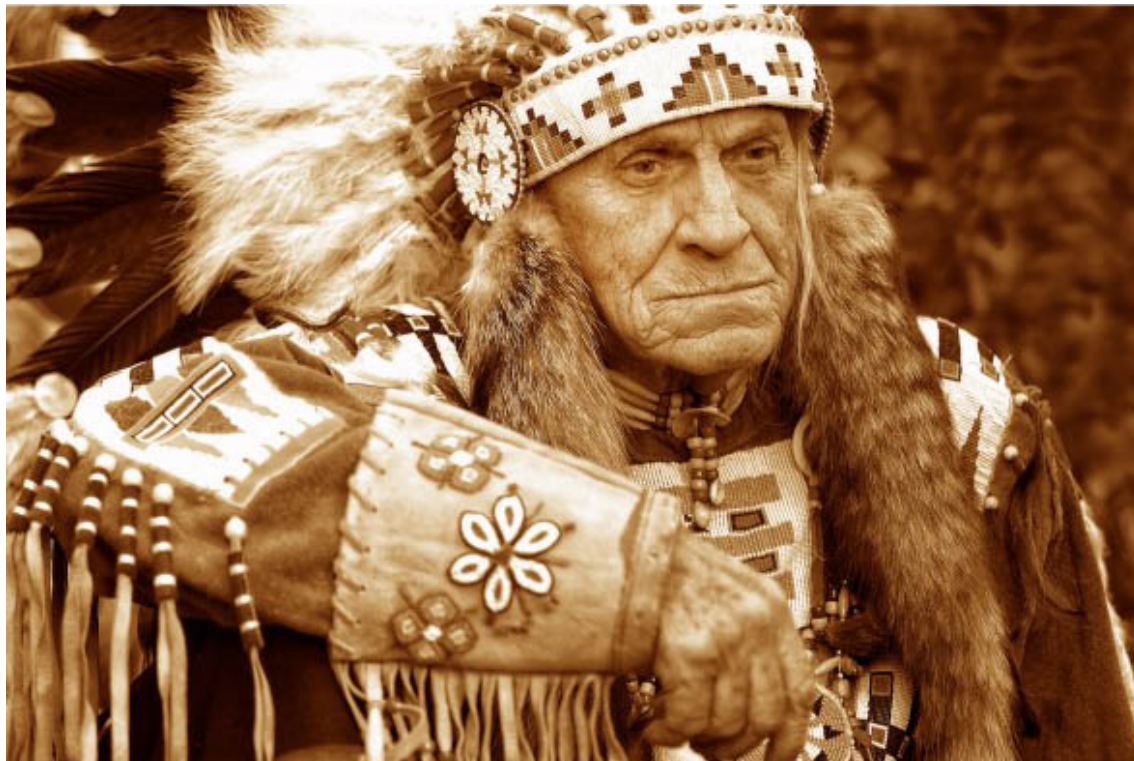
Sat-Okh, fot. Daniel Pach, photopach.