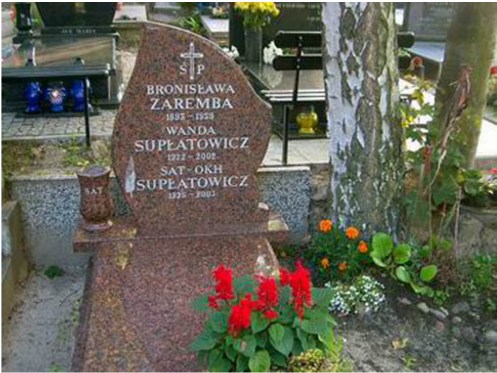
Film o Sat-Okhu: