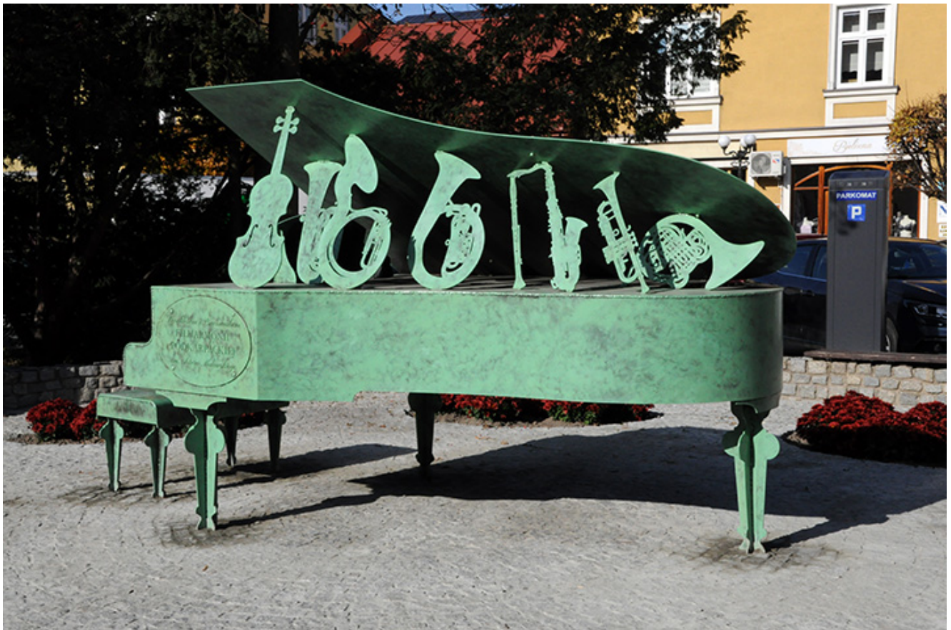
Pomnik poświęcony 60-tej rocznicy Dni Muzyki Kameralnej w Łańcut, fot. Wrzesław Żurawski

Maronia. W końcu Filharmonia doceniana przez władze wojewódzkie i państwowe otrzymała własną siedzibę w 1974 roku. Jej prestiż rósł z każdym rokiem, ale wizytówką na skalę międzynarodową był zawsze Łańcut.