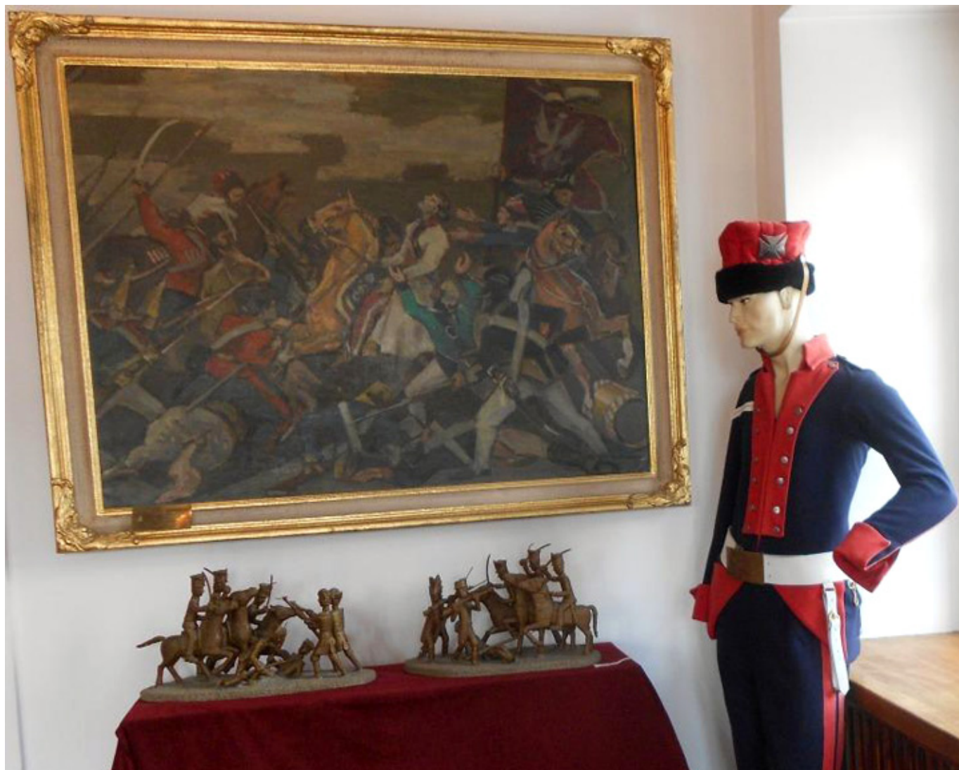
Muzeum Tadeusza Kościuszki w Maciejowicach, fot. Barbara Kukulska.