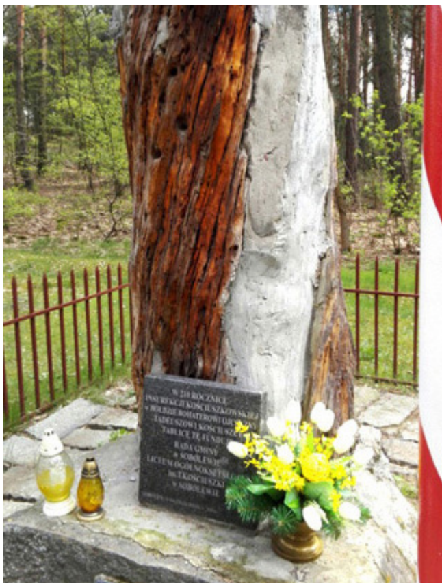
Pamiętkowe drzewo-pomnik

Na szczycie wzgórka zbudowanego z kamieni znajduje się na postumencie drewniany krzyż. Krzyż został wystawiony w setną rocznicę zgonu Tadeusza Kościuszki (zm. 15.10.1817), a usytuowanie Kopca według tradycji jest miejscem, gdzie wielki wódz przelał swą krew za wolność Ojczyzny.