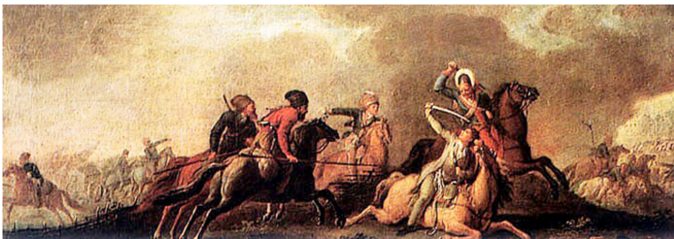
Jan Bogumił Plersch, Bitwa pod Maciejowicami, Tadeusz Kościuszko spada z konia

Pierwszy krok do zrzucenia niewoli to odważyć się być wolnym, pierwszy krok do zwycięstwa poznać się na własnej sile.