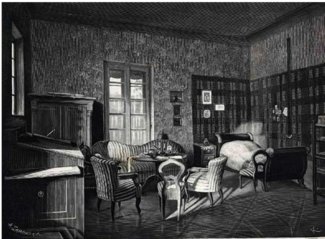
Wnętrze pokoju Aleksandra hr. Fredry. Według fotografii Trzemeskiego.