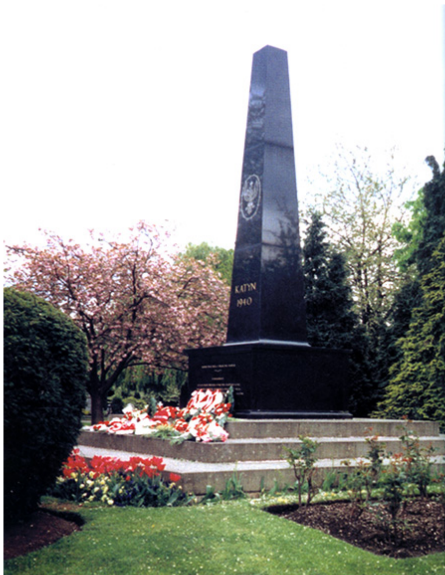
Pomnik Katyński w Gunnersbury, Londyn