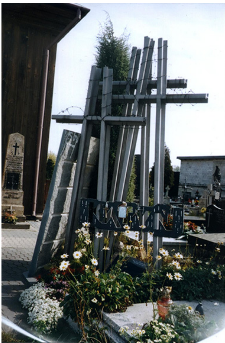
Pomnik Katyński na cmentarzu w Opocznie, fot. Janusz Krasicki