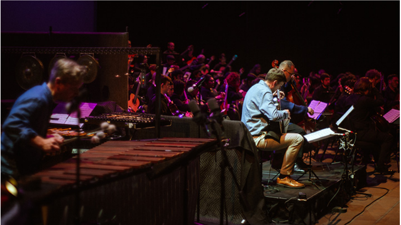
Fenomenalny koncert w Aisd Performing Arts Center w Austin, 18-tego lutego 2023 r.