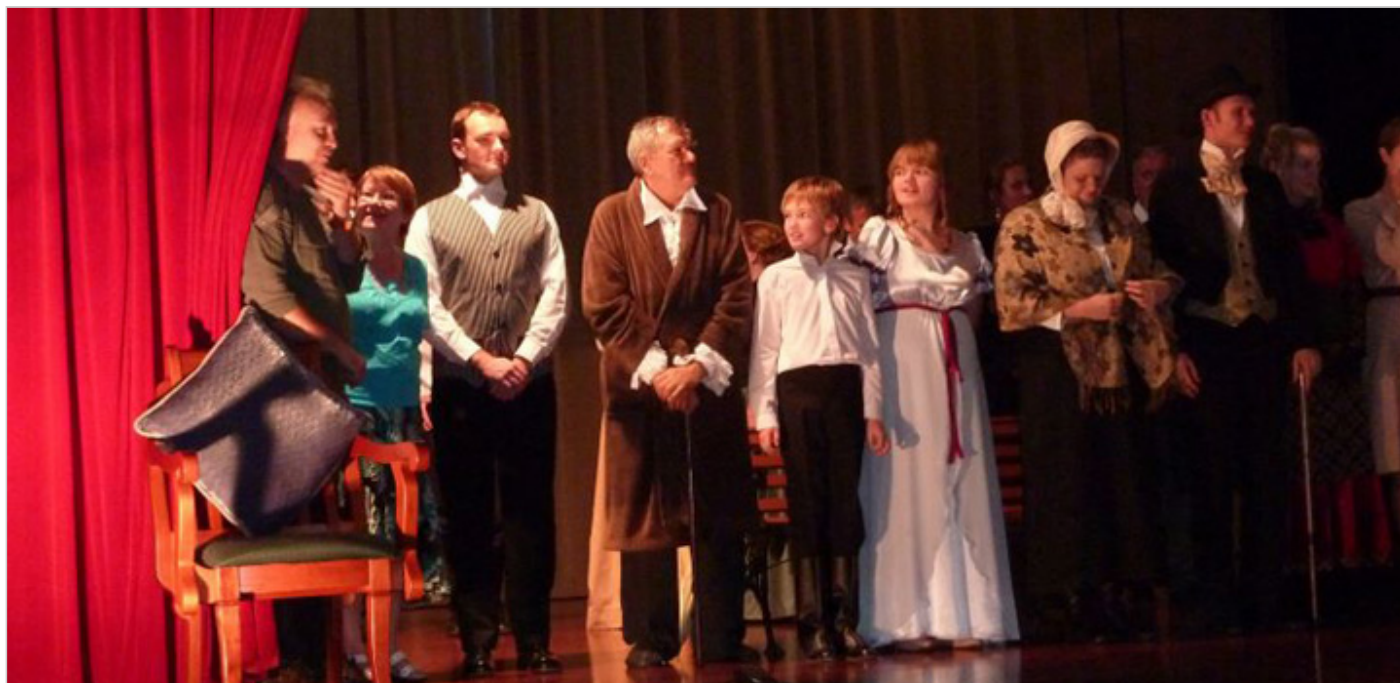
Zespół teatru Scena 98 z Perth po spektaklu „Portret z kobietami”, 2011 r., fot. Anna Habryn.

Natomiast sztuka Habryn dociera skutecznie do widza i czytelnika, nadając życie ceniom i docierając tam, gdzie uczone dzieła nie dotrą. I powinna być udostępniona nie tylko Polonii, lecz i widzom w Polsce.