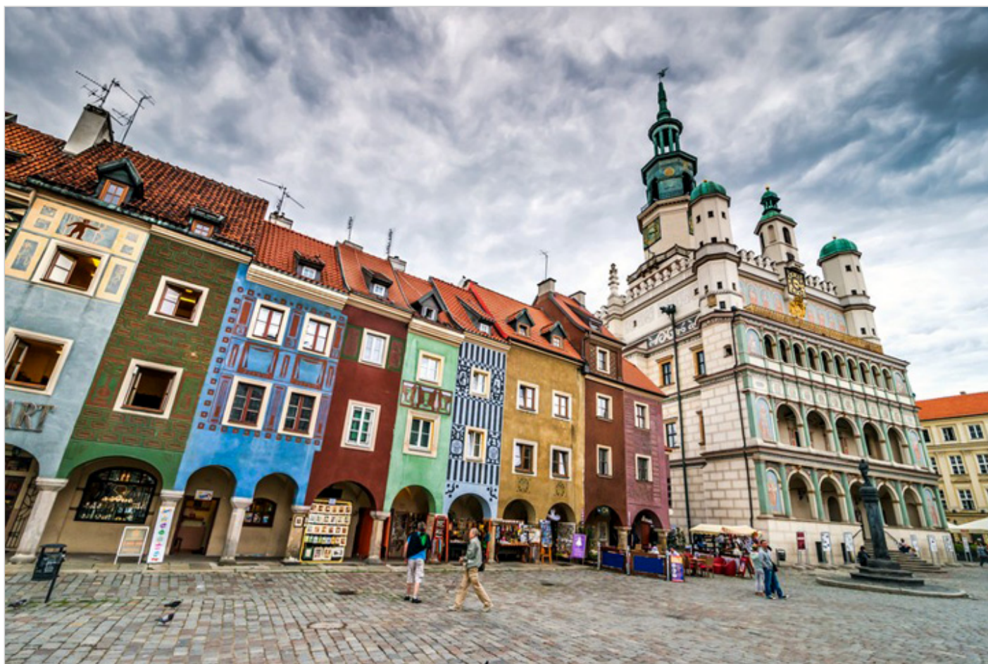
Poznańskie Stare Miasto