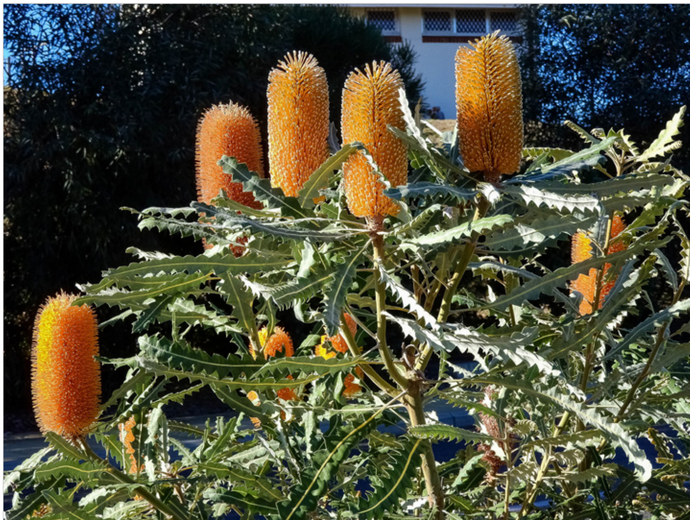
Australijskie świczki