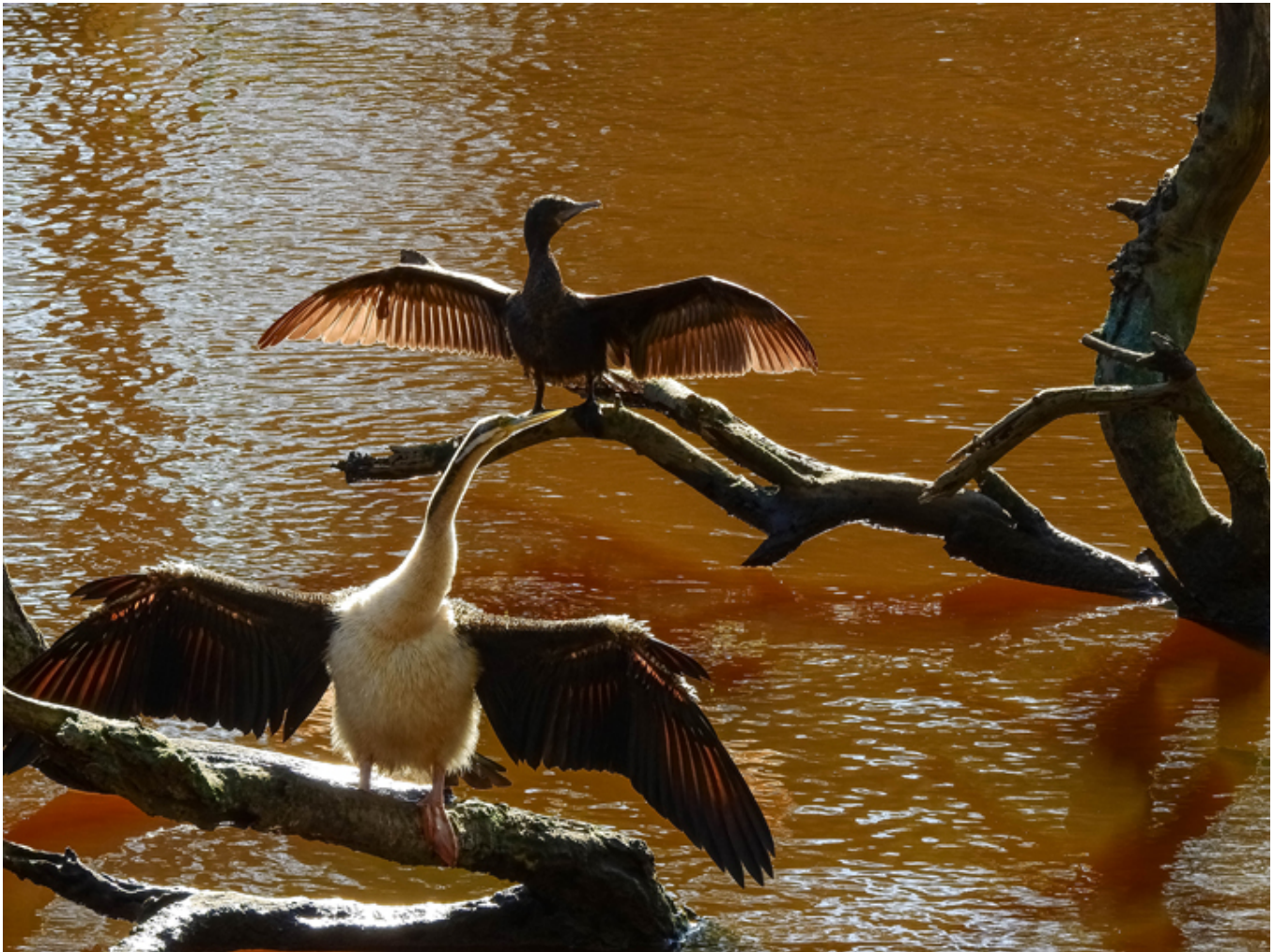
Na skrzydłach kormoranów