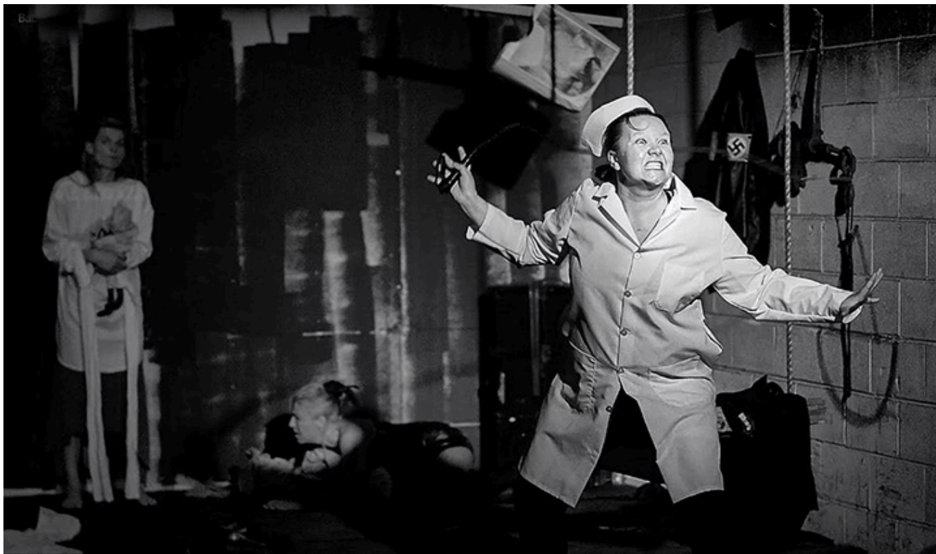
Teatr Nasz, „Bal w operze” Juliana Tuwima

czarnym, skórzanym kostiumie, która władczy gestem strzela z bata, jakim tresuje się dzikie zwierzęta. Nie ma wątpliwości, jesteśmy pod nadzorem.