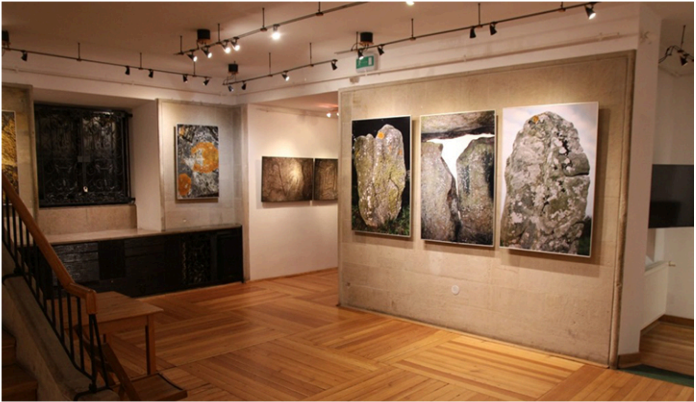
Muzeum Ziemi.