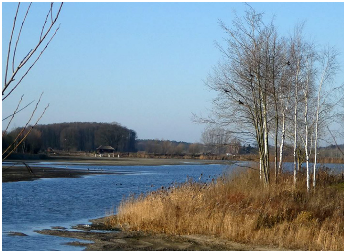
Malownicze stawy rybne w Bełdowie/Zgniłych Błotach