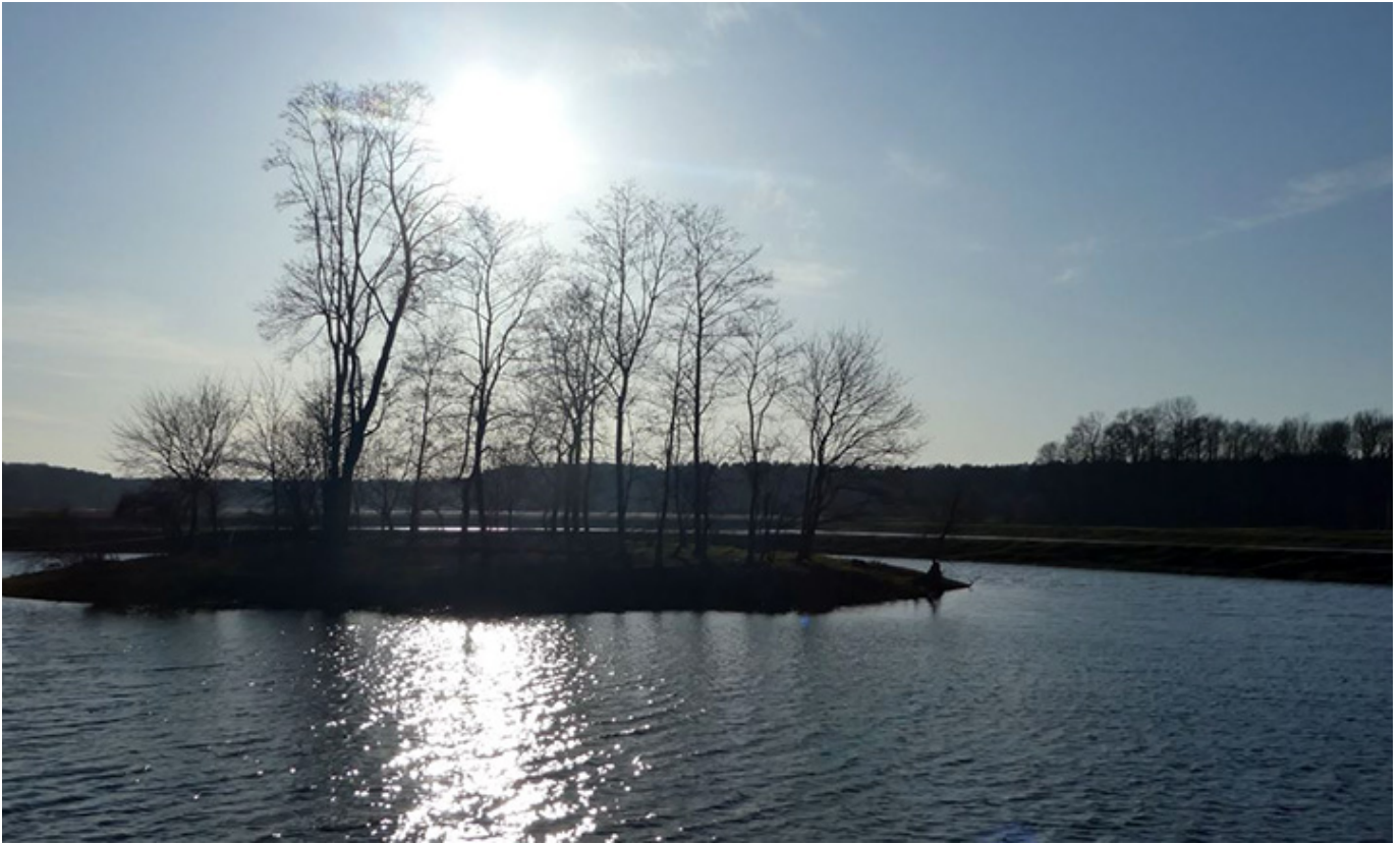
Malownicze stawy w Bełdowie