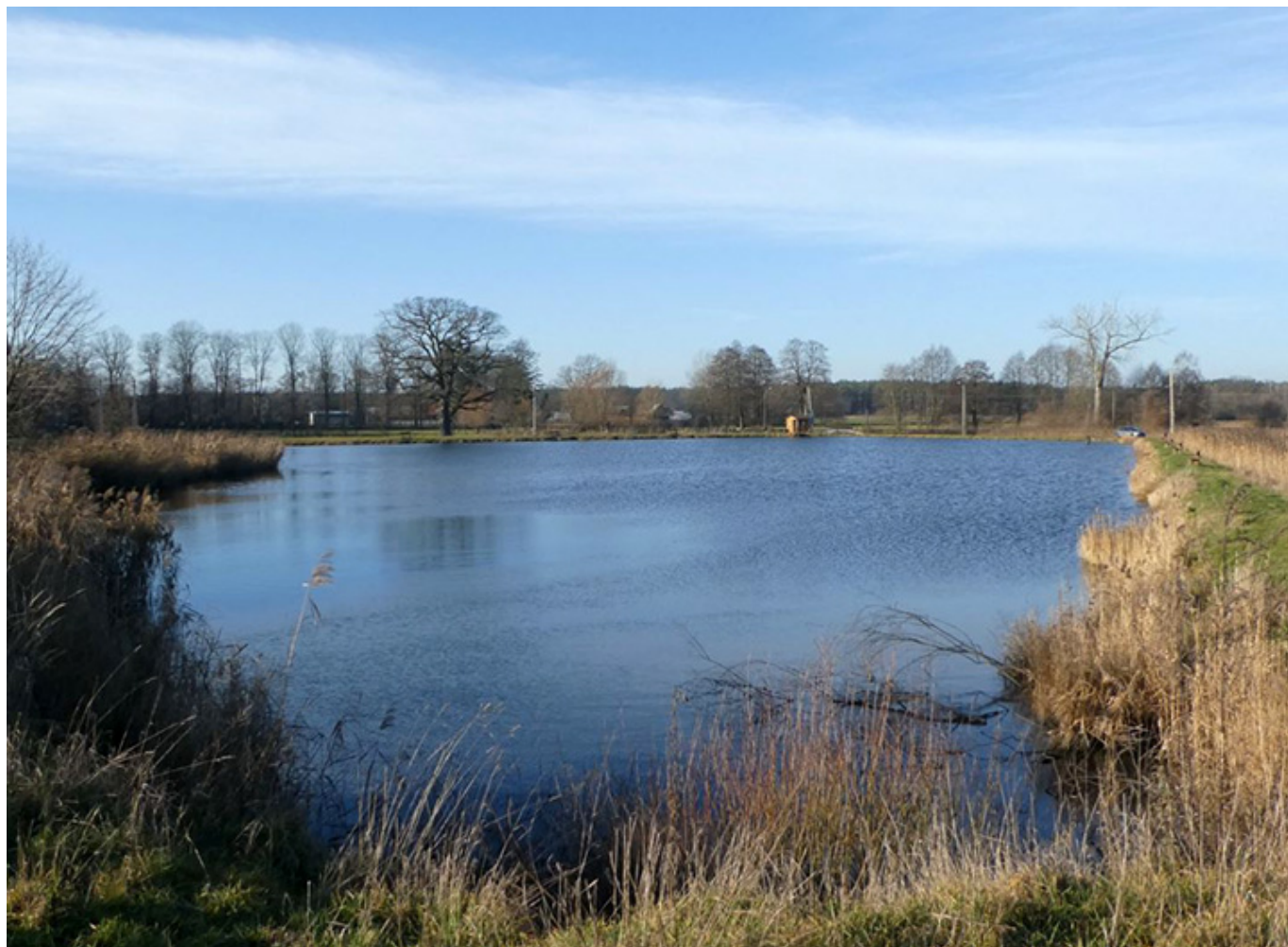
Malownicze stawy rybne w Bełdowie/Zgniłych Błotach, fot. Andrzej Sokołowski