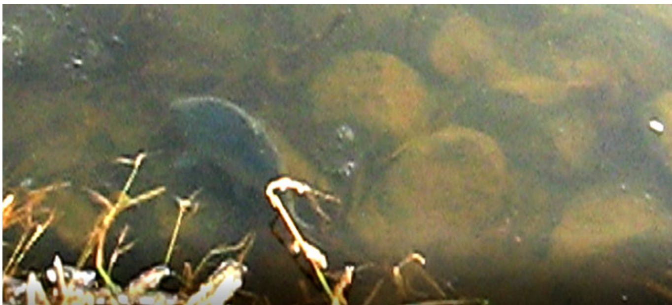
Karp wypuszczony na wolność

Kiedy tata zachorował, prawie rok opiekowałam się nim w Polsce. Wtedy byłam też na ostatniej wspólnej Wigilii w 2013 r. Czuliśmy, że może przyjść najgorsze, ale nikt z nas nie chciał się do tego przyznać. Szykowaliśmy z tatą Świąta, jakby nic się nie miało zdarzyć. Kupiliśmy najpiękniejszą choinkę, jaka kiedykolwiek była w domu.