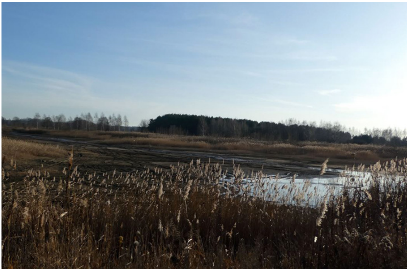
Malownicze stawy rybne w Bełdowie/Zgniłych Błotach, fot. Andrzej Sokołowski