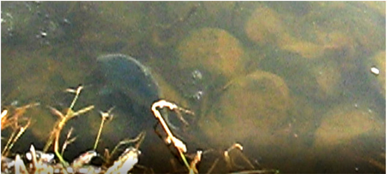
Karp wypuszczony na wolność

Kiedy tata zachorował, prawie rok opiekowałam się nim w Polsce. Wtedy byłam też na ostatniej wspólnej Wigilii w 2013 r. Czuliśmy, że może przyjść najgorsze, ale nikt z nas nie chciał się do tego przyznać. Szykowaliśmy z tatą Święta, jakby nic się nie miało zdarzyć. Kupiliśmy najpiękniejszą choinkę, jaka kiedykolwiek była w domu. Ubrana starymi bombkami, lśniła, mieniła się wszystkimi kolorami tęczy, pachniała i wyglądała czarodziejsko. Pojechaliśmy też po karpie na farmę do Bełdowa. Wtedy brałam udział w rytuale wypuszczania karpia na wolność. Było zimno, wiał wiatr, na brzegu jeziora był śnieg i lód, pożółkłe szuwary broniły dostępu do wody. Trzeba było zejść ostrożnie z karpem w wiadrze na brzeg, żeby mógł wrócić do natury. Karp chwilę był zdezorientowany, ale za moment machnął ogonem i popłynął „w siną dal”. Jeszcze jakiś czas słychać było delikatny plusk wody, który potem zmieszał się z szumem wiatru. Tata źle się czuł, trudno mu było wysiąść z samochodu. Ja miałam łyżę pod