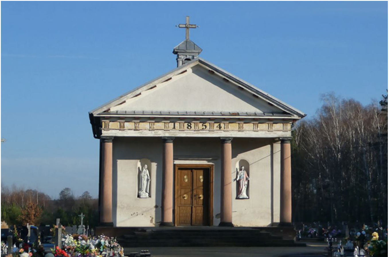
Kaplica rodziny Wężyków na cmentarzu

Archiwum posiada też wykaz żołnierzy wojska polskiego z 1832 r. zamieszkałych w gminie Bełdów . Czyżby po upadku Powstania Listopadowego chciano wiedzieć ile wojska można zgromadzić na tym terenie, w razie kolejnego konfliktu zbrojnego? Na pewno ludność z tych okolic popierała Powstanie. Świadczy o tym chociażby notatka zamieszczona w „Kuryerze Polskim” o przekazywaniu na szeroką skalę, koszul, prześcieradeł na bandażę czy pościeli do lazaretów warszawskich, w których opatrywano powstańców.