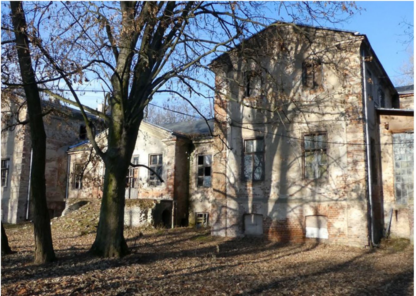
Niestety, obecnie dwór w Beldowie jest opuszczony i niszczy