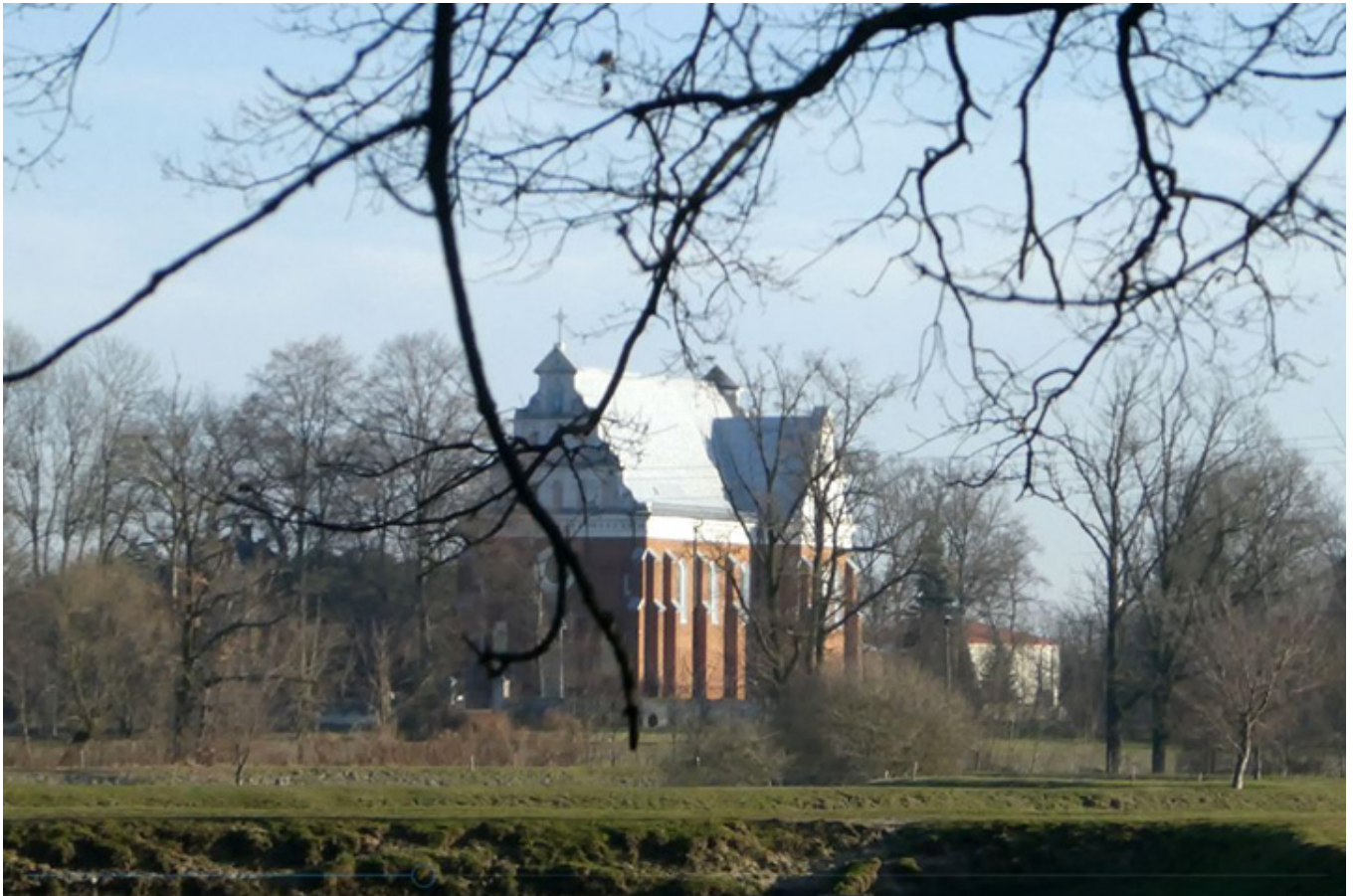
Kościół Wszystkich Świętych w Bełdowie