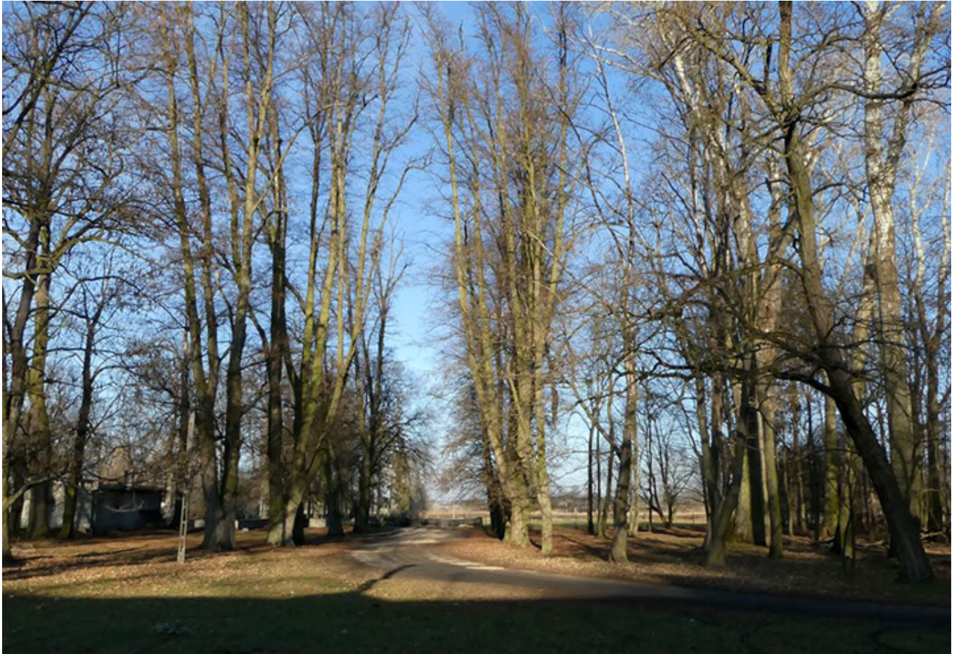
Park krajobrazowy otaczający dwór w Bełdowie

Rozwinęła się natomiast inna wieś należąca do Bełdowskich – Zgniłe Błota. Powstał tu ośrodek wypoczynkowy z kąpieliskiem oraz zalew. Wykorzystano w tym celu kilka połączonych stawów. Można teraz tu żeglować i uprawiać sporty wodne.