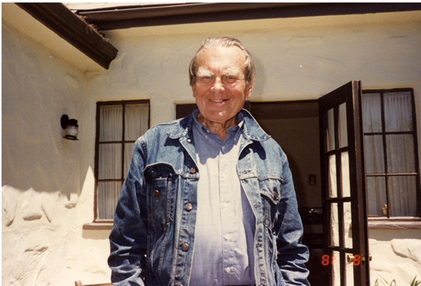
Czesław Miłosz w Berkeley