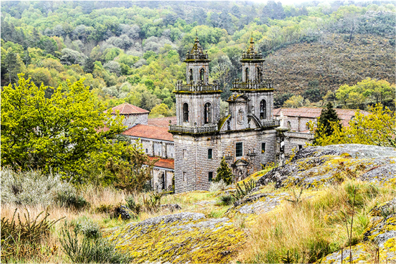
Camino 2022 r.

[Redacted text block consisting of multiple horizontal black bars]