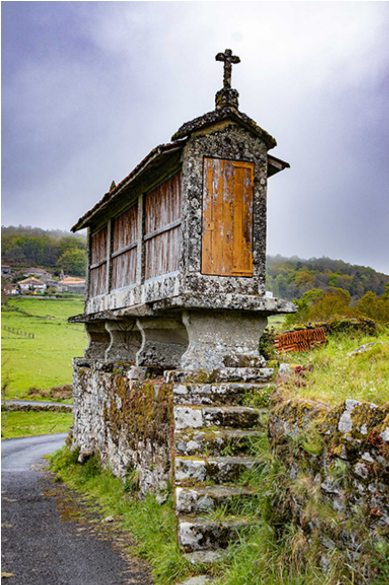
Camino 2022 r., fot. Czesław Sornat