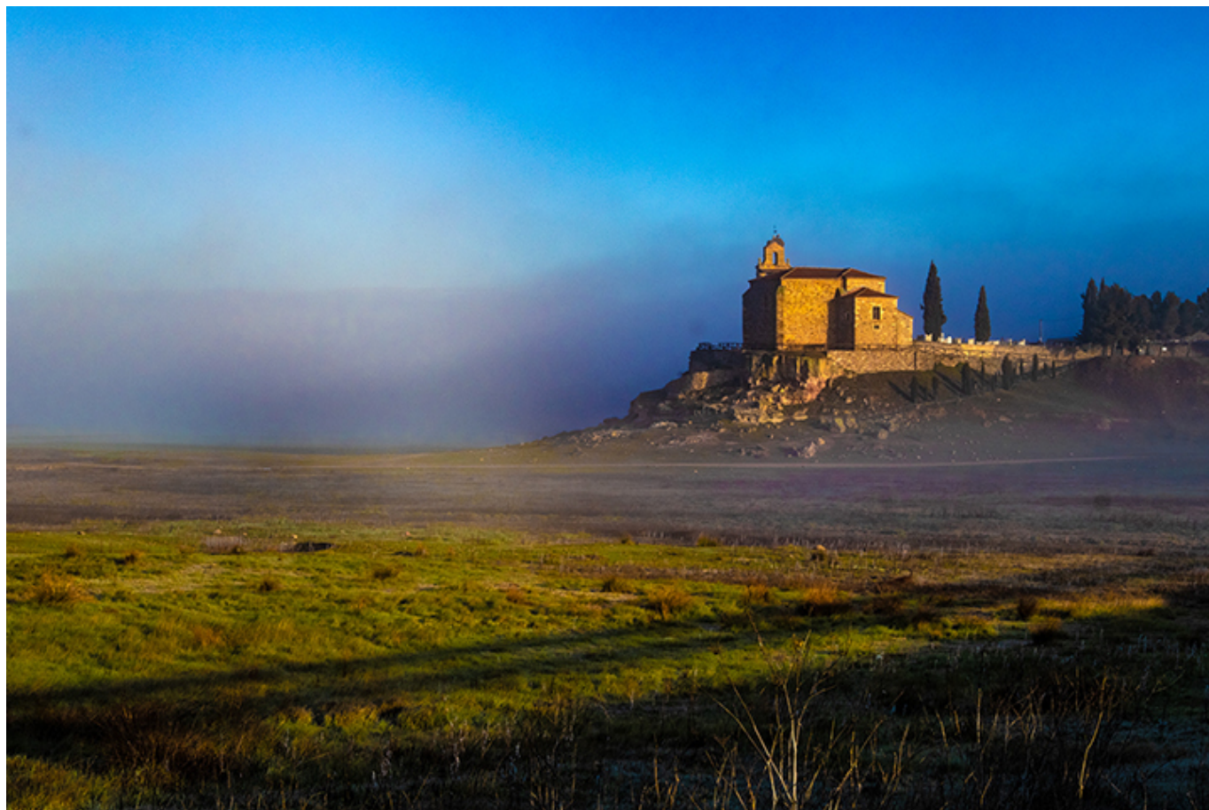
Camino 2022 r., fot. Czesław Sornat