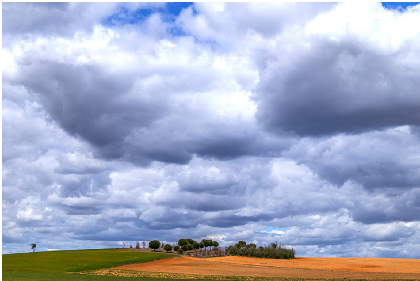
Camino 2022 r.