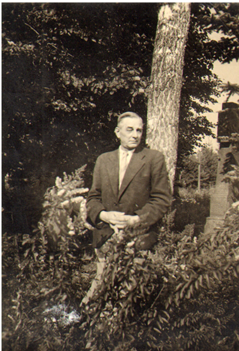
K. Pawlak, Pacyna koło Żychlina, 1946 r.

[REDACTED] [REDACTED] [REDACTED] [REDACTED] [REDACTED] [REDACTED] Ciotka Wanda opowiadała, że cierpiał na przewlekłe bóle głowy. Twierdziła, że przeżycia wojenne, mimo upływu czasu, wciąż w nim tkwiły.