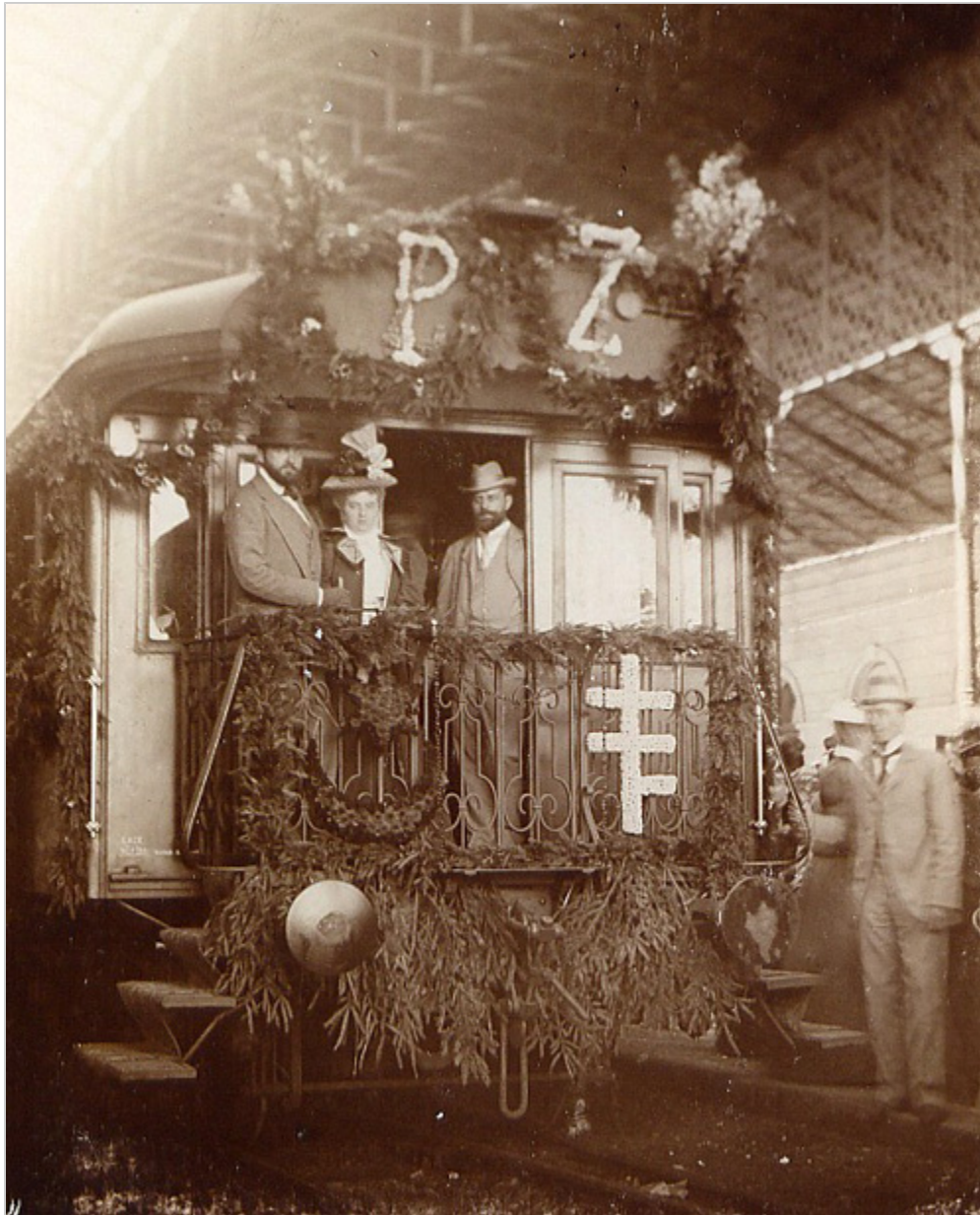
Wjazd pociągiem do Dzikowa