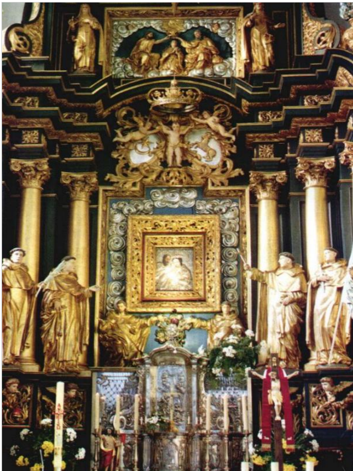
Obraz Matki Boskiej Dzikowskiej w kościele oo

wyniknie. Ale co dalej będzie? Czas pokaże.