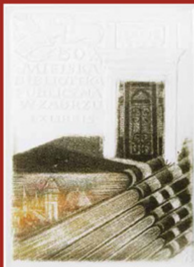
Miejska Biblioteka Publiczna w Zabrzu Öffentliche städtische Bibliothek in Zabrze 1995 | intaglio

Album Kazimierza Szołtyśka z okazji 40-lecia pracy artystycznej