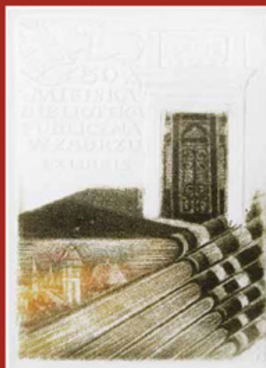
Miejska Biblioteka Publiczna w Zabrzu Öffentliche städtische Bibliothek in Zabrze 1995 | intaglio

Album Kazimierza Szołtyska z okazji 40-lecia pracy artystycznej